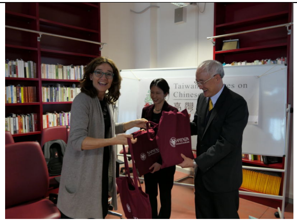
羅馬講座：Brezzi 教授贈送禮物