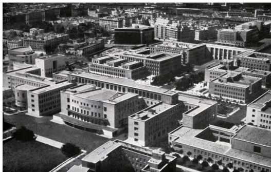
羅馬大學「大學城」校區鳥瞰圖（1938年）