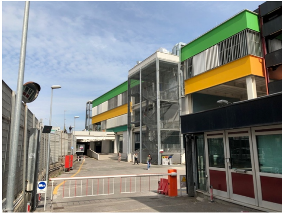
羅馬大學東方學系所在之馬可波羅大樓