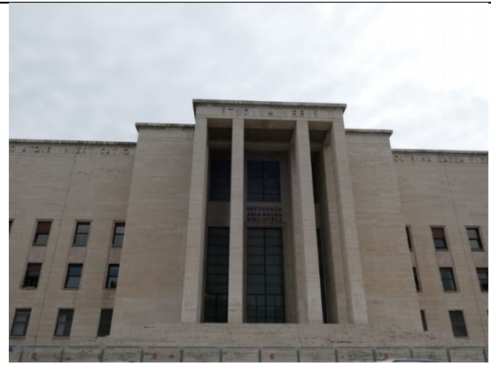
參觀羅馬大學「大學城」校區的主建築