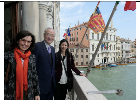
參訪威尼斯大學主建築福斯卡里宮