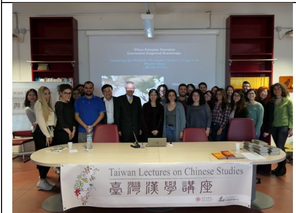
羅馬講座：活動結束後與聽眾合影留念