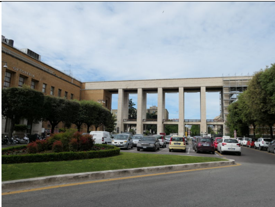
參觀羅馬大學「大學城」校區大門