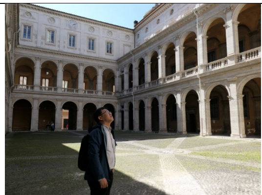
參觀羅馬大學舊校舍「智慧宮」 （現為羅馬國家檔案館）