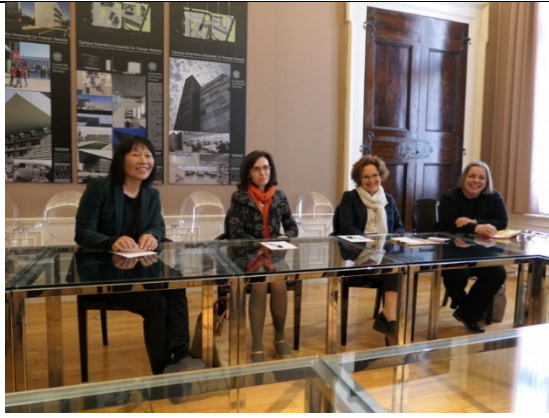
於威尼斯大學校長室洽談未來合作事宜