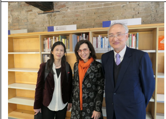
參訪威尼斯大學 Cultural Flow Zone 圖書館