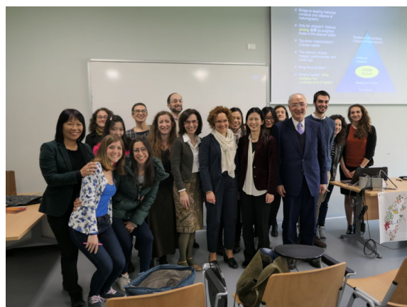
威尼斯講座：活動結束後合影留念