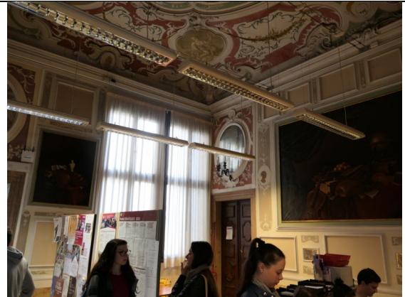
參訪威尼斯大學亞洲與北非研究學系