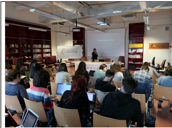
羅馬講座：演講進行中的場景