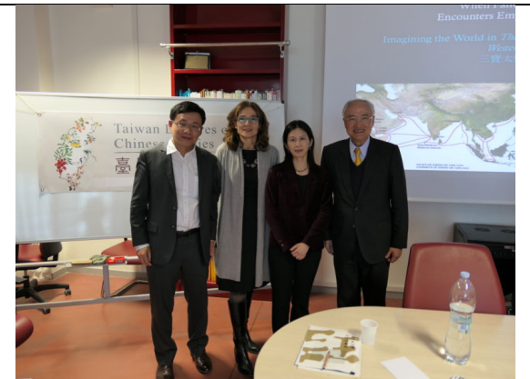
羅馬講座：活動結束後合影留念