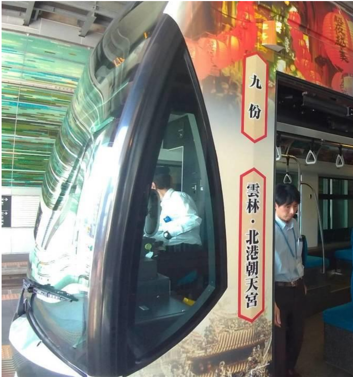
觀光局在日本富山推出「台灣 30 選」觀光列車，至 9 月底為止將行駛於富山市區，向富山人宣傳台灣之美。