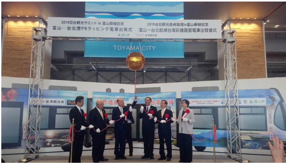
台灣彩繪電車啟動儀式