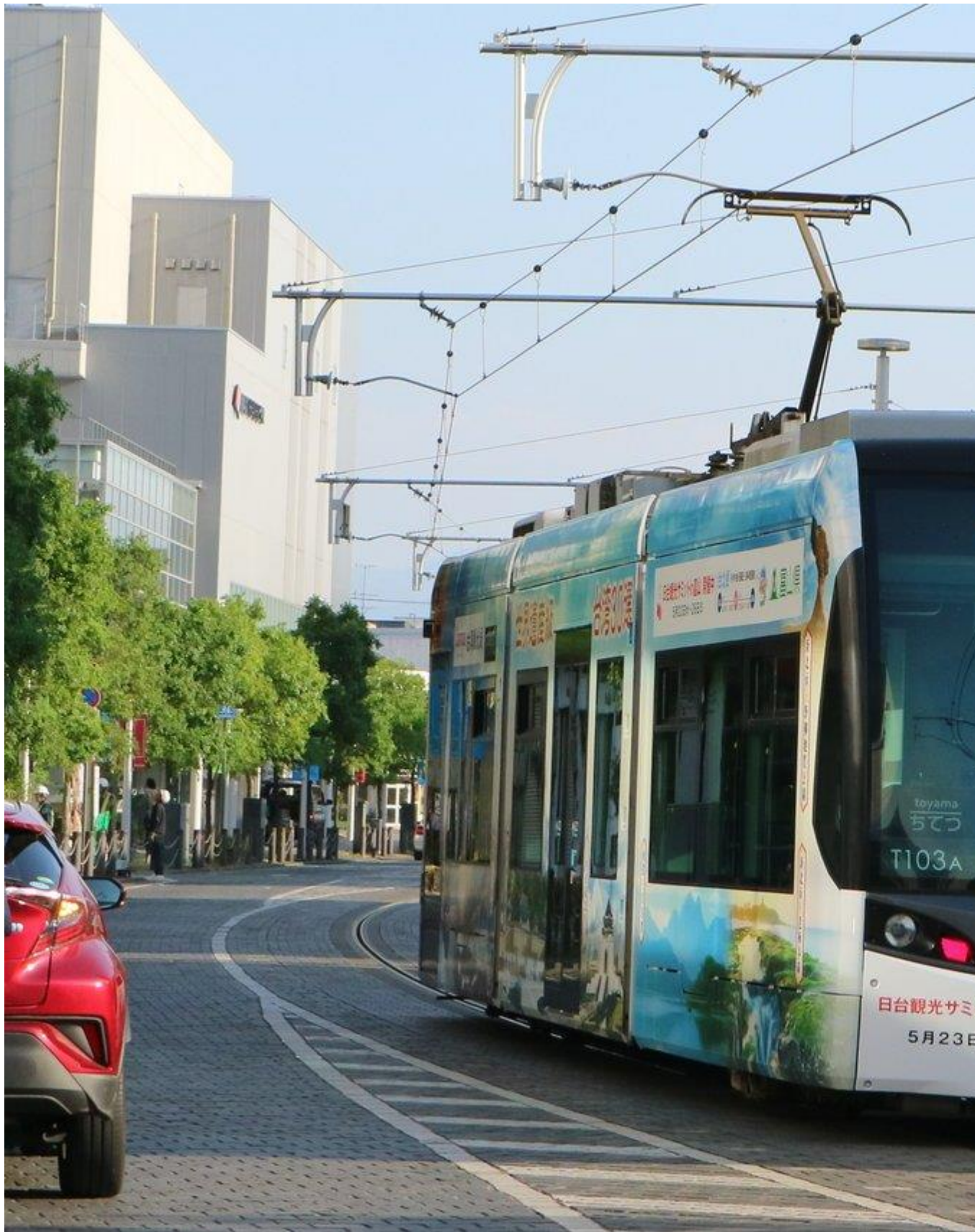
觀光局在日本富山推出「台灣 30 選」觀光列車，至 9 月底為止將行駛於富山市區，向富山人宣傳台灣之美。