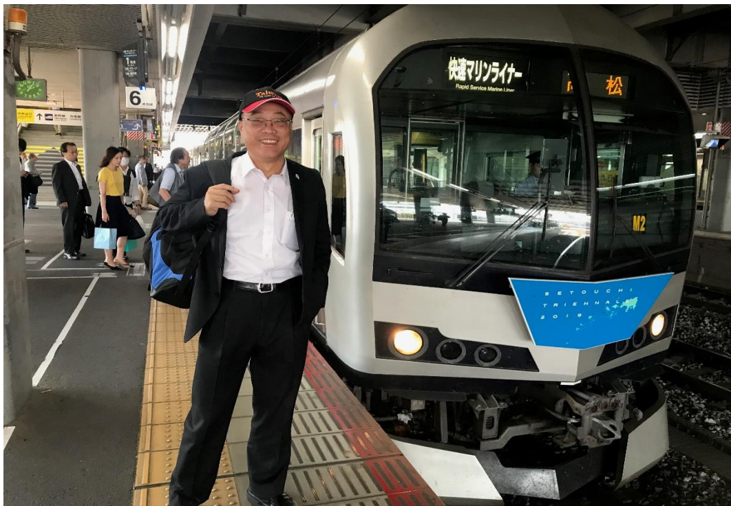
搭乘岡山至高松 Marine Liner 跨海列車

Marine Liner 是日本西日本鐵路公司和四國鐵路公司自 1988 年 4 月開始運營的日本火車服務，海運班輪連接岡山縣首府岡山和三洋新幹線的主要車站，高松，通過大瀨戶大橋，在四國島上的香川縣首府，以 130 公里/小時的最高速度運行，行程大約需要 55-60 分鐘，日本朋友搭乘大眾運輸工具人口比例居世界前列，故於日本市場行銷推廣台灣觀光，大眾運輸場站、運具成為不可或缺一環，利用本次行程移動實地考察。