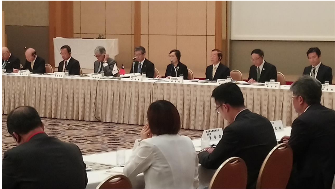
2019 台日觀光高峰論壇 in 富山