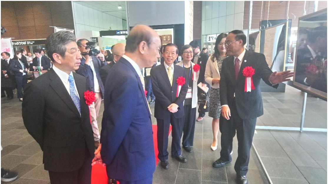
富山車站鐵道攝影展

(三)富山彩繪電車宣傳 2019 小鎮漫遊年：在臺灣和日本的名曲中，提到鐵路、火車多半帶有離家的鄉愁，當然也有回家的期待，而在重視旅遊休閒的現代，它除了是與家的「牽絆」，更代表著「旅之伴（旅遊的好伙伴）」，鐵道可以說是台日共通的元素，也是旅遊的好伙伴，此次透過鐵道觀光攝影展，能讓大家看到照片，有跟著鐵道一起去旅行的幸福，另利用富山便利路面電車，以「發掘日本人還不熟悉的台灣新觀光素材」為概念，和我們共同推出「世界遺產級 台灣 30 選」企劃彩繪電車，搭配 2018 海灣年、2019 小鎮年、2020 山脈年主題來逐步行銷「新的台灣」。