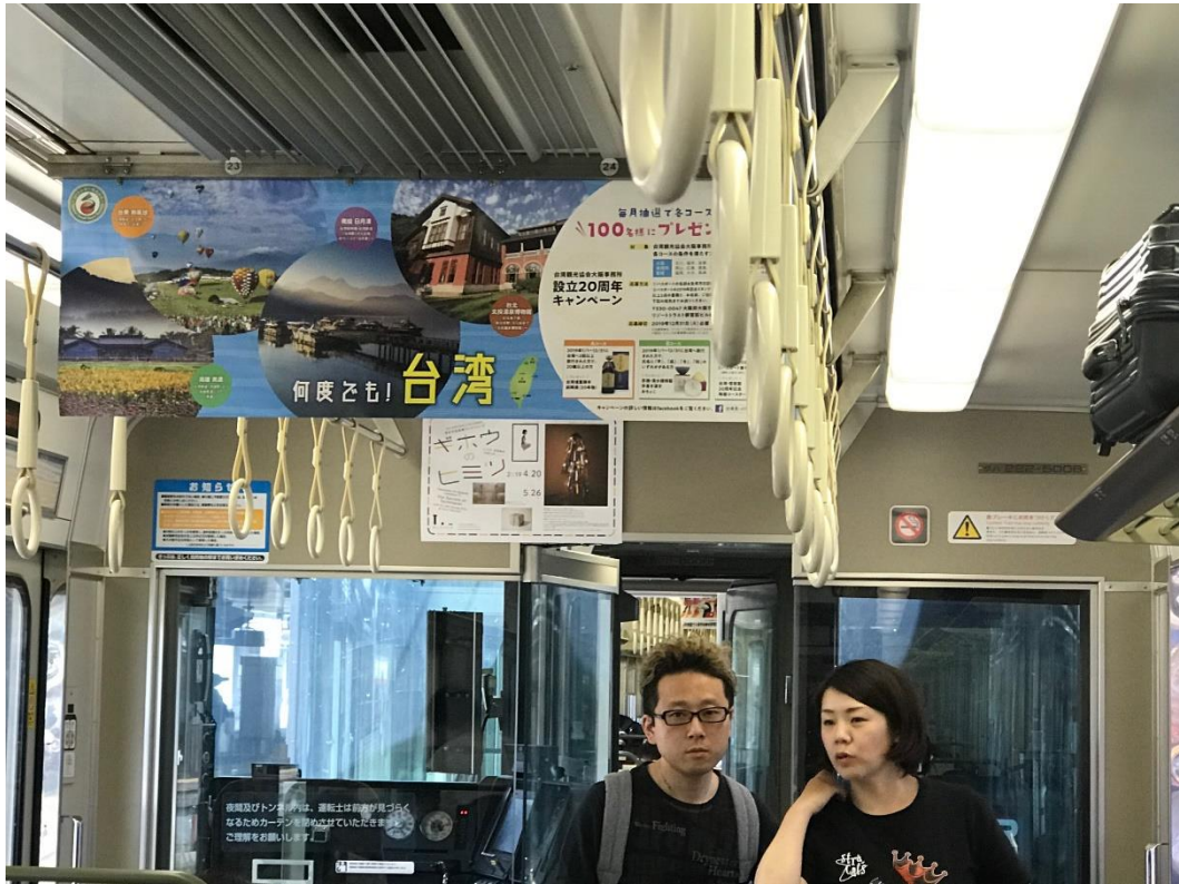
大阪辦事處於大眾運輸台灣觀光行銷廣告