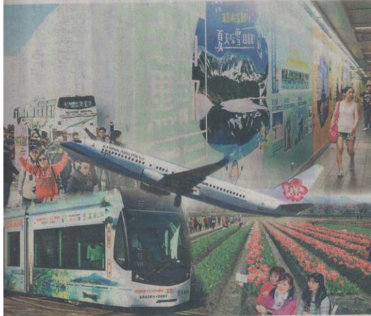
台北便の機体を中心に、台北市の富山県PR広告(右上)から時計回りに朝日町の「春の四重奏」、23日から運航が始まった富山市内電車のラッピング車両、雪の大谷のコラージュ