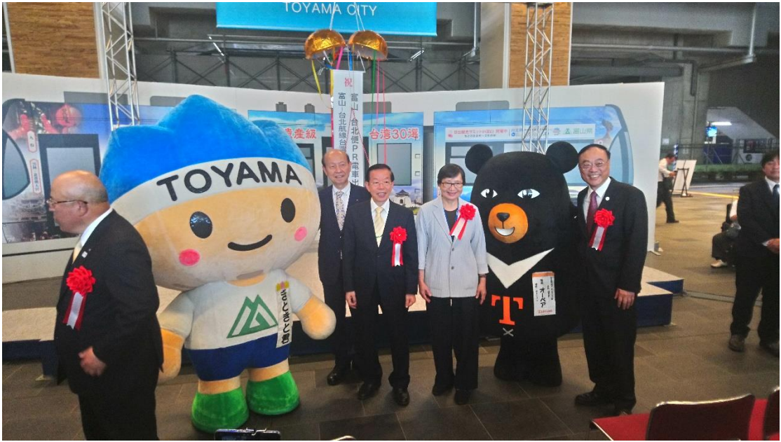
富山台灣彩繪電車啟動儀式