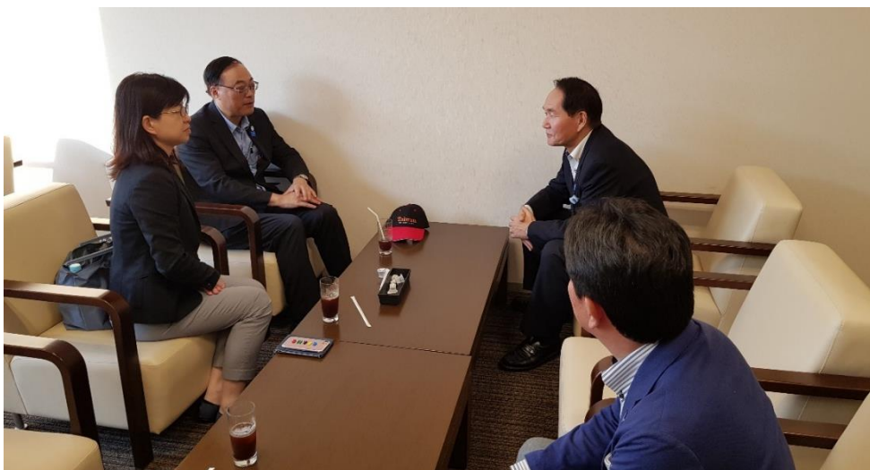
周局長與濱田知事針對多項課題進行意見交換

濱田知事則回應，臺灣是香川縣最重要之客源市場，且目前中華航空高松往台北定期航線也自4月起，從每週6個航班，增加為7個航班，高松機場更得以在今年與桃園機場簽署友好交流協定，都足見臺灣-香川交流多年及情意厚重，後續縣廳亦將全力積極支持協助臺灣觀光宣傳推廣，亦期盼該定期航線能持續維持熱絡，兩地民眾交流越趨頻繁。