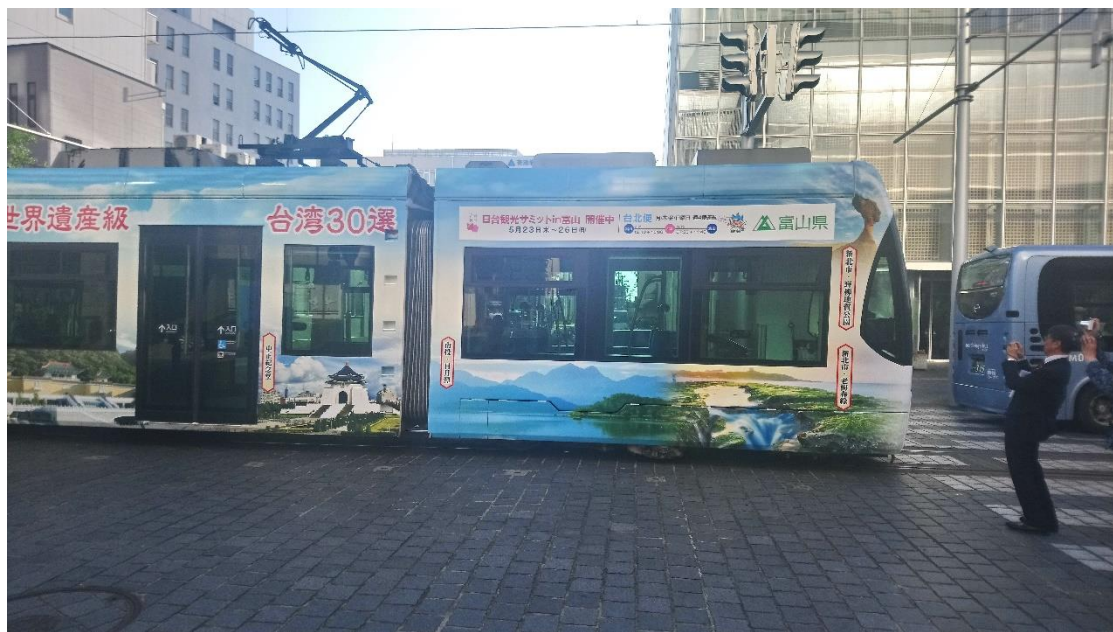
台灣彩繪電車行駛至 9 月 30 日