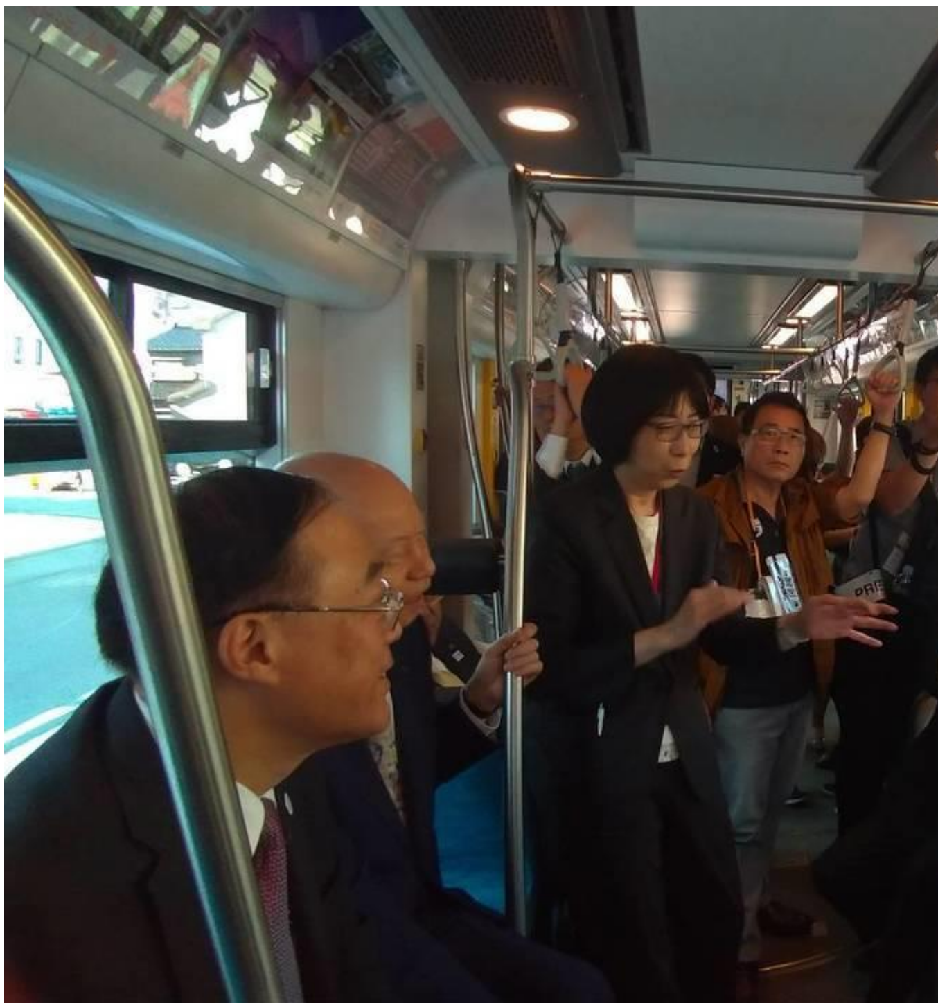
觀光局長周永暉(左二)、富山縣知事石井隆一(左一)、觀光協會會長葉菊蘭(右二)、駐日代表謝長廷(右一)一同搭乘彩繪列車，電車內部則裝飾了今年剛選出的台灣小鎮景點。