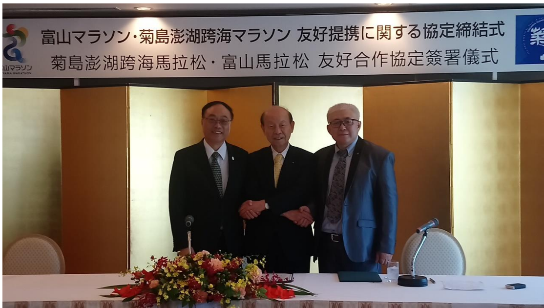
菊島跨海馬拉松與日本富山馬拉松締盟

二屆已獲跑友極佳口碑，此次能再與日本富山馬拉松締結為姊妹賽事，更能將菊島澎湖跨海馬拉松推向國際。