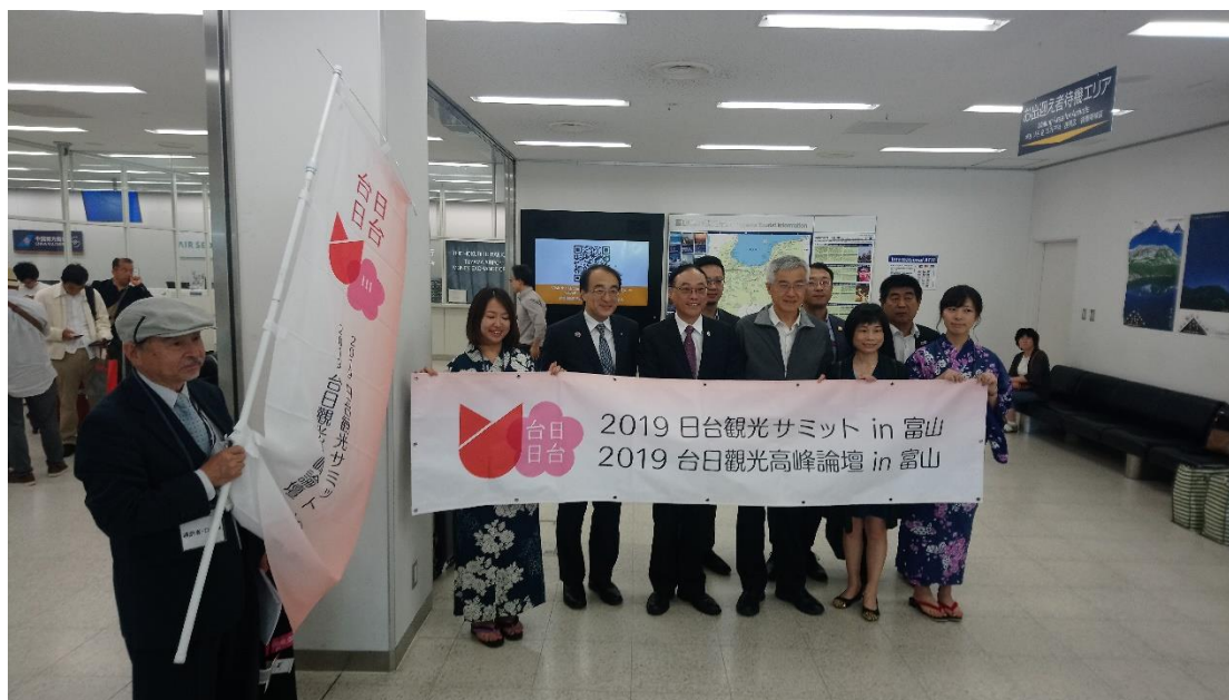
富山縣各單位熱烈歡迎