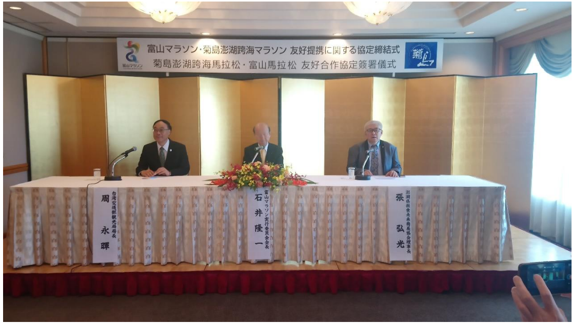
菊島跨海馬拉松與富山馬拉松締結姊妹賽事