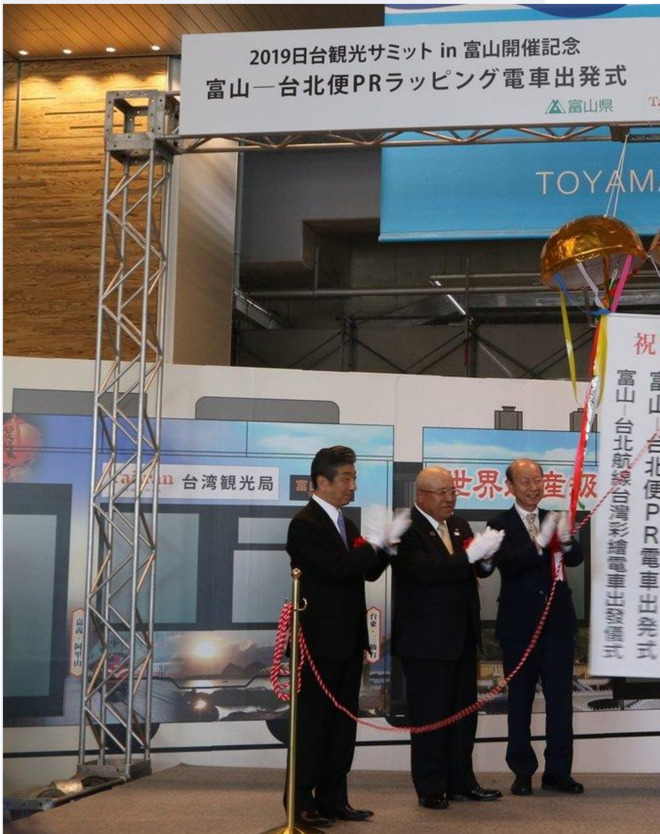
配合台日觀光峰會今年在富山舉行，在富山站推出了台灣彩繪列車，23日舉行