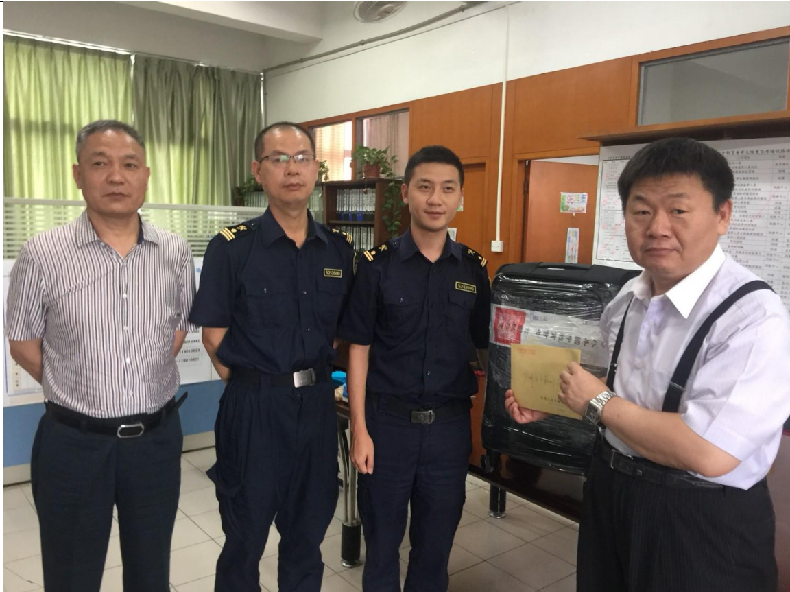
5/19 考試完畢後完成答案卡封箱作業