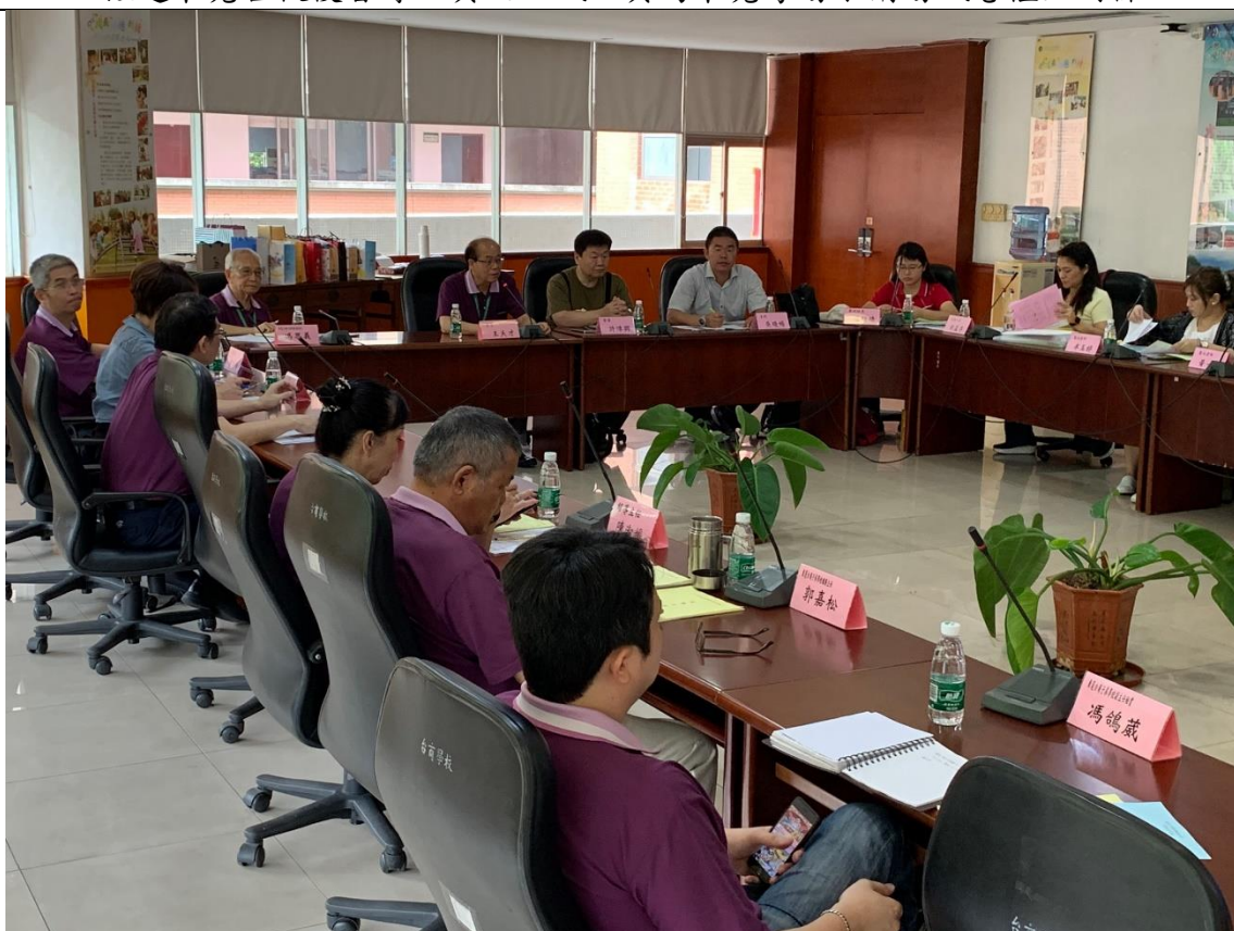
5/17 上午進行東莞考場試務工作協調會