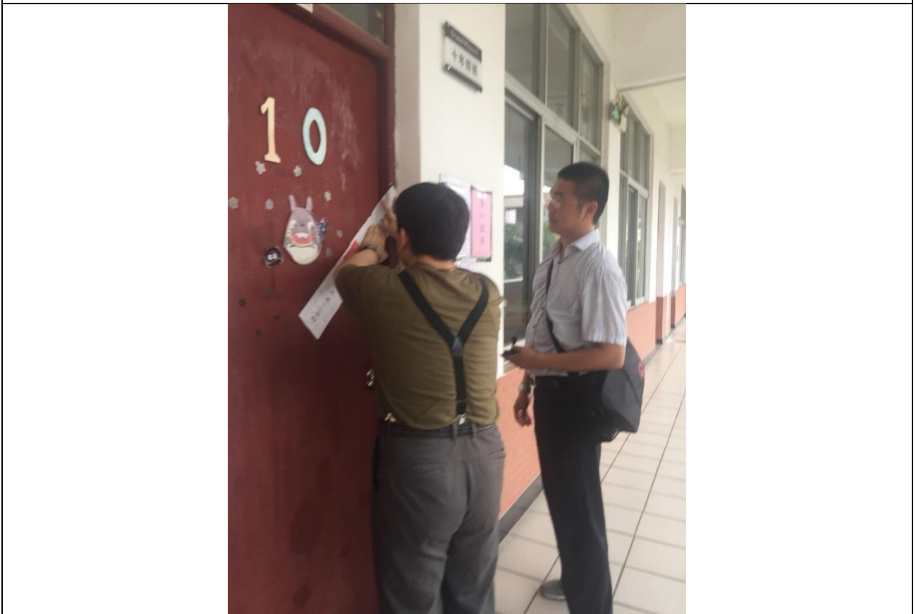
東莞考場完成試場檢查後張貼封條