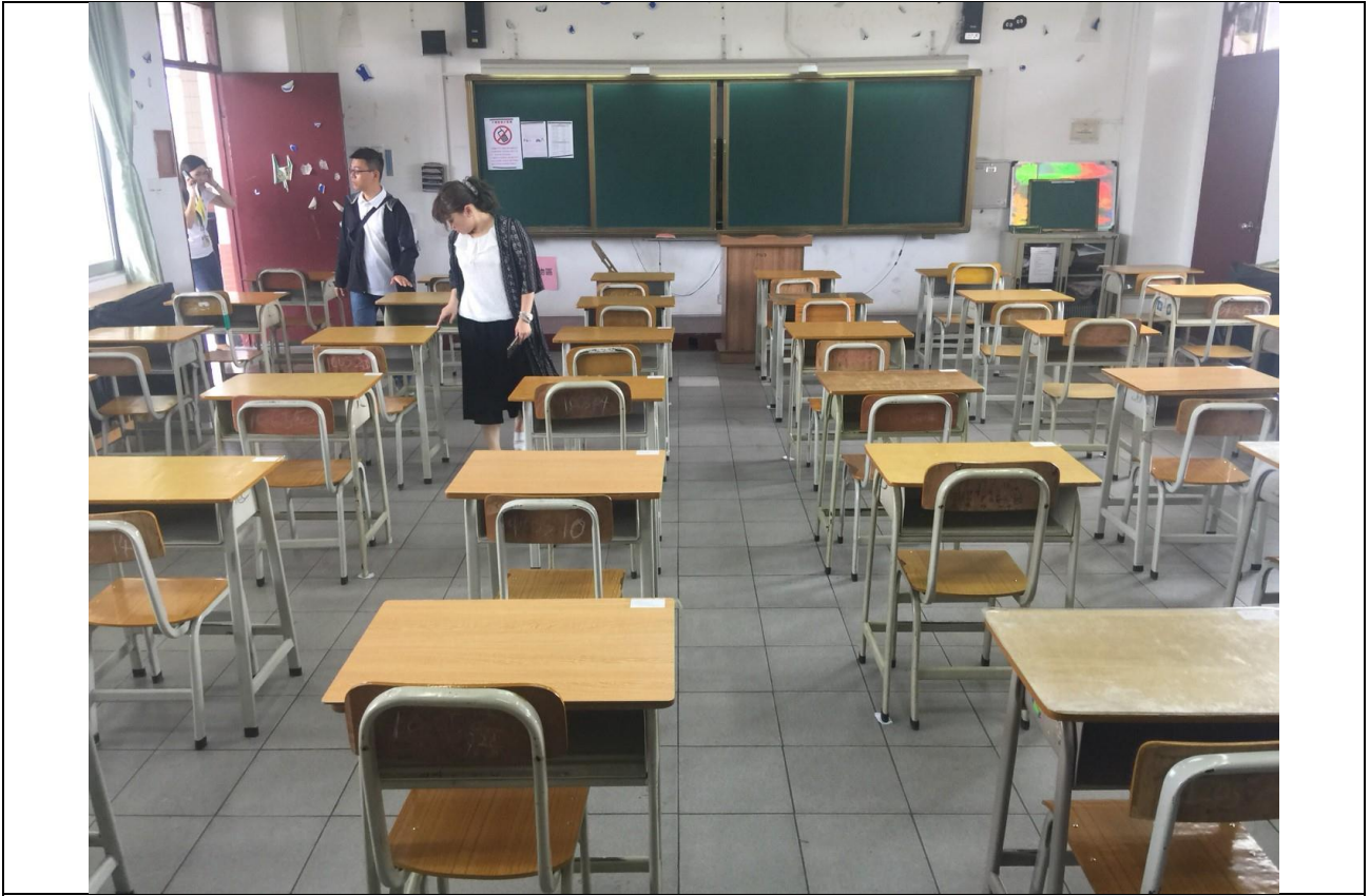
結束試務會後進行試場檢查