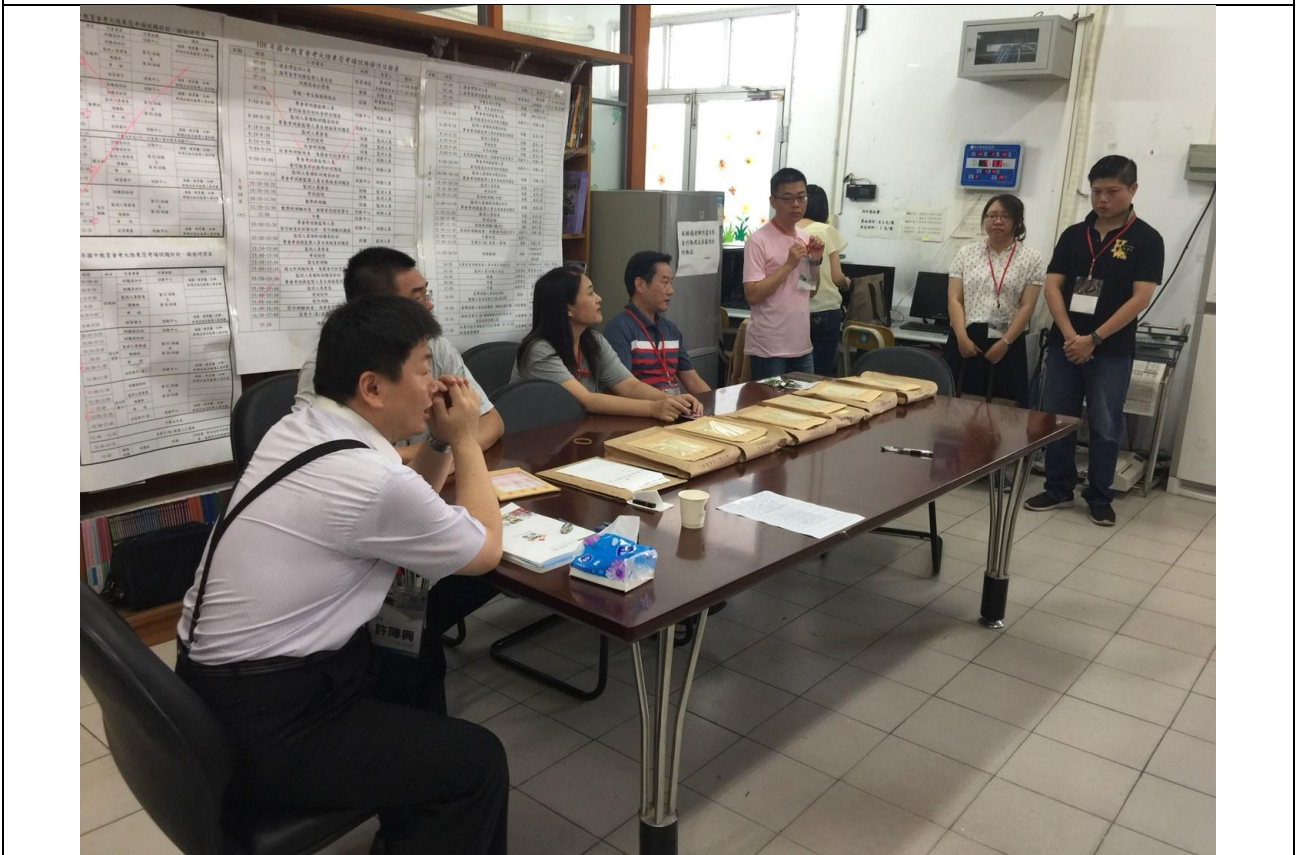
每節考前試務工作說明與提醒