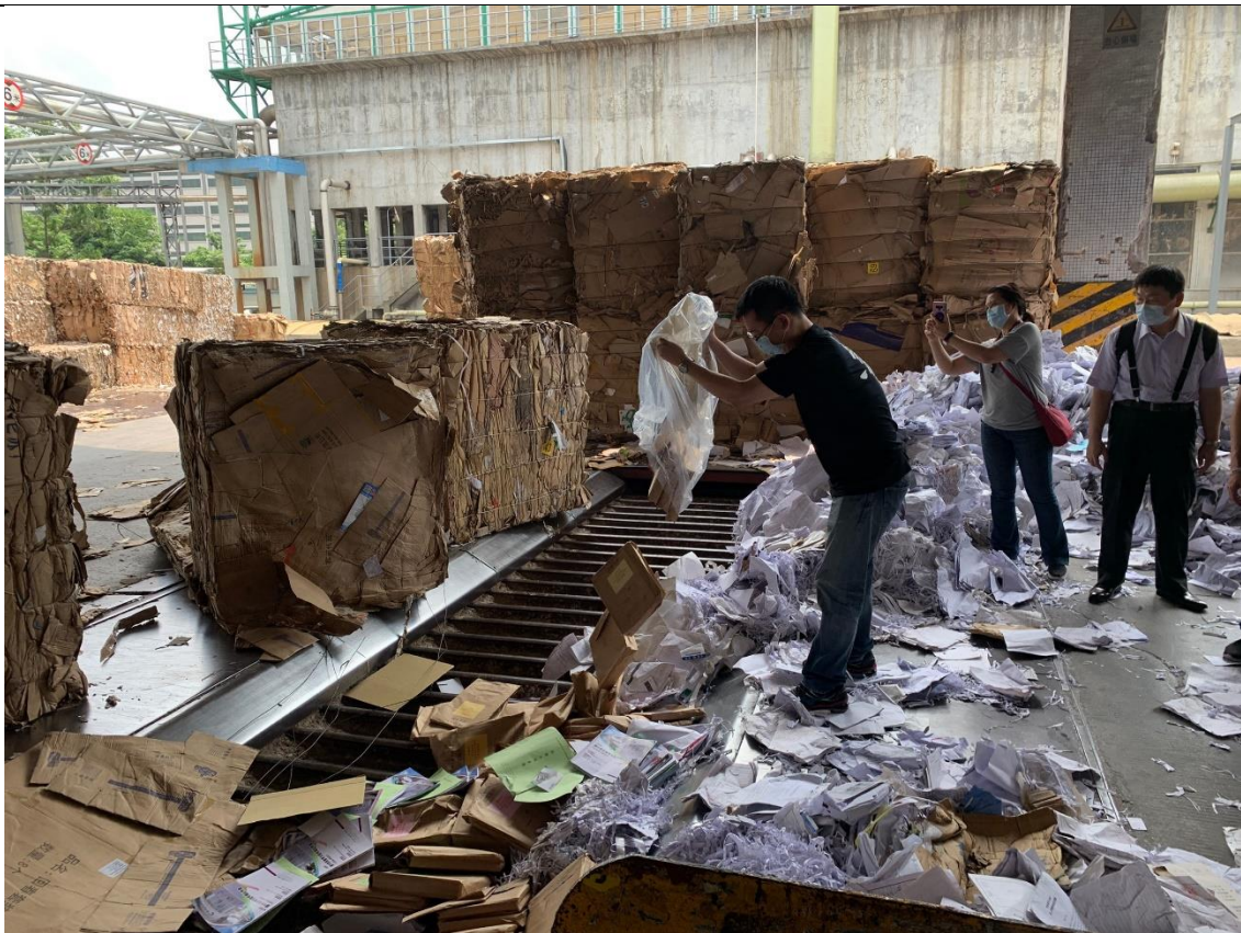
考試完成後至附近紙廠進行試題本銷毀作業