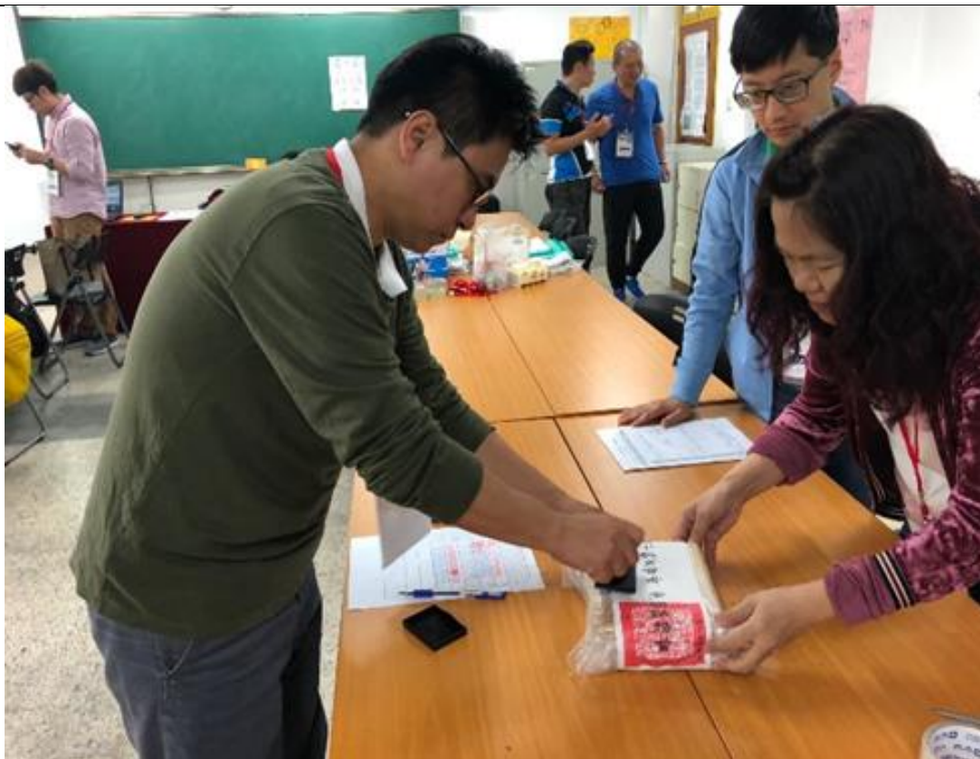
5/18 每一科試畢並點收完成後，答案卡（卷）由主試進行彌封，再裝入答案卡行李箱中