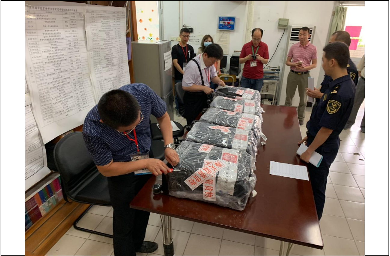
5/18 考試前東莞考場試務試題本箱開箱檢查