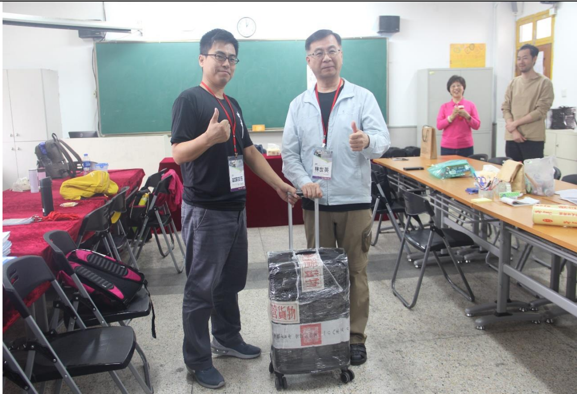
5/19 全數考科答案卡（卷）點收無誤後，答案卡行李箱彌封完成並上 PE 膠，俾利運送回臺灣（至閱卷讀卡闈場—國家教育研究院三峽院區）