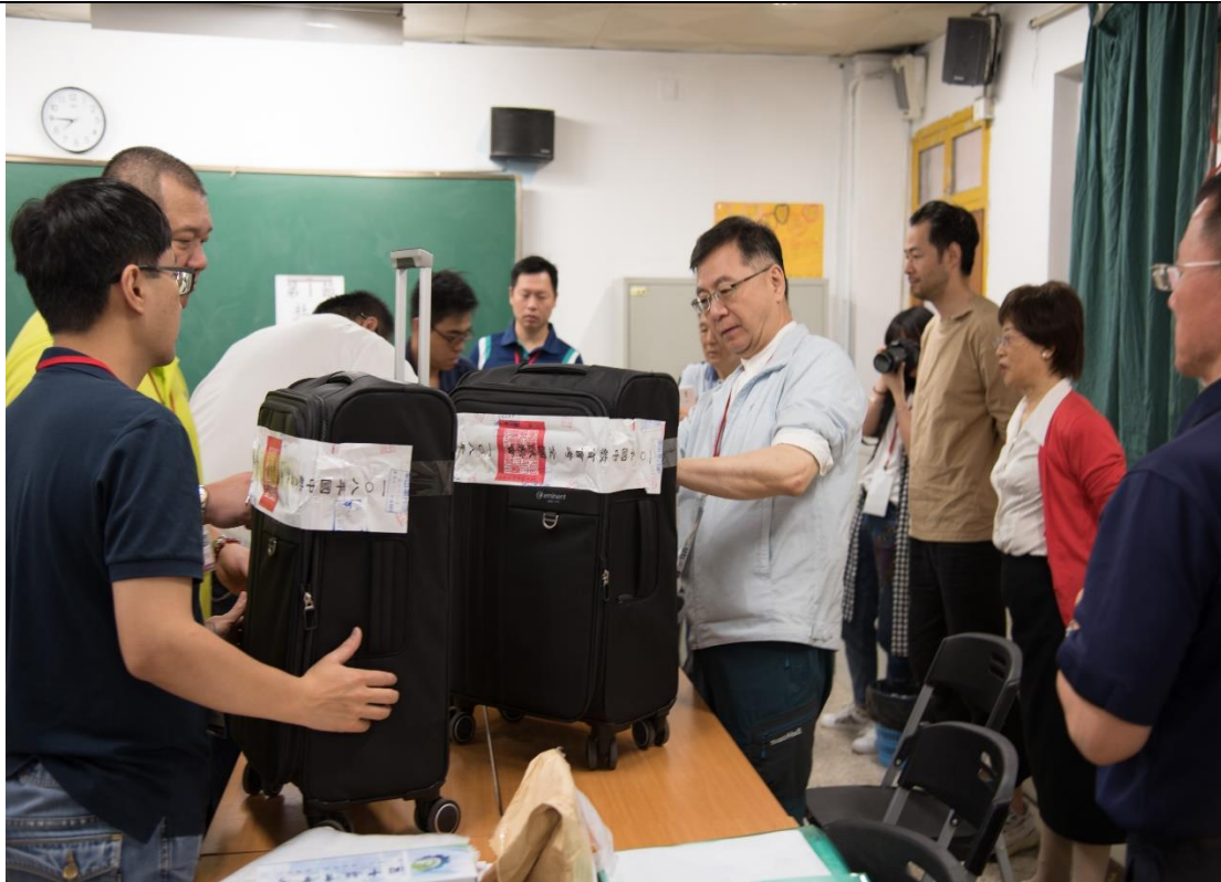
5/18 考試前華東考場試務試題本箱開箱檢查