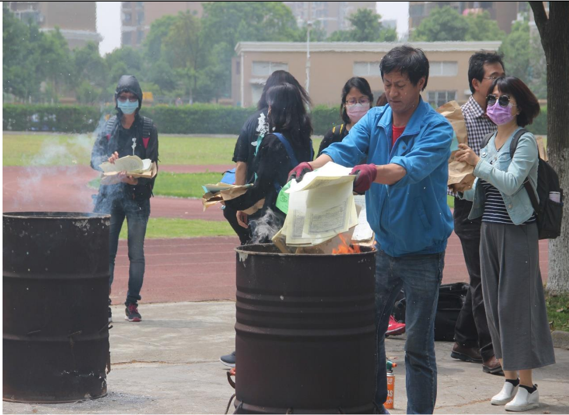
5/19 下午 1 點 30 分，由全體試務人員至台校校園一隅進行試題本焚燒工作