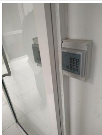
華東考場 24 小時門禁管制