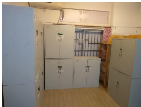
試卷箱小閱場內部場勘