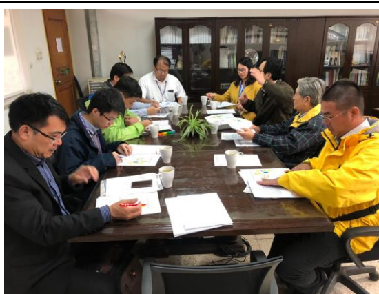
場勘人員與華東協調會議 1