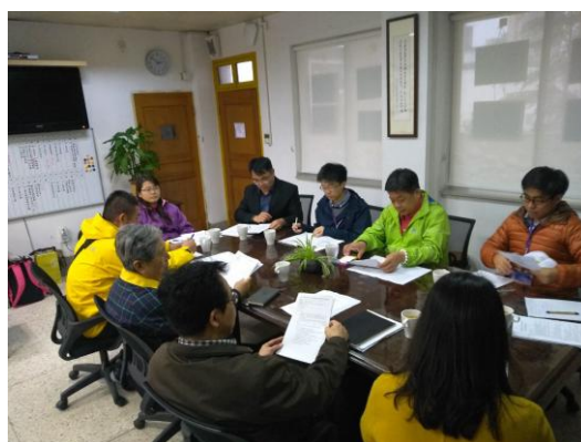
場勘人員與華東協調會議 2