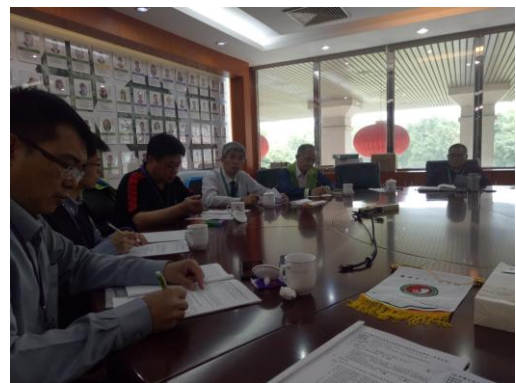
召開東莞考場試務協調會議