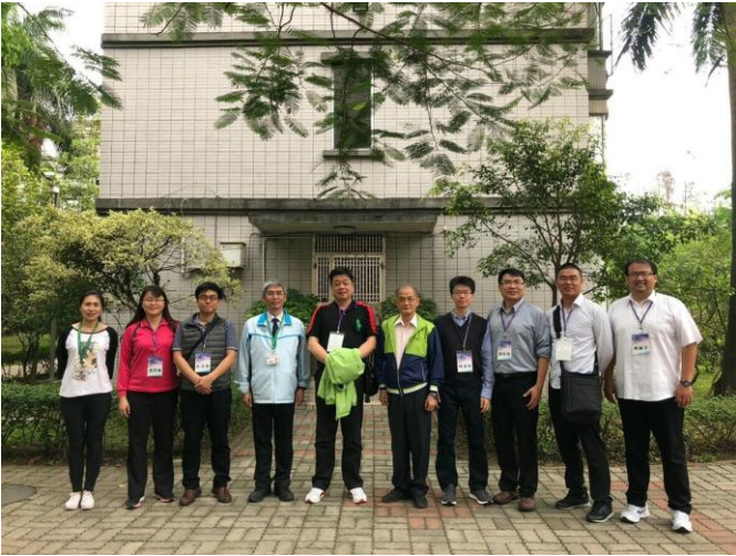
大陸考場勘察人員抵達東莞臺校小閘場