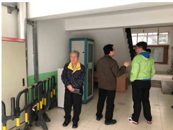
確認小閱場監視機器