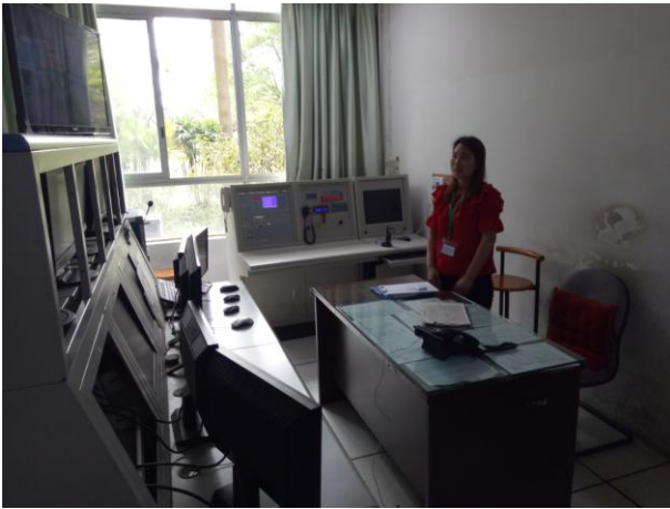
24 小時監控中心場勘