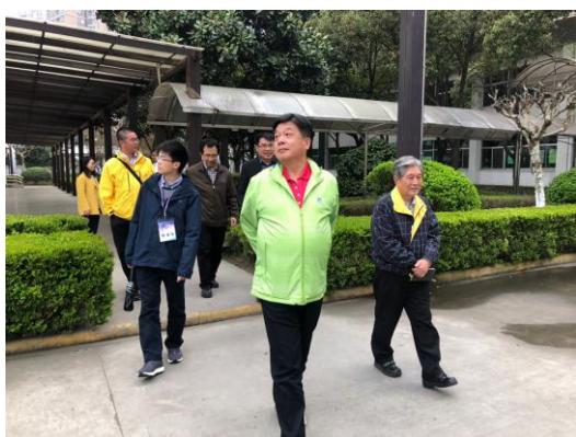
場勘人員於華東臺校巡視考場環境