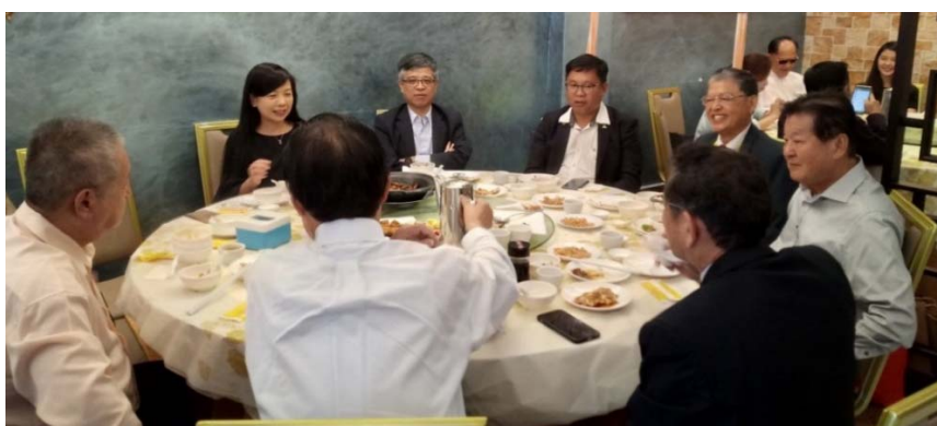
劉孟奇政務次長（上排左二）與出席餐會貴賓交流情形

本次餐敘與會者包括林朝聘會長、留臺聯總洪進興署理會長、梁德志州議員、巴生教育界人士拿督王明雄先生等。