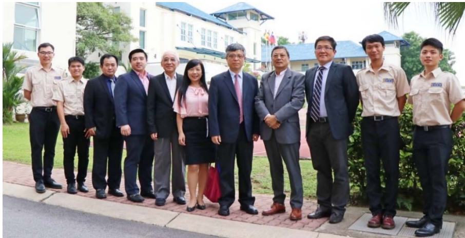
劉孟奇政務次長（右五）與臺商及替代役於校園合影