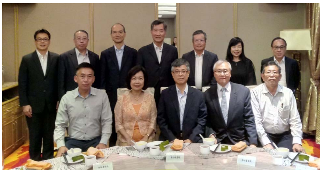
劉孟奇政務次長（前排中）與洪慧珠大使（前排左二）及出席餐會代表合影留念

劉政務次長一行離開機場後赴下榻旅館（Impiana KLCC Hotel）稍事休息。晚間在教育組張俊均組長及白博文秘書陪同下出席駐馬來西亞代表處洪慧珠大使歡迎晚宴。出席者除代表處同仁外，亦包括留臺聯總洪進興署理會長及彭慶和秘書長。劉政務次長介紹我國技職科大特色學校的科系及強項，並分析說明大學經營發展與所處地理位置、交通便利性等因素，盼本次教育展期間馬國學生能充分認識我國優質大學系所。