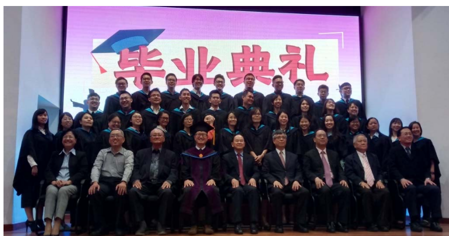
劉孟奇政務次長（坐排右三）及出席貴賓與全體畢業生合影