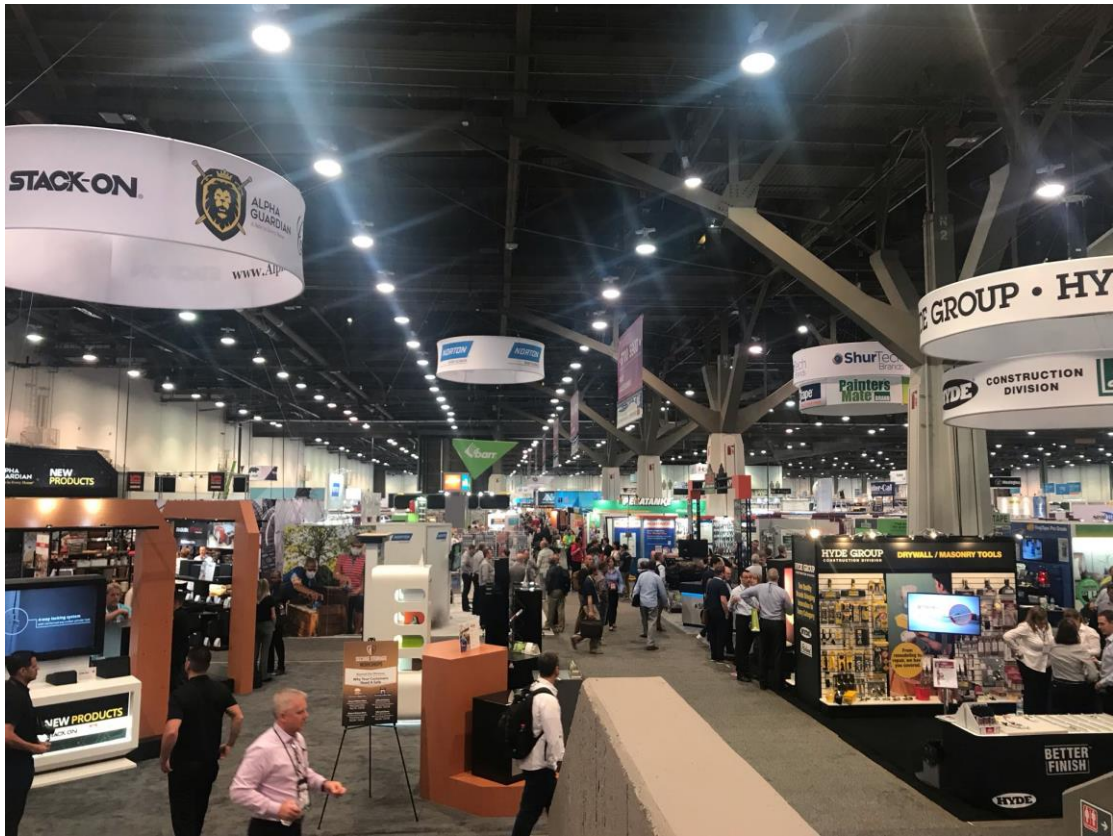
圖三:全美五金展-美國品牌商展區