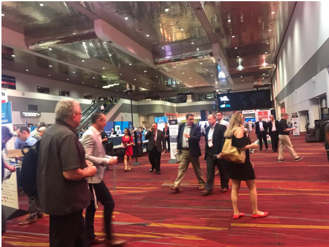
圖一：全美五金展入口-1