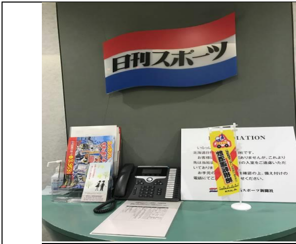
拜會日本媒體「日刊 Sports」