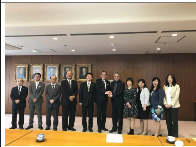
拜會札幌市政府由石川副市長代表接見 (右6)