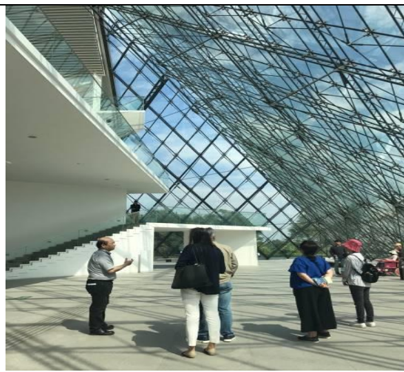
考察莫埃來沼公園