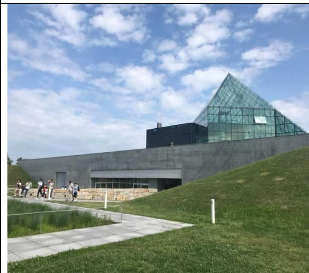
考察莫埃來沼公園