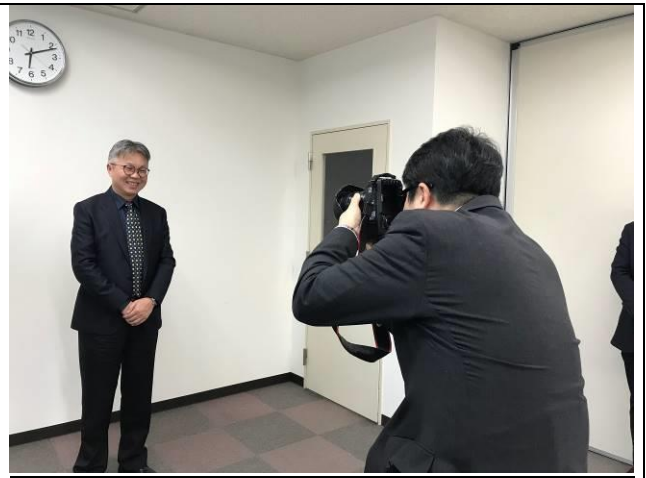
接受日本媒體「日刊 Sports」採訪