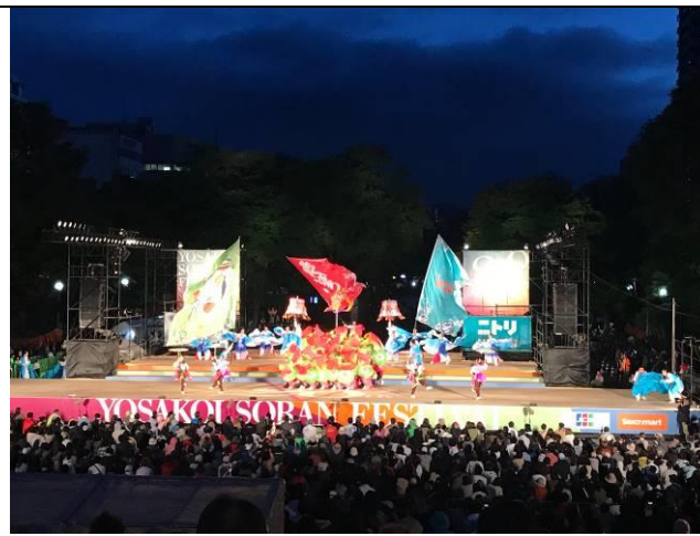
台灣代表表演團體舞台演出