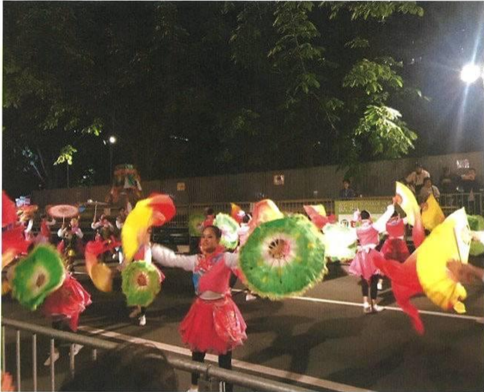
舞團在札幌的街道上踩街

這次的演出，台灣表演團隊在大會舞台定點表演及於札幌市區人潮聚集處如大通公園、JR札幌車站南口等地遊行踩街外，同時也前往當地老人院進行慈善義演人文關懷。