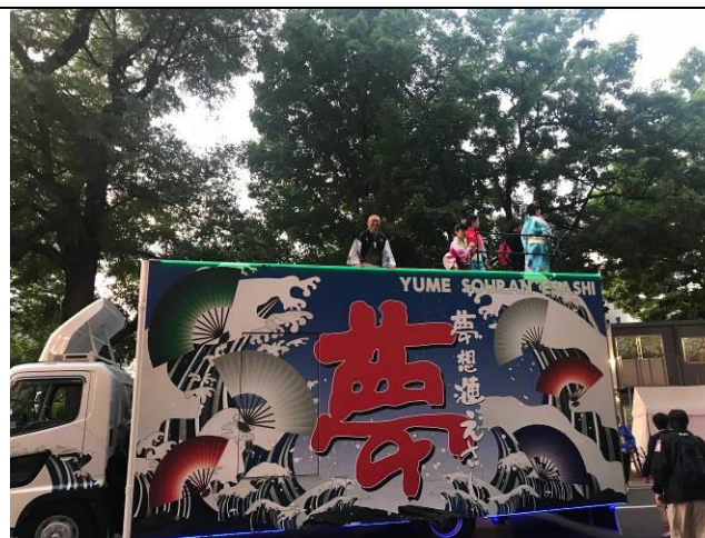
獲得第 28 屆 YOSAKOI SORAN 祭典大賞 「夢想漣えさし」的地方車