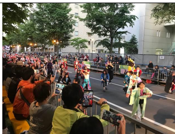
一般民眾不分男女老少參加 YOSAKOI SORAN 祭典踩街