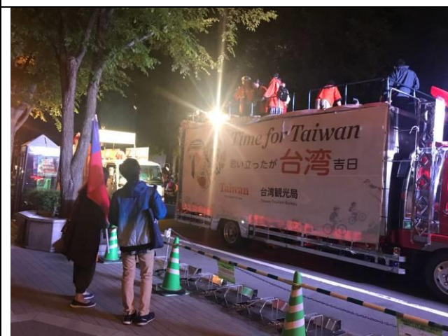
沿路有日本民眾拿國旗為台灣代表表演團體打氣