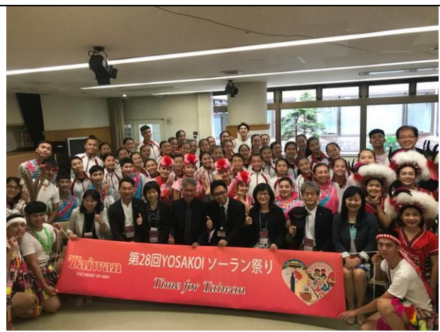
台灣代表團於長生園慈善義演紀念合影