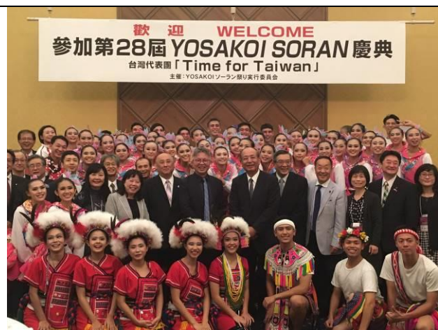
參加北海道 YOSAKOI SORAN 組織委員會 主辦的台灣代表團歡迎晚宴