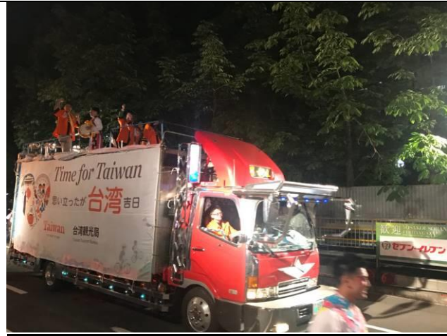
6/8 台灣代表表演團體的地方車