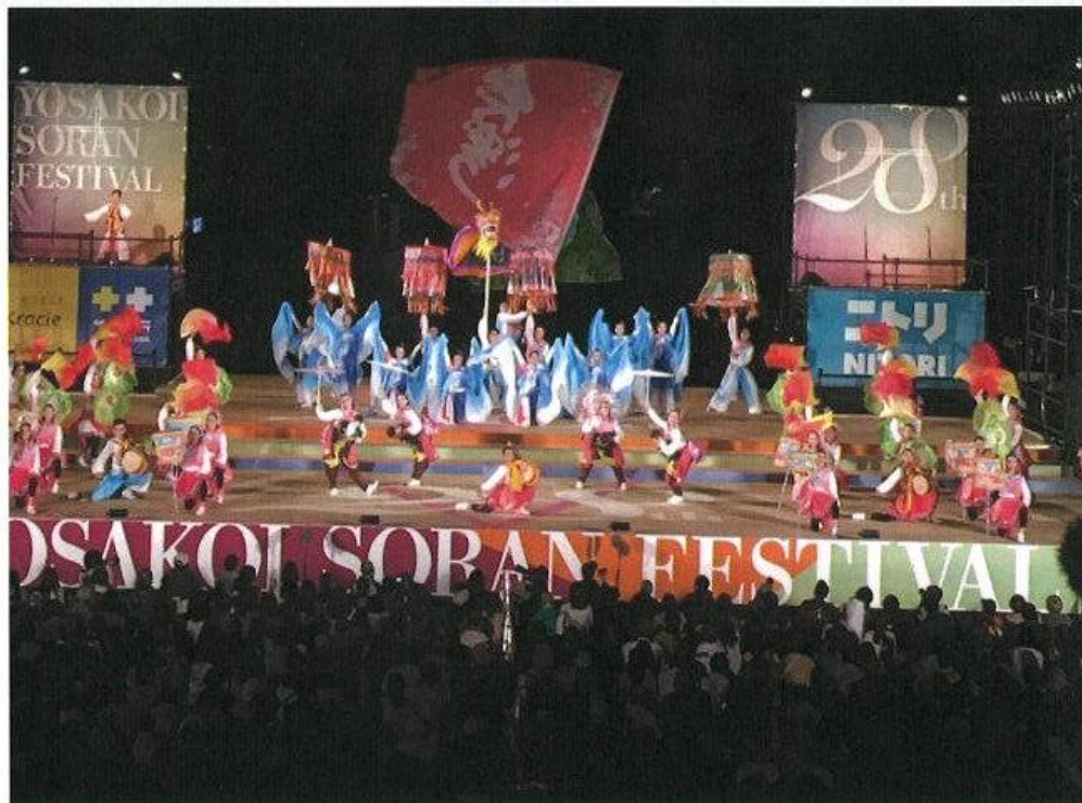
台南應用科技大學舞蹈系舞團「Time for Taiwan」服裝道具充分展現出台灣特色

觀光局為了參加日本地方知名祭典宣傳台灣觀光，以及推動台日青年交流的角度切入，因此鼓勵台灣優秀表演團體組成「Time for Taiwan」隊伍，共同赴日參加擁有二十八年歷史之北海道夏季重要大型觀光活動—「YOSAKOI ソーラン祭り」，結合傳統宗教活動中的「娘傘」、「舞龍」、「跳鼓」及「老背少」等，以活力、熱情舞出台灣傳統藝陣之美，在北海道街頭重現臺灣小鎮文化特色與魅力。