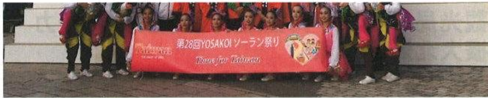
「Time for Taiwan」隊伍

觀光局為了參加日本地方知名祭典宣傳台灣觀光，以及推動台日青年交流的角度切入，因此鼓勵台灣優秀表演團體組成「Time for Taiwan」隊伍，共同赴日參加擁有二十八年歷史之北海道夏季重要大型觀光活動—「YOSAKOI ソーラン祭り」，結合傳統宗教活動中的「娘傘」、「舞龍」、「跳鼓」及「老背少」等，以活力、熱情舞出台灣傳統藝陣之美，在北海道街頭重現臺灣小鎮文化特色與魅力。