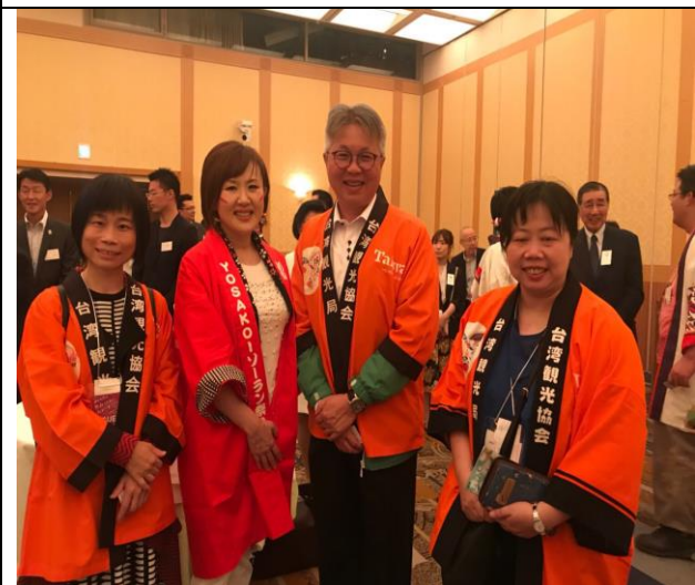
參加北海道 YOSAKOI SORAN 組織委員會主 辦的台灣代表團歡迎晚宴