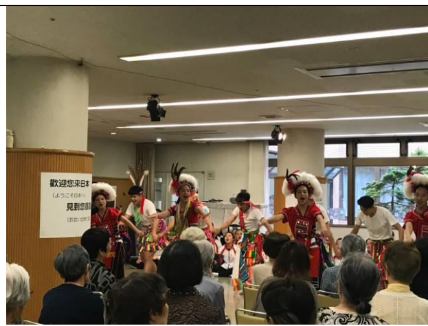
台南應用科技大學舞蹈系學生慈善義演