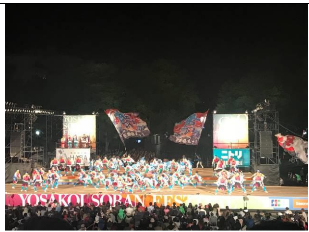
獲得第 28 屆 YOSAKOI SORAN 祭典大賞 「夢想漣えさし」的舞台演出