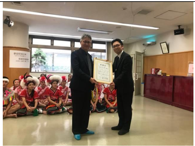
周副局長代表接受長生園授予感謝狀