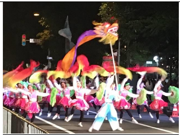
台灣代表表演團體踩街演出