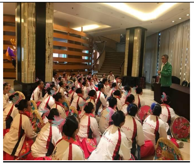
周副局長勉勵台灣代表表演團體學生