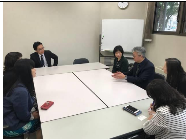
拜會札幌市養老院「長生園」