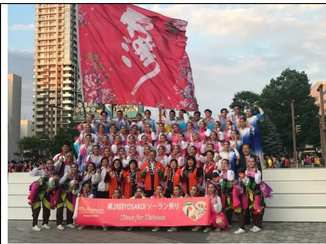
與台灣代表表演團體師生合影