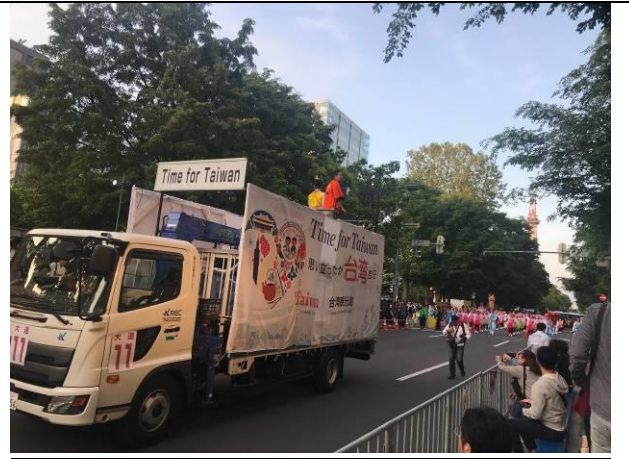
6/9 台灣代表表演團體的地方車