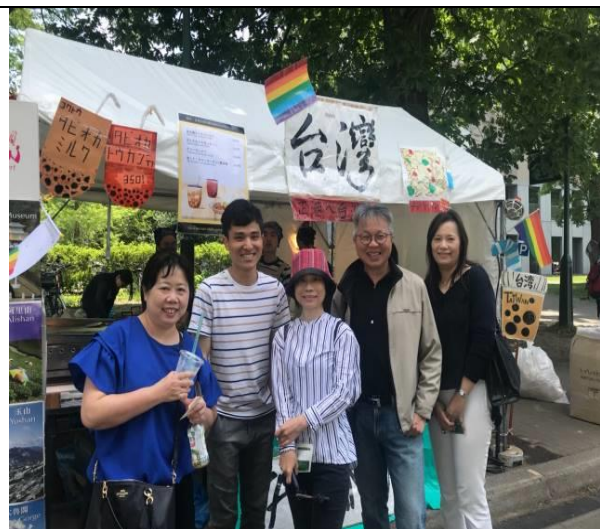
考察北海道大學並與辦理台灣小吃和珍奶攤位推廣台灣美食的台灣留學生(㊟2)合影