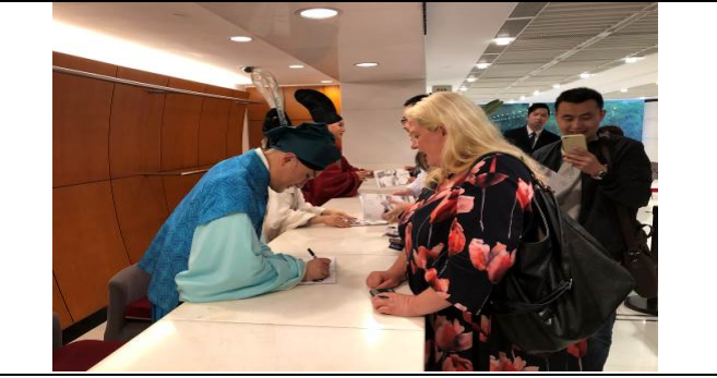
4/21 演後簽名會 4