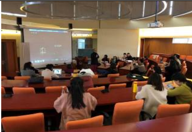
3/6 上海同濟大學講座紀錄 2