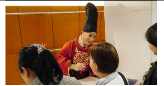
4/21 演後簽名會 2