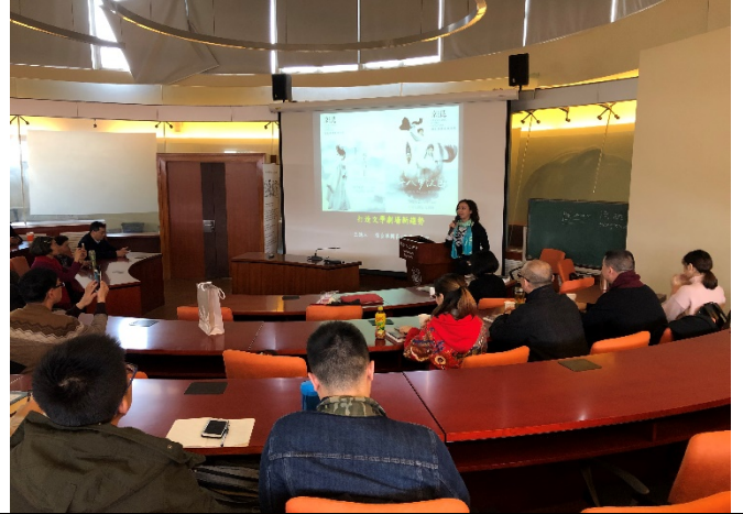
3/6 上海同濟大學講座紀錄 1