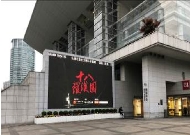
上海大劇院外圍廣告物 3