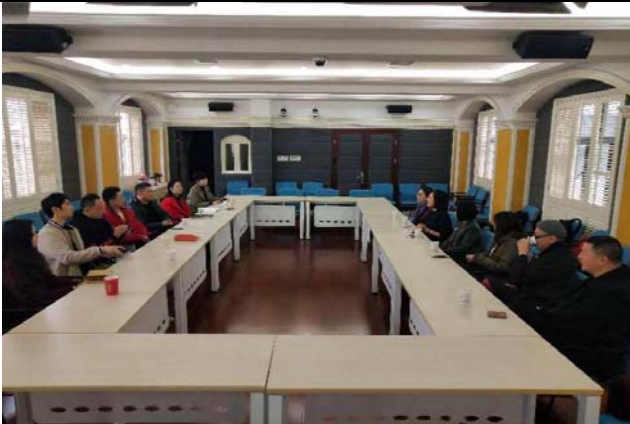
3/8 拜訪上海戲曲學院 1