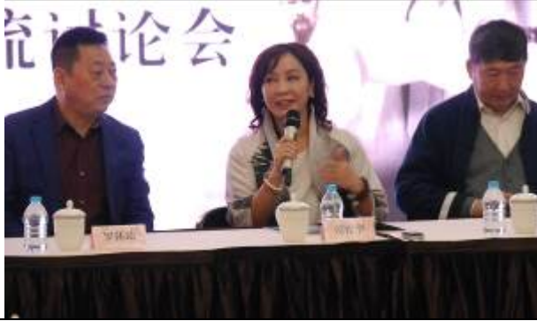
4/22 兩戲劇評會 5