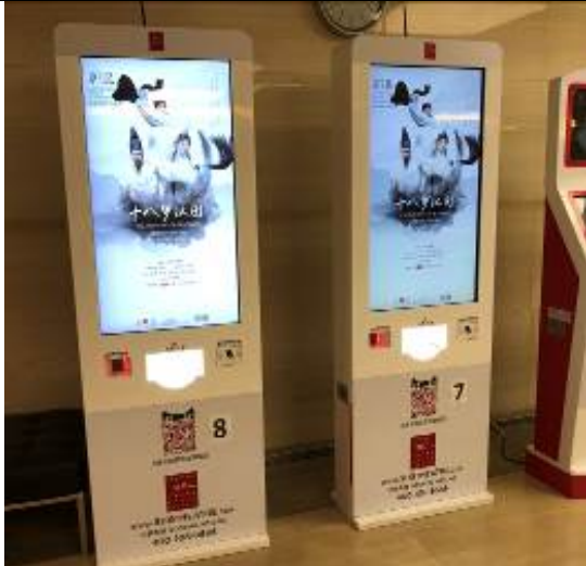
上海大劇院內部廣告物 2