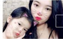
25歲單親媽媽年收1500萬！不靠薪水靠外匯投資