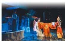
春藝歌仔戲夯 洋粉絲揪看戲