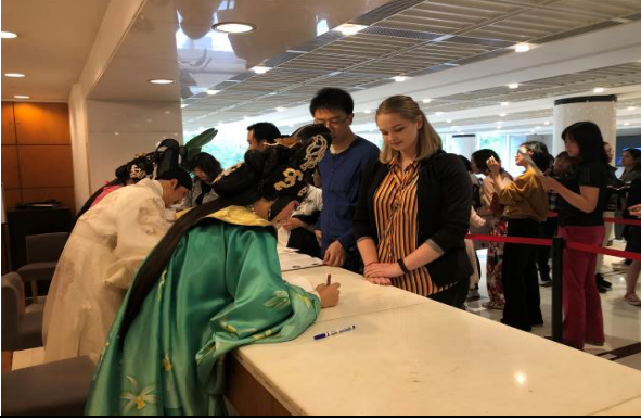
4/20 演後簽名會 1