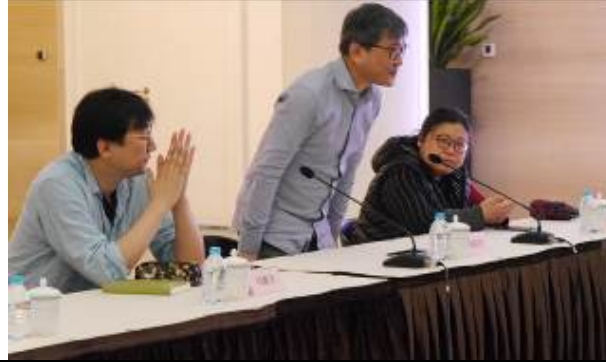
4/22 兩戲劇評會 6