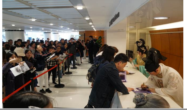
4/20 演後簽名會 2