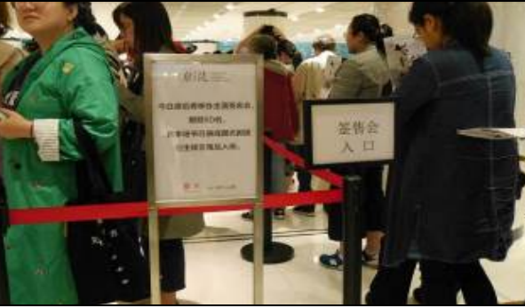
4/21 演後簽名會 3