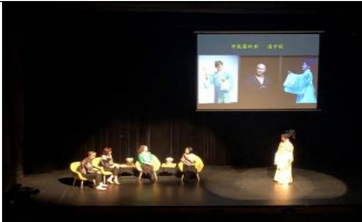
3/7 大師講堂 3