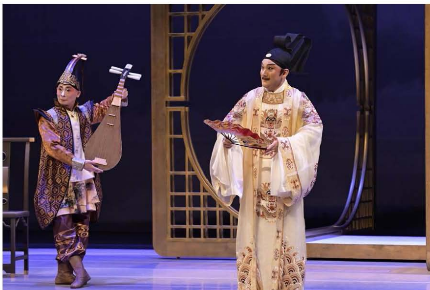
國光劇團結合京劇和崑曲的作品《天上人間 - 李後主》，展現台灣對京崑融合的實驗作法，日前在上海大劇院首演，不少大陸劇場界、梨園界名家與專業人士前來欣賞。