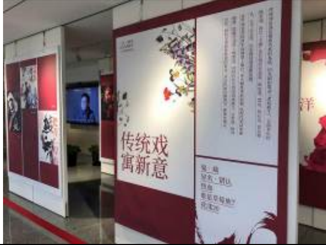
上海大劇院長廊海報展 1