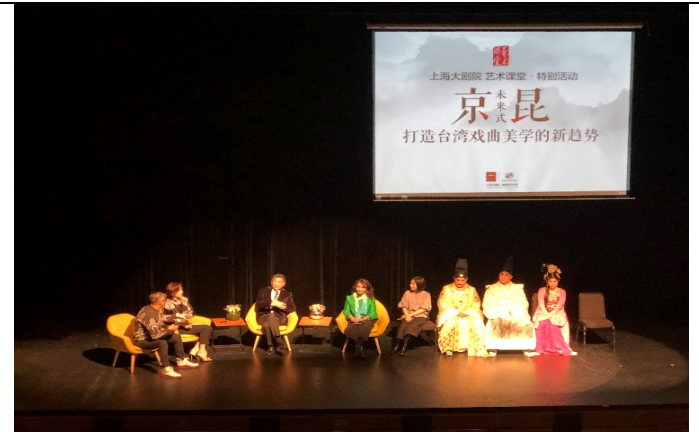
3/7 大師講堂 4