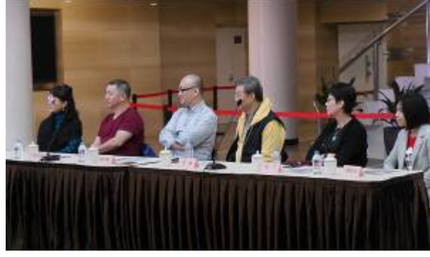
4/22 兩戲劇評會 4