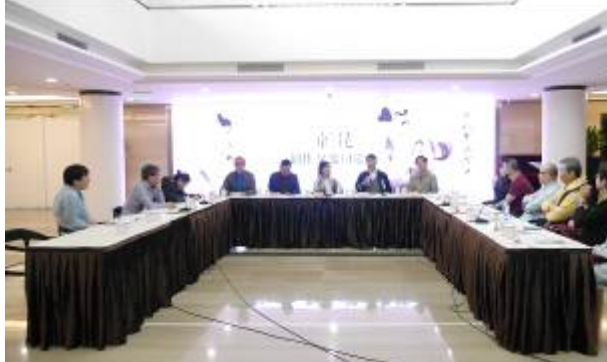
4/22 兩戲劇評會 3