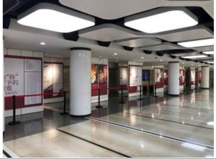
上海大劇院長廊海報展 4