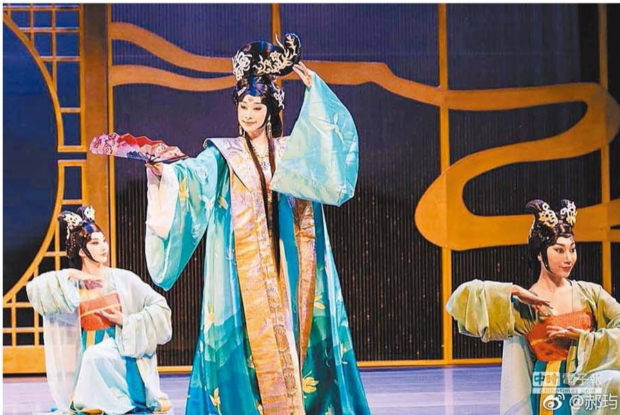
《天上人間李後主》演出畫面。