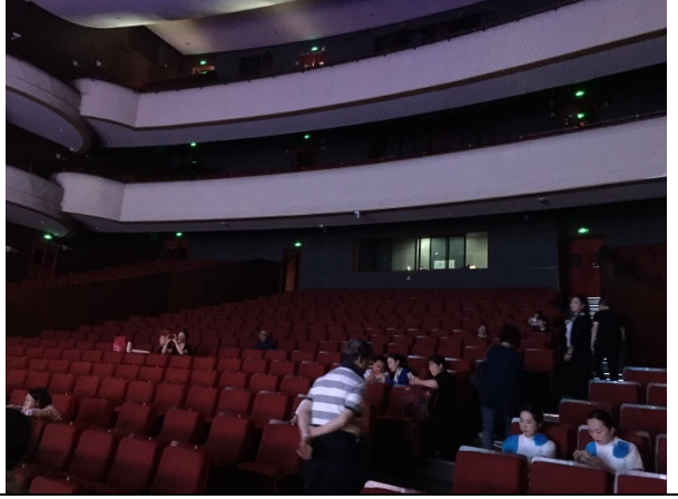
東陽婺劇院劇場觀眾席 1