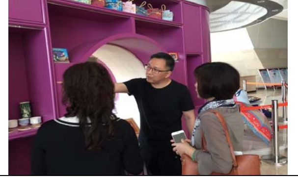
中國婺劇院劇場前廳 3-文創品展示