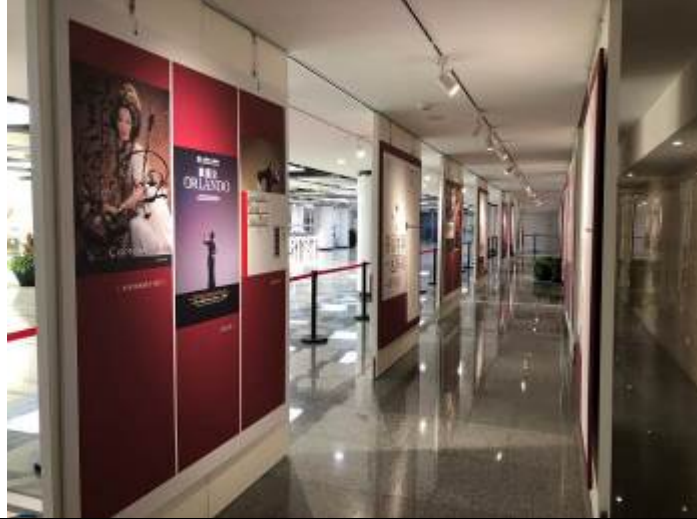
上海大劇院長廊海報展 3