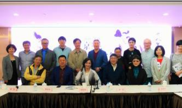
4/22 兩戲劇評會 1