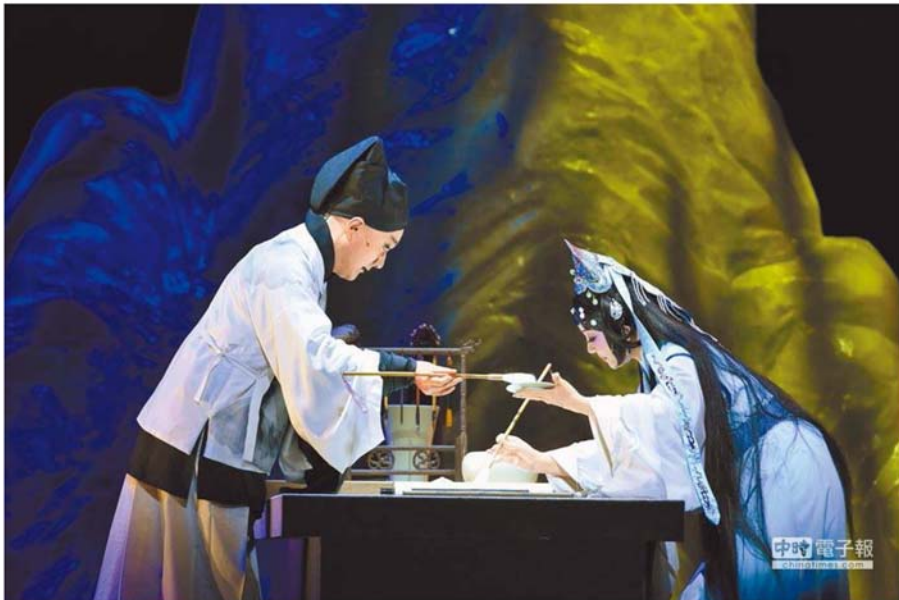
國光劇團曾獲台新藝術獎的新編京劇《十八羅漢圖》。