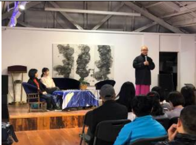
3/6 上海國際崑曲聯誼會活動照 1