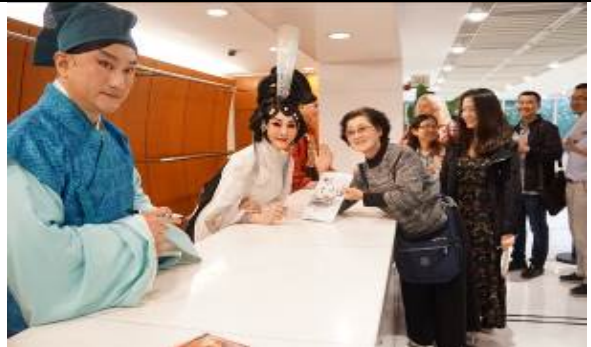
4/21 演後簽名會 1