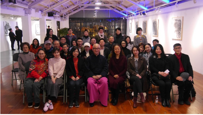
3/6 上海國際崑曲聯誼會活動照 3