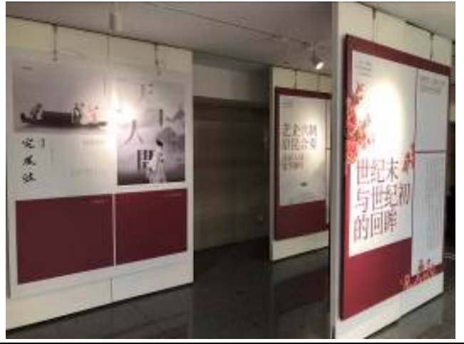
上海大劇院長廊海報展 2