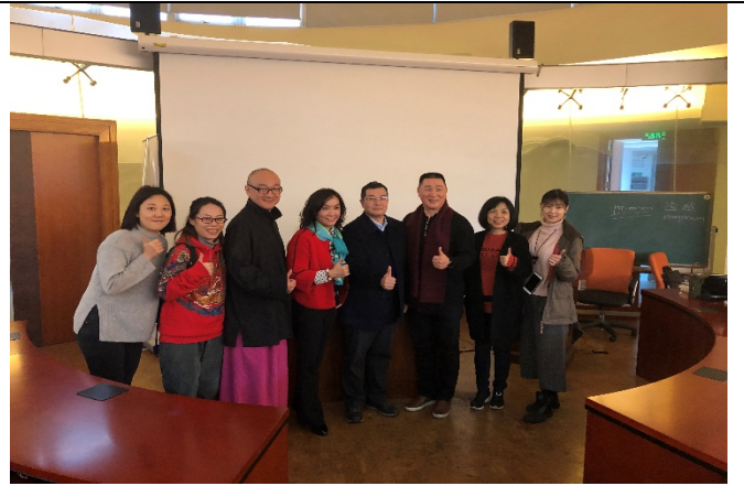
3/6 上海同濟大學講座紀錄 3