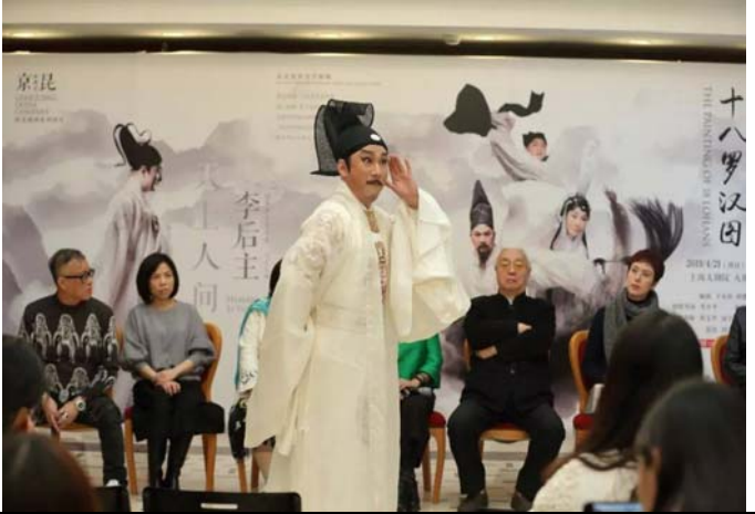
3/7 上海大劇院記者發布會 2