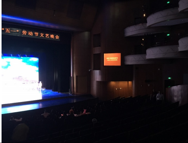
中國婺劇院劇場觀眾席