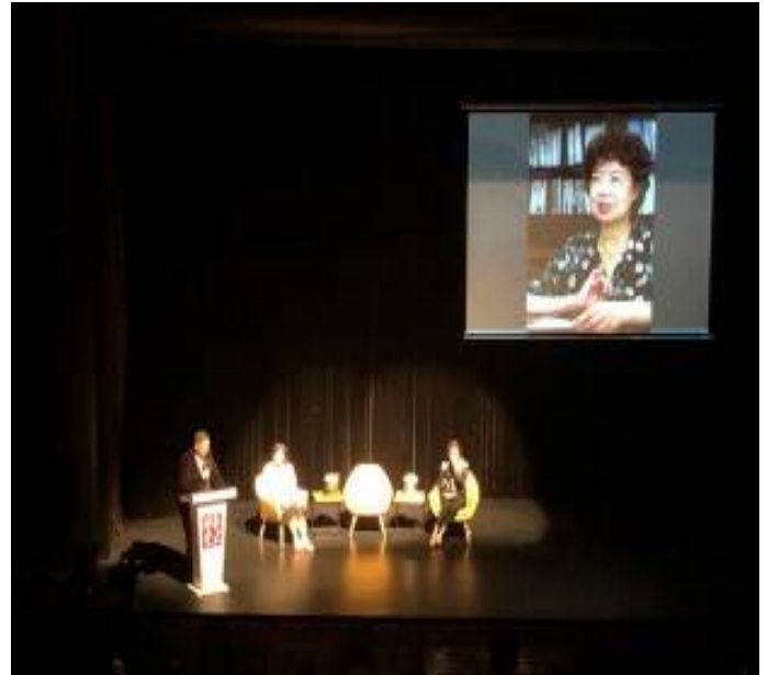
3/7 大師講堂 2