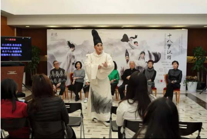
3/7 上海大劇院記者發布會 1