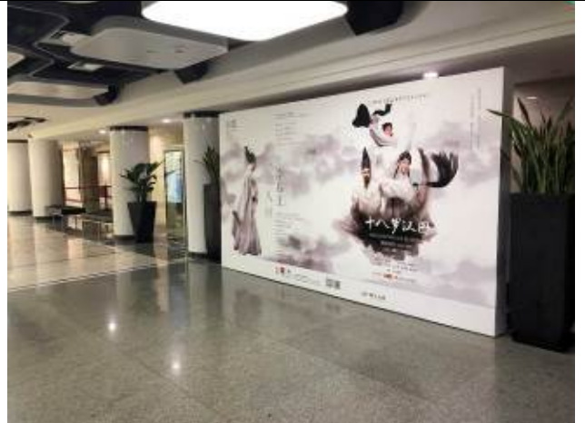
上海大劇院內部廣告物 1