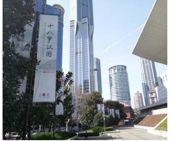
上海大劇院外圍廣告物 2