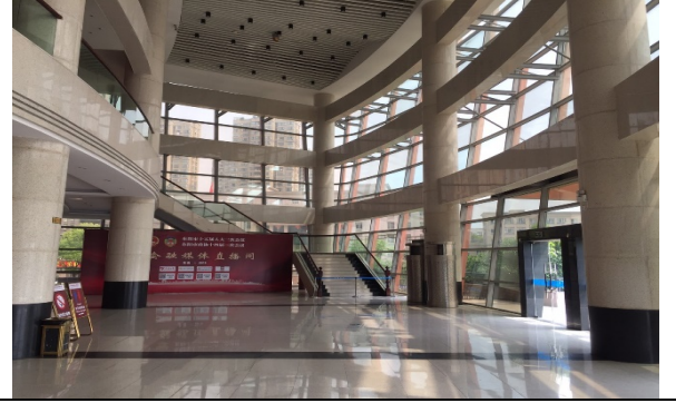
中國婺劇院劇場前廳 1