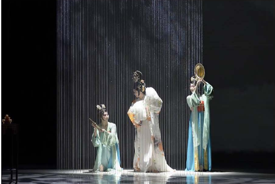
國光劇團今日下午在上海大劇院演出《天上人間-李後主》，人氣爆棚，觀眾自四面八方而來。