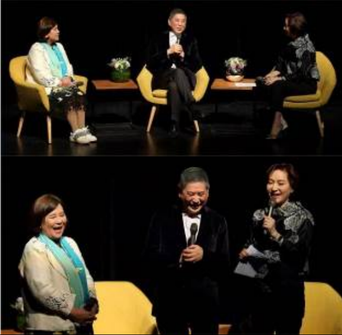
3/7 大師講堂 1