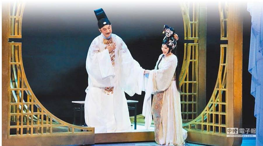
國光劇團新編實驗京劇之作《天上人間李後主》，讓李後主穿越時空，重新檢視自己的人生，發現政治、愛情皆無輸贏，唯有藝術創作是永恆價值。

歷史小說家二月河日前過世，他生前成功塑造包括康熙、雍正、乾隆等幾位帝王形象。近年透過新編戲曲的呈現，幾位中國古代帝王的樣貌也活生生「穿越」來到現代，如國光劇團以《天上人間李後主》，讓南唐的末代皇帝李後主重返人間，今年4月將至上海大劇院演出，向大陸展現台灣戲曲文學的創新面貌。