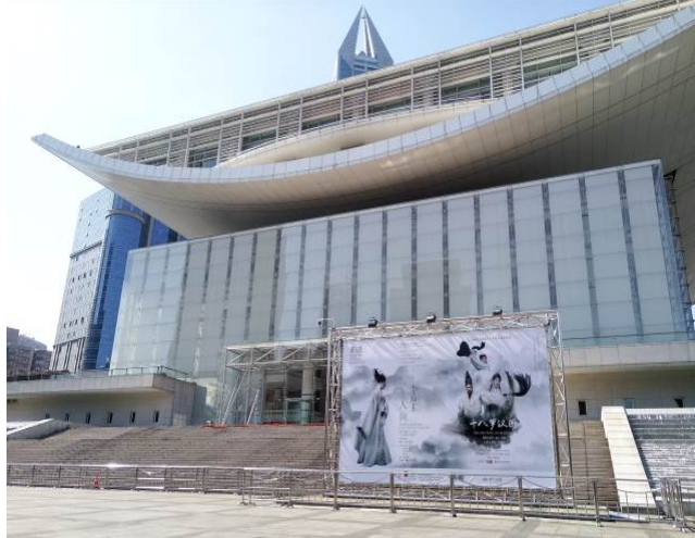
上海大劇院外圍廣告物 1