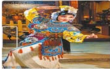
旺視界》千面魏海敏 演活人生百態