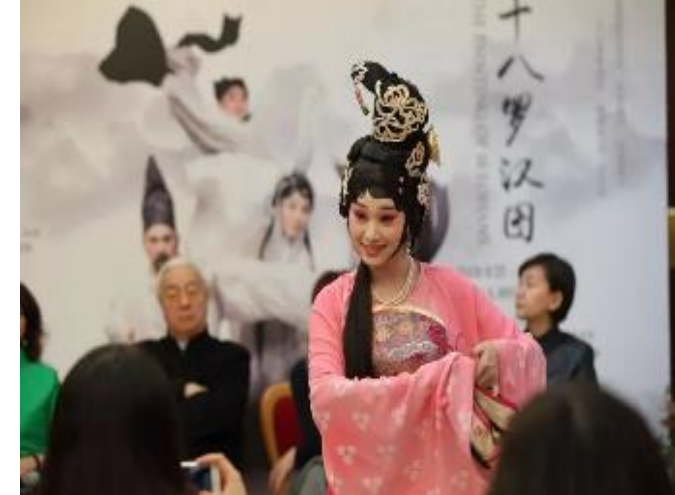
3/7 上海大劇院記者發布會 3