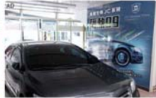
好的隔熱紙讓你擁抱太陽·爛的讓你曬成墨魚香腸！