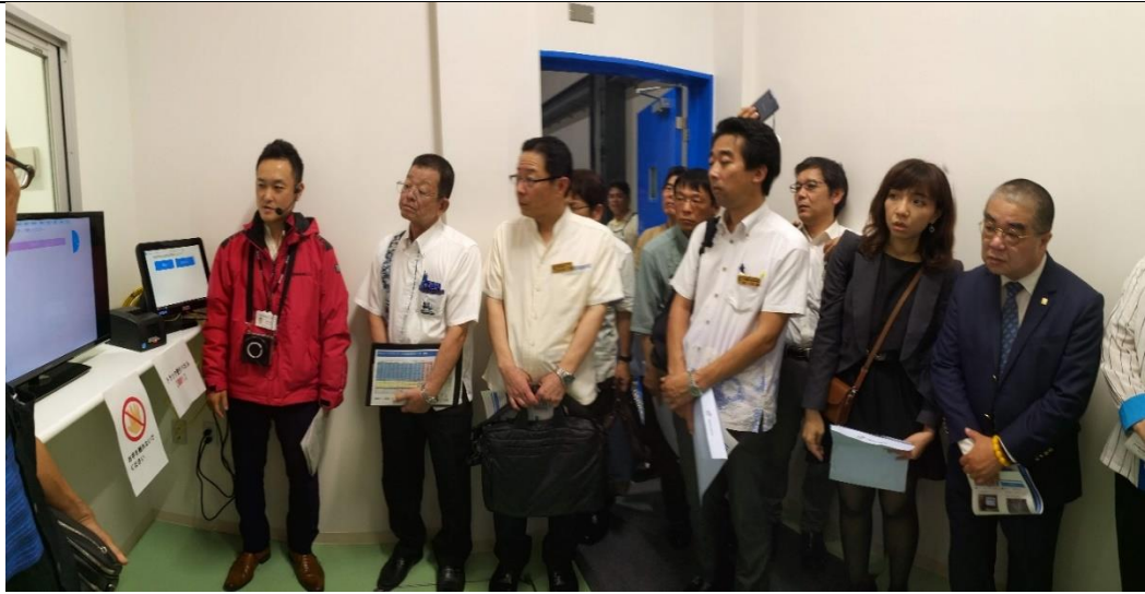
那霸港綜合物流中心參訪-進倉物品登陸及倉儲作業 (108/04/25)