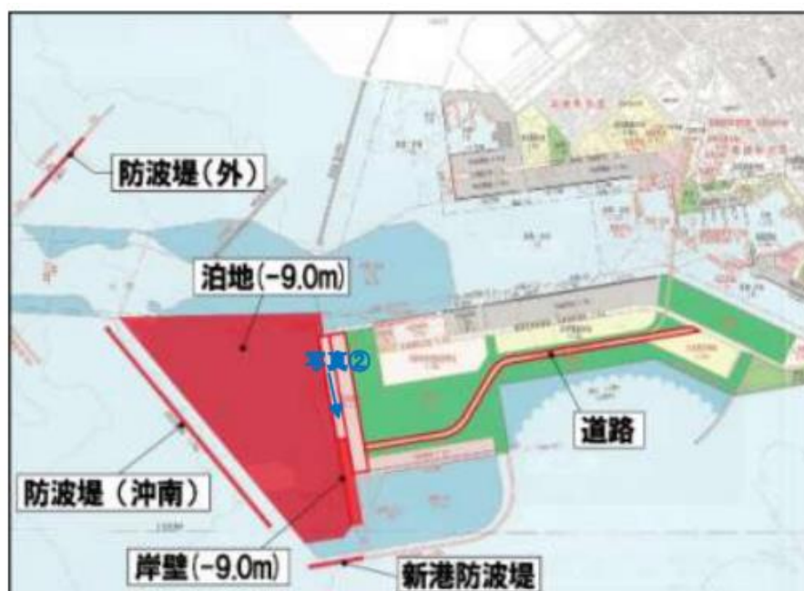
圖 5 石垣新港客運碼頭平面規劃圖

石垣市為了推動當地郵輪觀光發展，於石垣新港地區興建客運碼頭及大樓，預計水深-10m，總長度 420 公尺(1 泊位)。