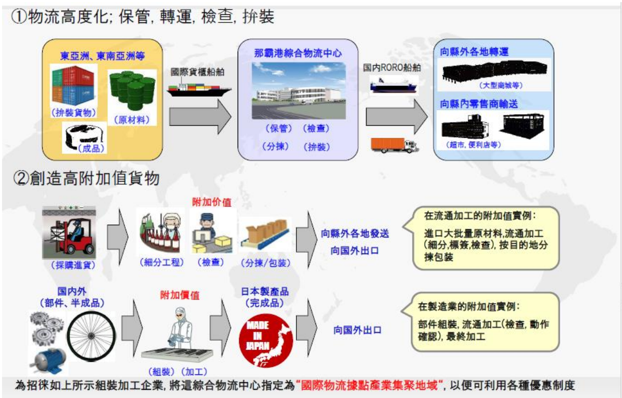
圖 3 物流中心運作流程