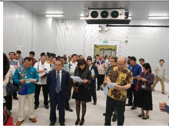
那霸港綜合物流中心-冷藏倉儲參訪 (108/04/25)