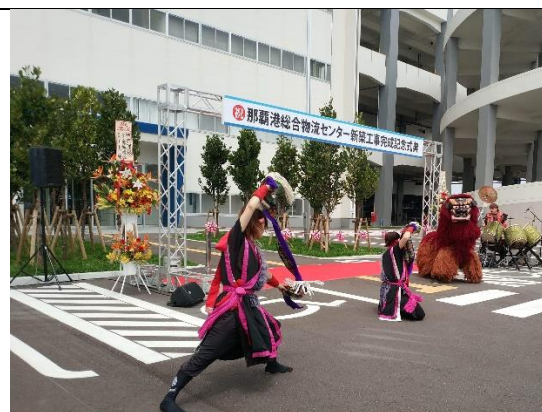
那覇港物流中心開幕表演-祥獅祈福 (108/04/25)