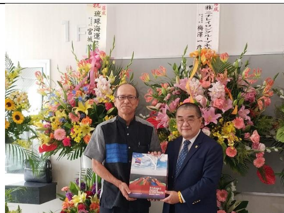
致贈那覇港物流中心紀念品 (108/04/25)