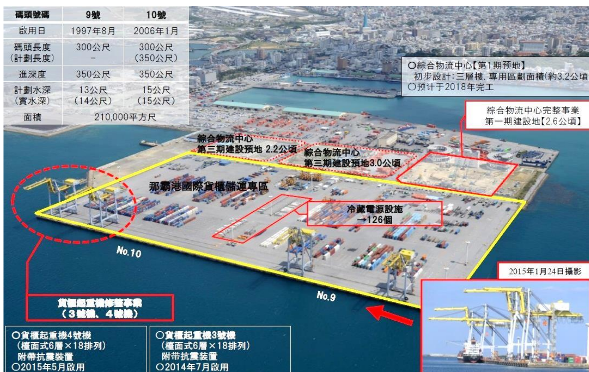
圖 1 物流中心及共用碼頭相對區位圖

物流中心經營模式為委外管理倉儲之分租業務，可進行倉儲、轉運、檢測、拼裝與加工等作業，以滿足業者冷凍、冷藏與常溫貨物經營需求。沖繩在地及海外原物料等可在加工後成為日本製，向國內外進行發貨，做為東亞及日本國內的物流據點。