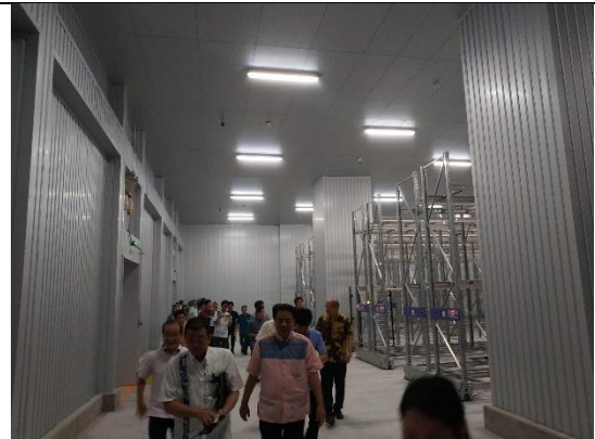
那霸港綜合物流中心-冷凍倉儲參訪 (108/04/25)