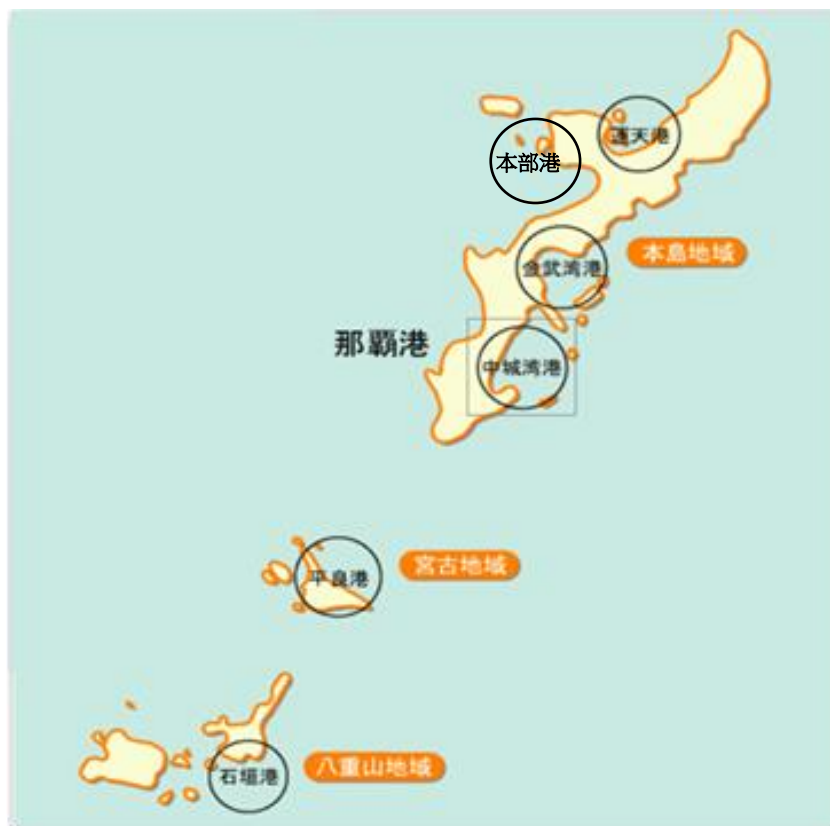
圖 4 沖繩地區主要港口