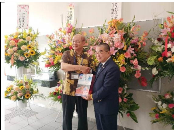
致贈那覇港物流中心紀念品 (108/04/25)