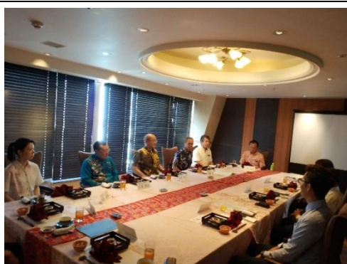
午餐商務會談情形 1 (108/04/25)