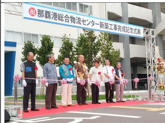
那覇港物流中心開幕剪綵 (108/04/25)