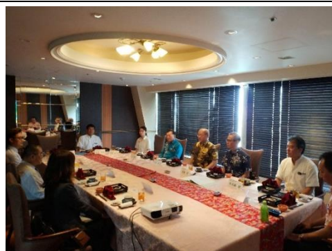
午餐商務會談情形 2 (108/04/25)