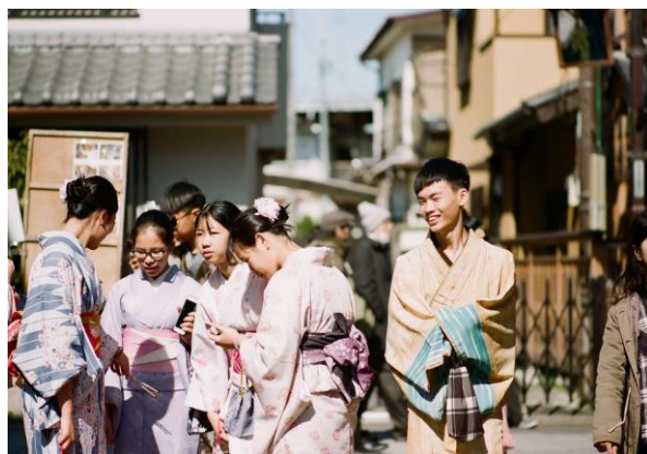
川越小江戸和服體驗