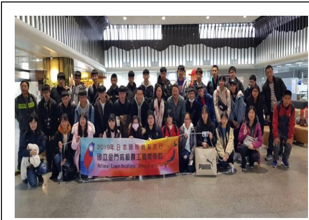
金門航空站搭機前往松山機場