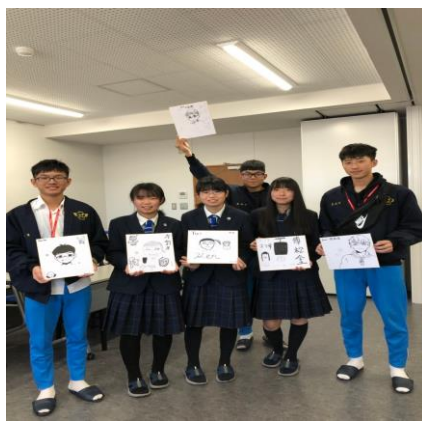
與漫畫科學生肖像畫交流