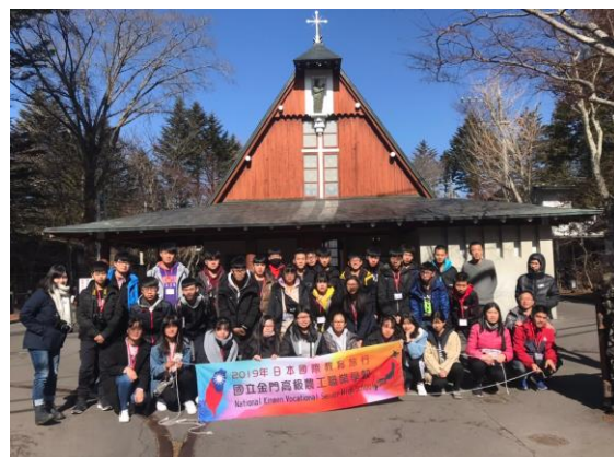
輕井澤舊銀座通聖保羅教堂前合影