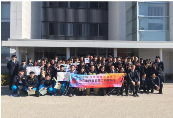
與松本國際高等學校師生合影