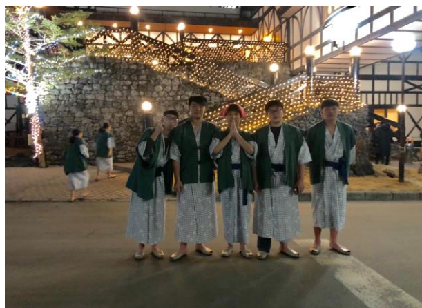
體驗日本泡湯文化