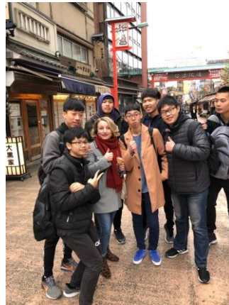
東京城市分組探索活動