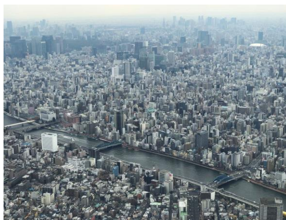
晴空塔瞭望台景致