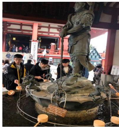
東京城市分組探索活動