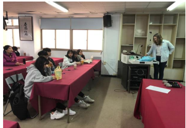
行前英文培訓課程