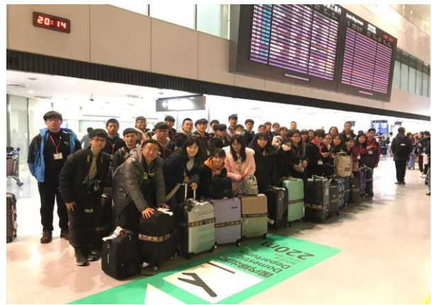
抵達東京成田機場