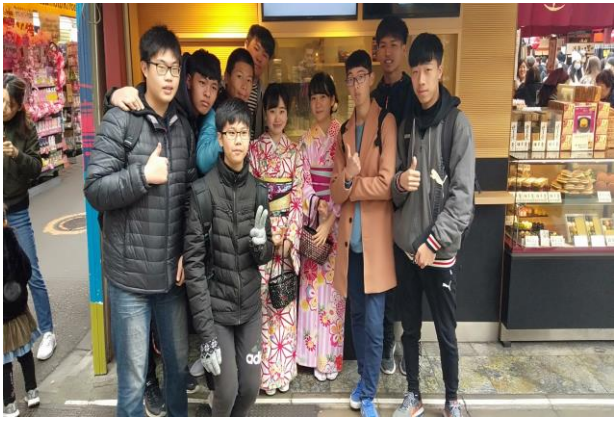
東京城市分組探索活動