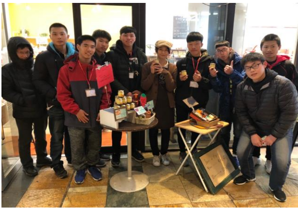
東京城市分組探索活動