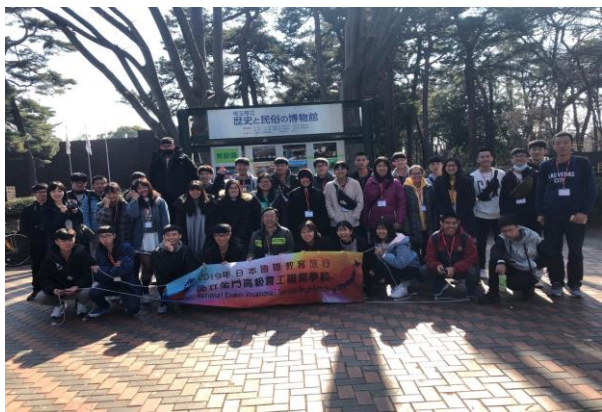
埼玉縣歷史博物館