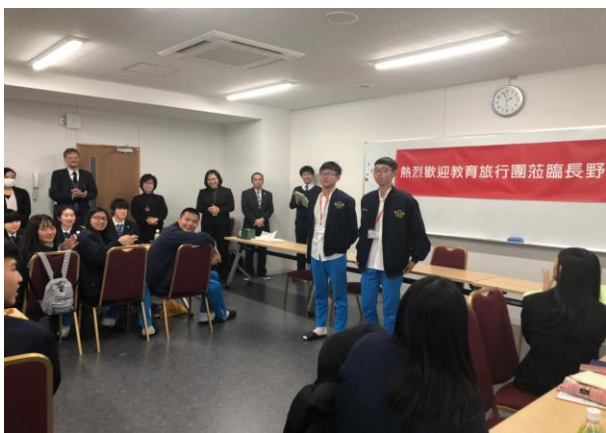
本校學生代表致辭