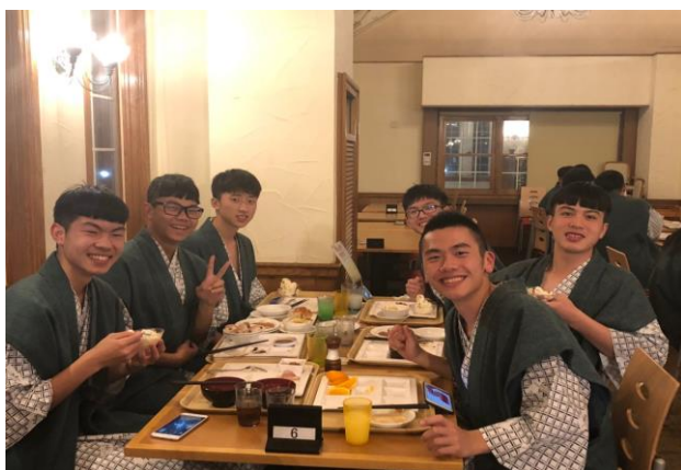
於 Green Plaza 內用晚膳