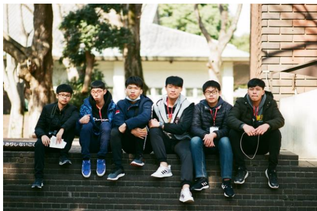
歷史博物館外小組合影