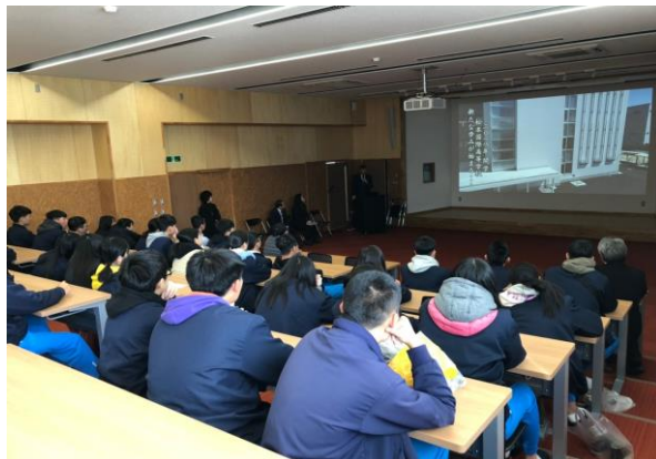
松本國際高等學校歡迎式