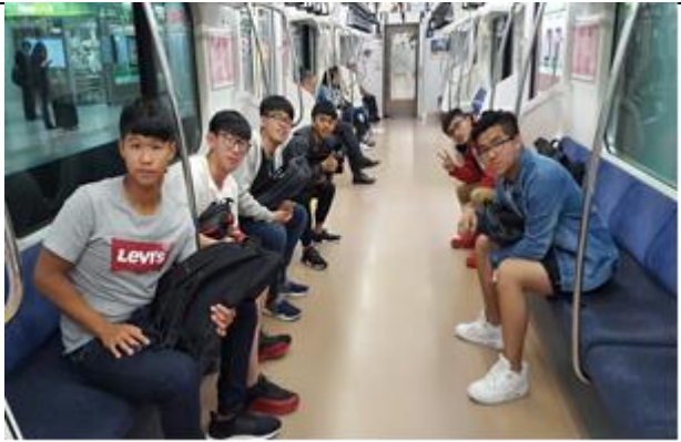
東京城市分組探索活動