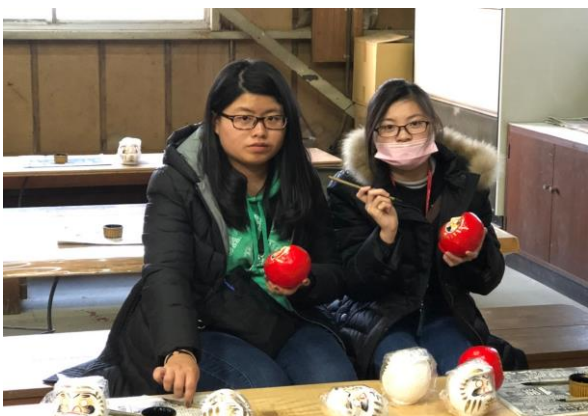
高崎達摩 DIY 體驗