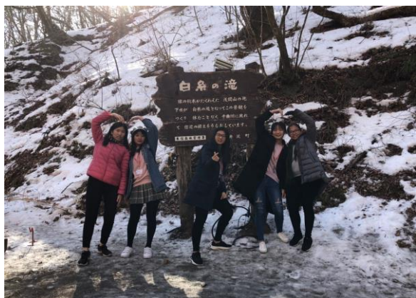
輕井澤白絲瀑布合影