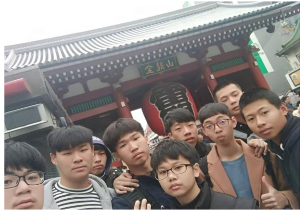
東京城市分組探索活動