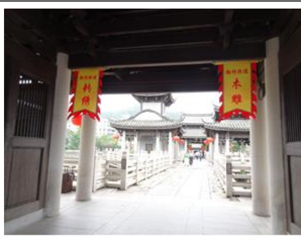
108年4月27日考察潮州市文化旅遊資源—廣濟橋，橋上規劃當地非物質文化遺產的展示區。