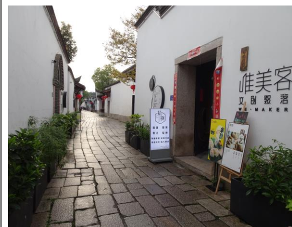
108年4月28日考察福建省福州市老城區「三坊七巷」，中國大陸列為全國重點文物保護單位，其逐漸轉型為文創聚落的經營方式。