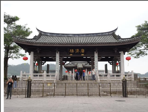
108年4月27日考察潮州市文化旅遊資源—廣濟橋，建於南宋、中國大陸列為全國重點文物保護單位。