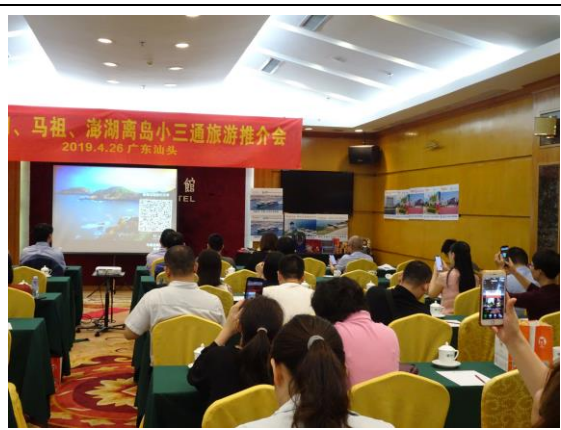
108年4月26日於廣東省汕頭市辦理觀光行銷推介會，潮州汕頭地區旅遊業者以手機掃描「陳楠馬祖遊記分享」二維碼並廣傳。