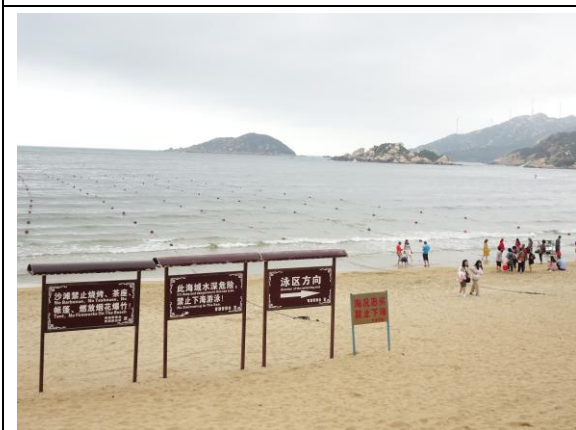
108年4月26日考察廣東省汕頭市南澳縣海島觀光經營之水域安全管理模式。