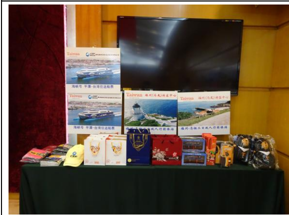
108年4月26日於廣東省汕頭市辦理觀光行銷推介會，本處準備馬祖陳年高粱等特色伴手禮作為抽獎禮品，加深潮州汕頭地區旅遊業者對馬祖的印象。