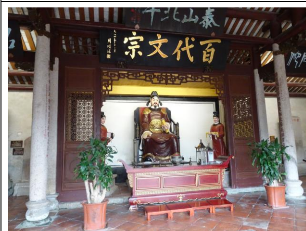
108年4月27日考察潮州市文化旅遊資源—韓文公（韓愈）祠，建於北宋、中國大陸列為全國重點文物保護單位。