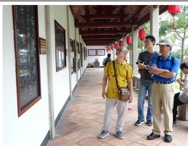
108年4月27日考察潮州市文化旅遊資源—韓文公（韓愈）祠，觀摩歷代關於韓文公之墨寶以石刻保留方式，讓遊客可長年欣賞。