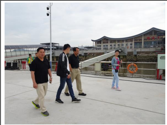
108年4月28日考察福建省福州市「閩江馬尾對台綜合客運碼頭」—琅岐港，實地看港口週遭環境。