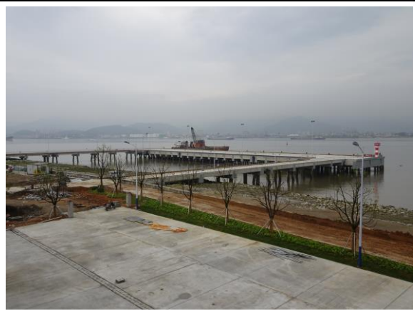
108年4月28日考察福建省福州市「閩江馬尾對台綜合客運碼頭」—琅岐港，實地看港口週遭環境。