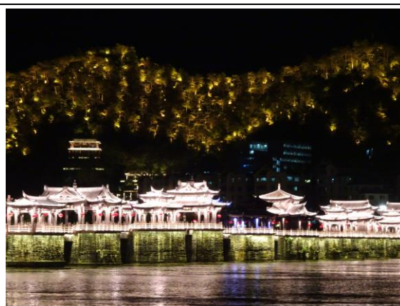
108年4月26日考察廣東省潮州市夜間旅遊經營方式—歷史古蹟與燈光結合，成為吸引遊客之亮點。