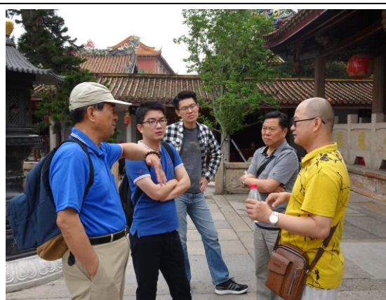
108年4月27日考察潮州市文化旅遊資源—開元寺，與大陸旅遊業者交流陸方對於保留歷史古蹟的作法。