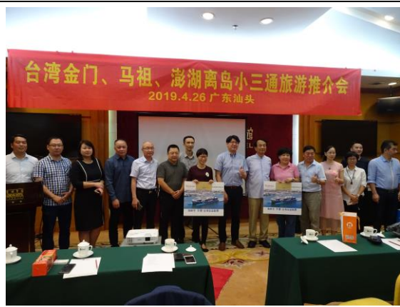
108年4月26日於廣東省汕頭市辦理觀光行銷推介會，主辦單位與獲抽獎品之潮州汕頭地區旅遊業者合影。