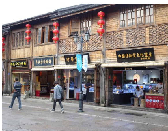
108年4月28日考察福建省福州市老城區「三坊七巷」，中國大陸列為全國重點文物保護單位，街上保留許多傳統技藝的店家。