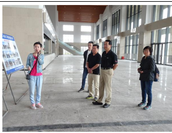
108年4月28日考察福建省福州市「閩江馬尾對台綜合客運碼頭」—琅岐港，由解說人員說明港口開發工程進度與預期成效。