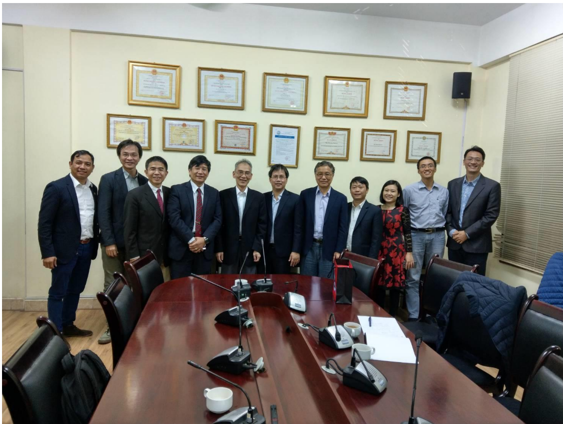
圖 3 我方人員與 IMHEN 進行交流討論後合影