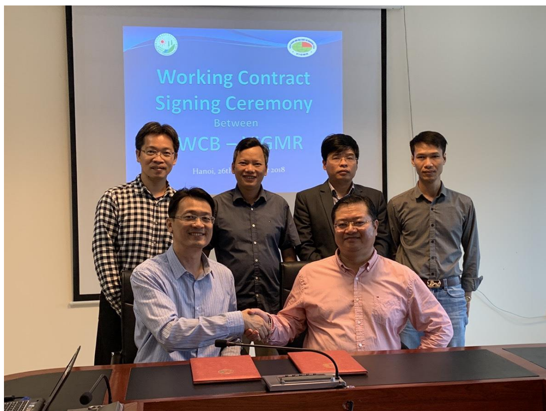
圖 6 我方人員與 VIGMR 人員於簽署完成後合影