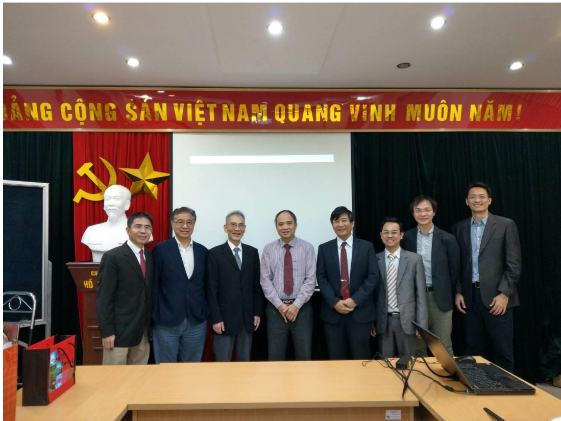
圖 4 我方人員與 IGP 進行交流討論後合影