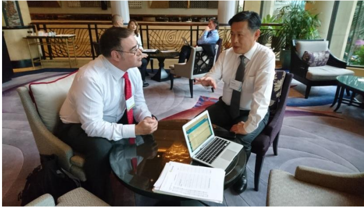
校長與外師面試合影