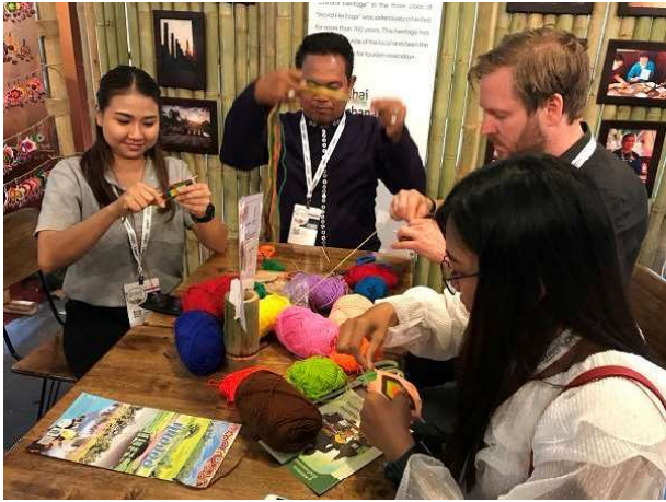
會場提供 Tantawen 花製作教學