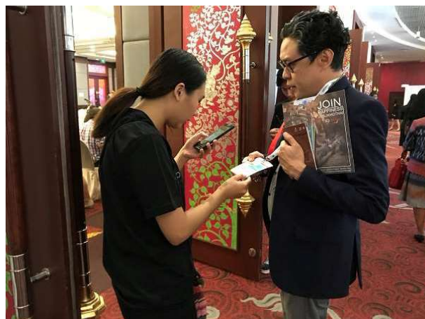
進出年會各場次均掃描 QR cord