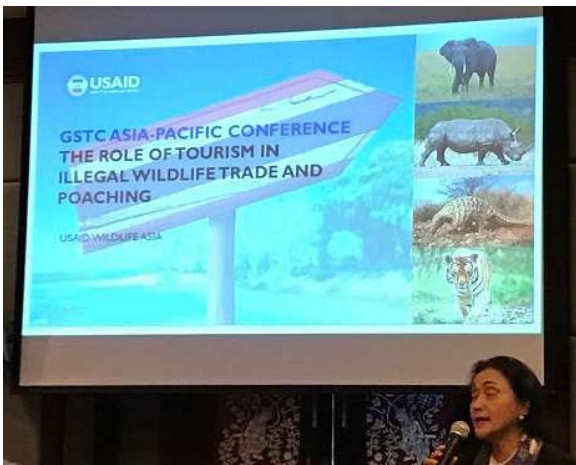
旅遊中之非法野生動植物買賣、偷獵場次