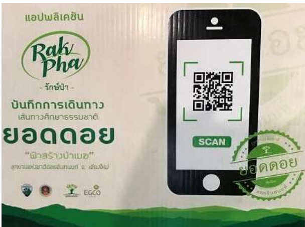
QR cord 導覽解說