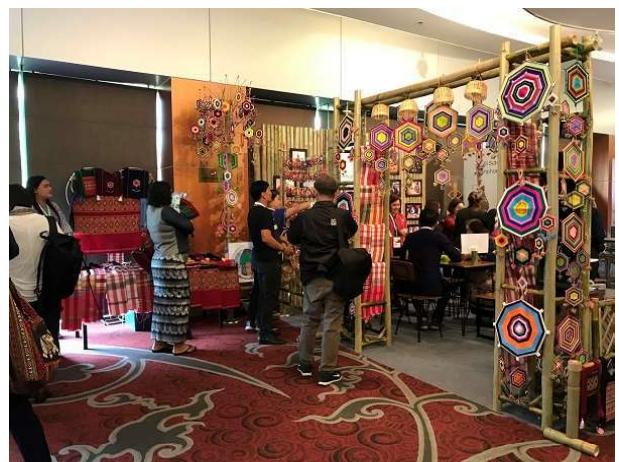
會場布置-Tantawen 花展示、在地產品展售