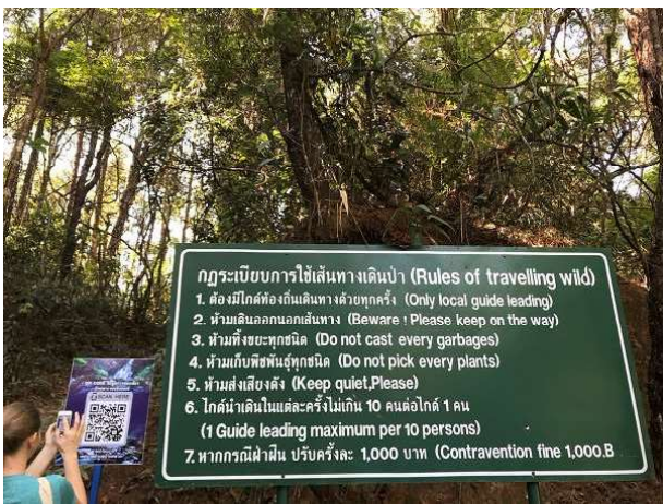
Doi Inthanon 國家公園野外旅行規則