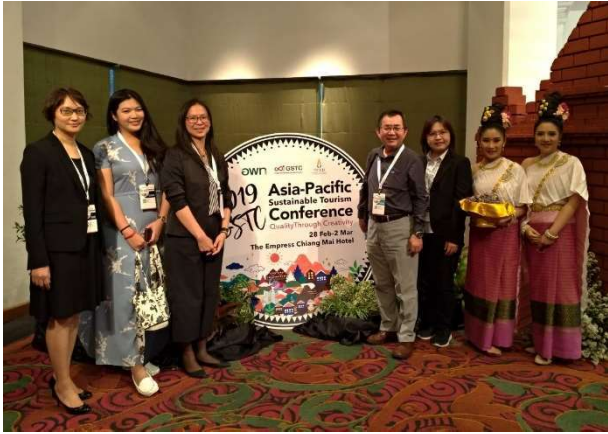
亞太年會晚宴迎賓