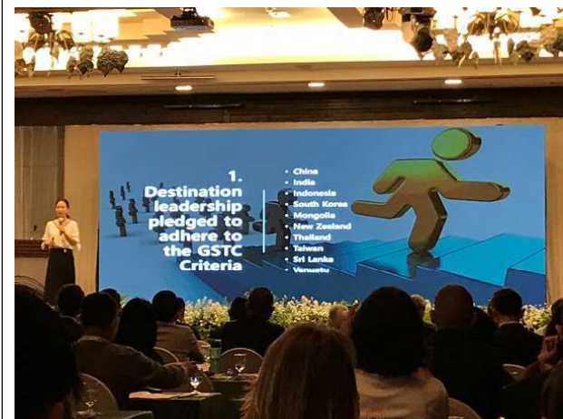
Mihee Kang 介紹 GSTC 亞太地區概況