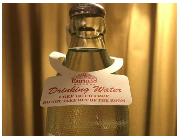
飯店房間提供（可再使用）玻璃瓶裝水