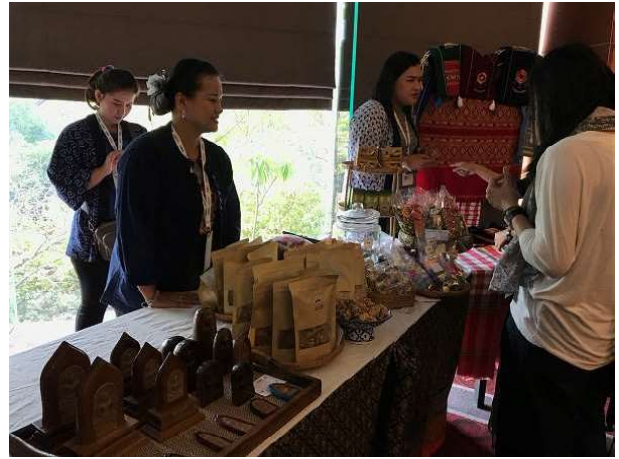
會場提供在地產品展售