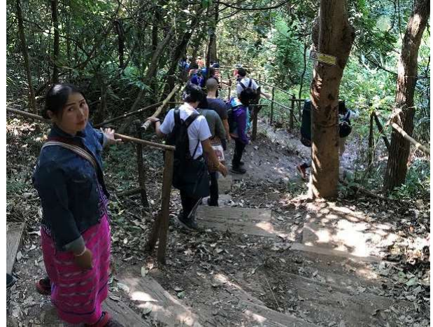
提供並保證在地嚮導就業機會