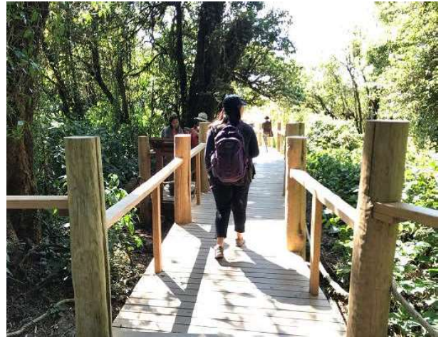
卡樺式步道與環境相容