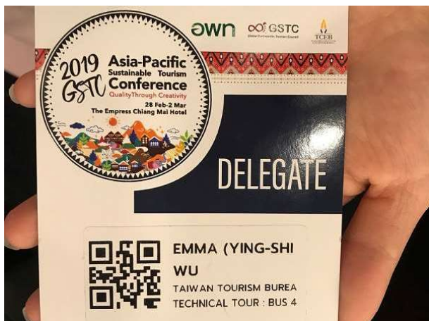
年會參與人員紙製名牌（含 QR cord）