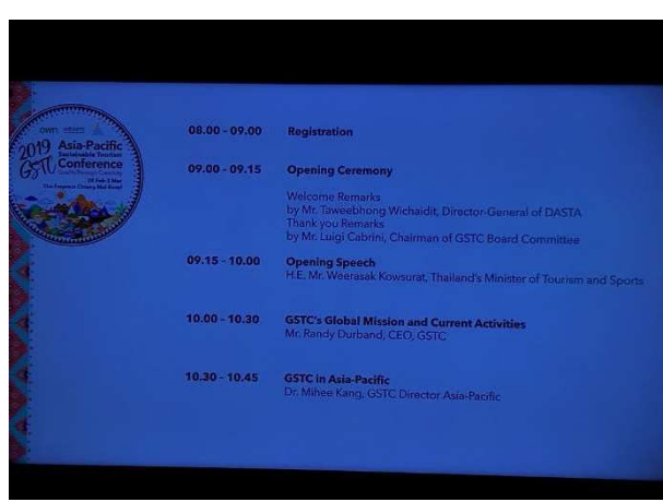
會議議程以電子看板呈現