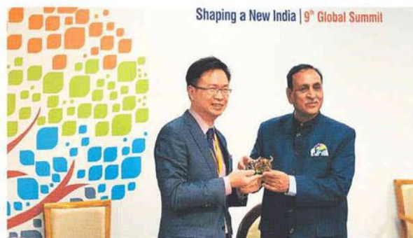
●印度古吉拉特州州長Mr. Vijay Rupani（右）親自接見由外貿協會董事長黃志芳（左）率領的台灣投資團。

黃志芳受邀主持「中小微型企業論壇（MSME Convention）」，並發表專題演講指出，台灣中小企業在台灣經濟發展過程中扮演關鍵性的角色。他強調，台印產業具高度互補，應運用雙邊中小企業共創SME生態體系目標，貿協將是促成雙方合作最重要的平台。