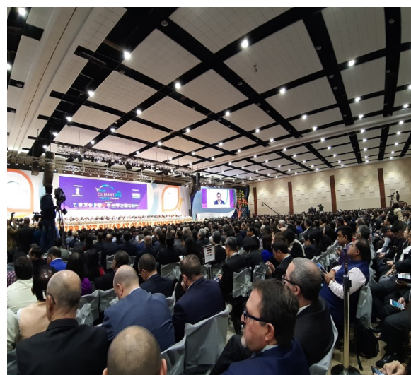
▲Vibrant Gujarat Global Summit 2019 (2019年活力古吉拉特州全球高峰會)開幕盛況