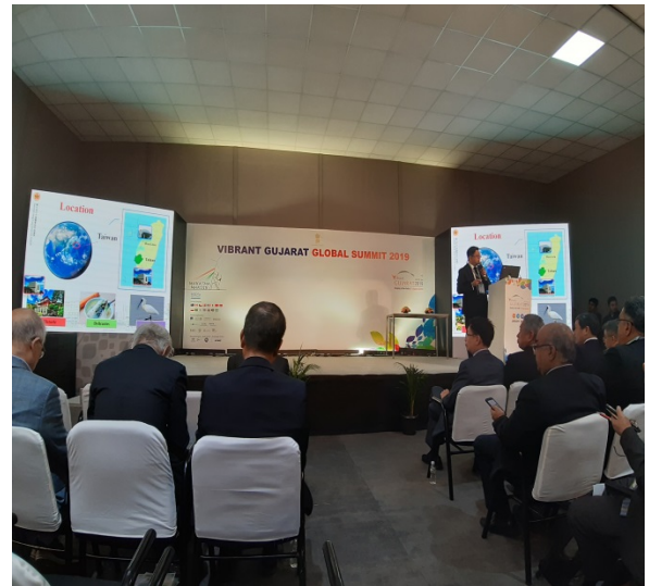
▲本院受邀於該論壇中發表針對台灣醫療之演講