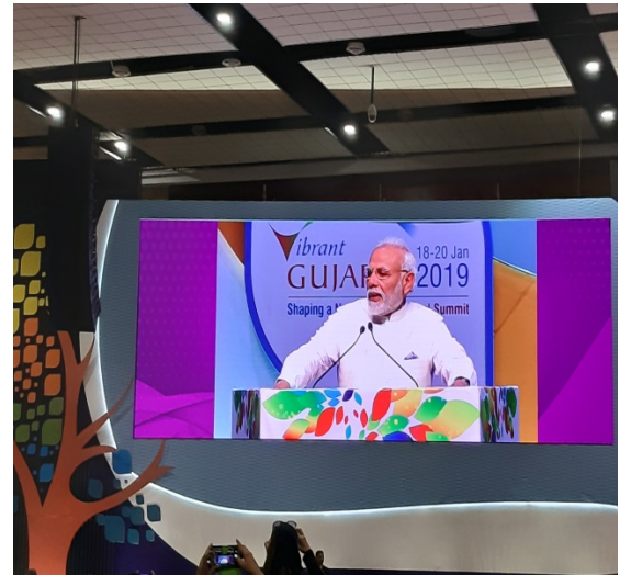
▲ Narendra Modi, Prime Minister, India(印度總理莫迪)