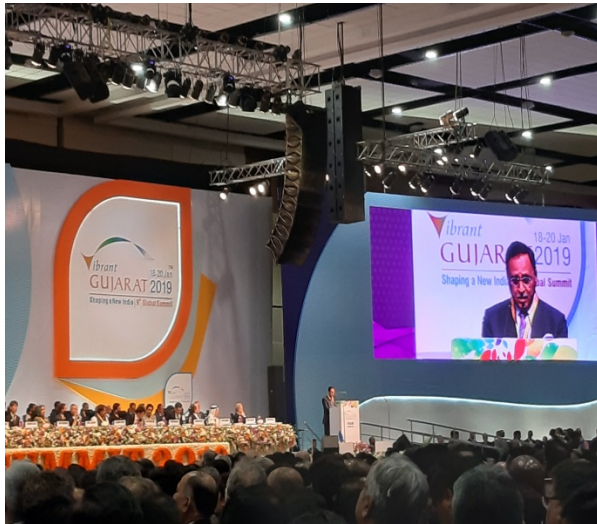
▲ Vijay Rupani, Chief Minister, Gujarat (古吉拉特州州長魯帕尼)