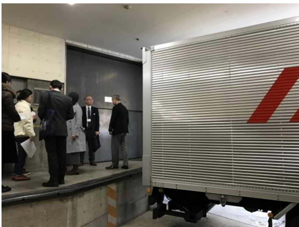
圖八、借展文物卸貨平台