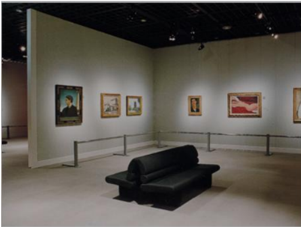
圖六、展場(參考自 https://www.bunkamura.co.jp/pickup/exhibition.html ，檢