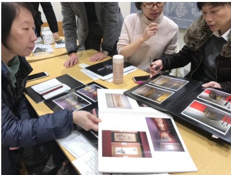
圖七、參閱東急文化村美術館過去展覽的書畫展櫃照片