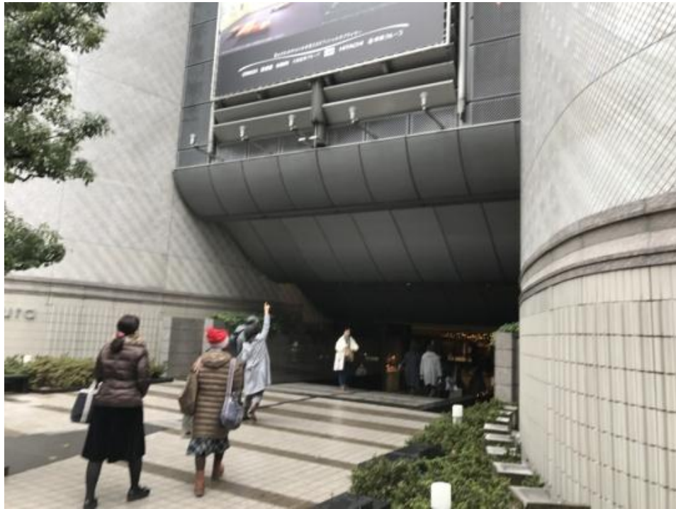
圖一、文化村大樓入口