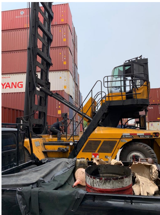
(圖四)引擎過熱導致電線熔絲現場處置