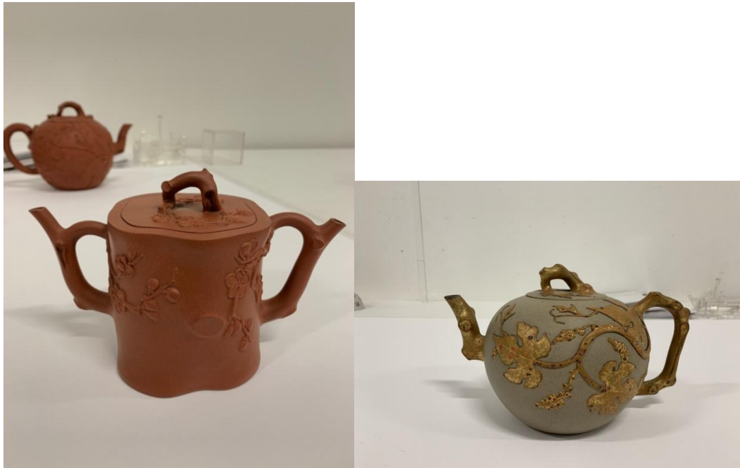
格羅寧根博物館藏紫砂雙流壺、紫砂金彩貼花葡萄紋壺