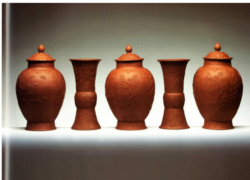
茨溫格宮藏紫砂貼花蓋罐、觚