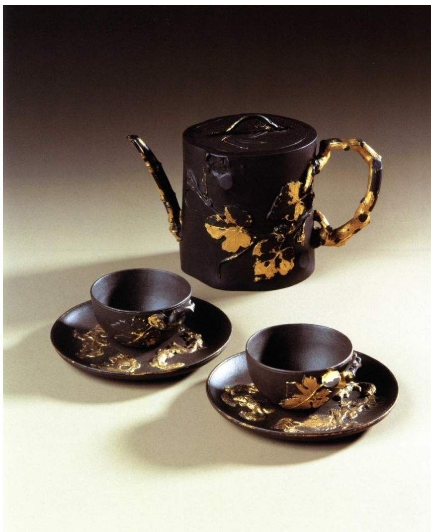
茨溫格宮藏紫砂貼花金彩壺、杯