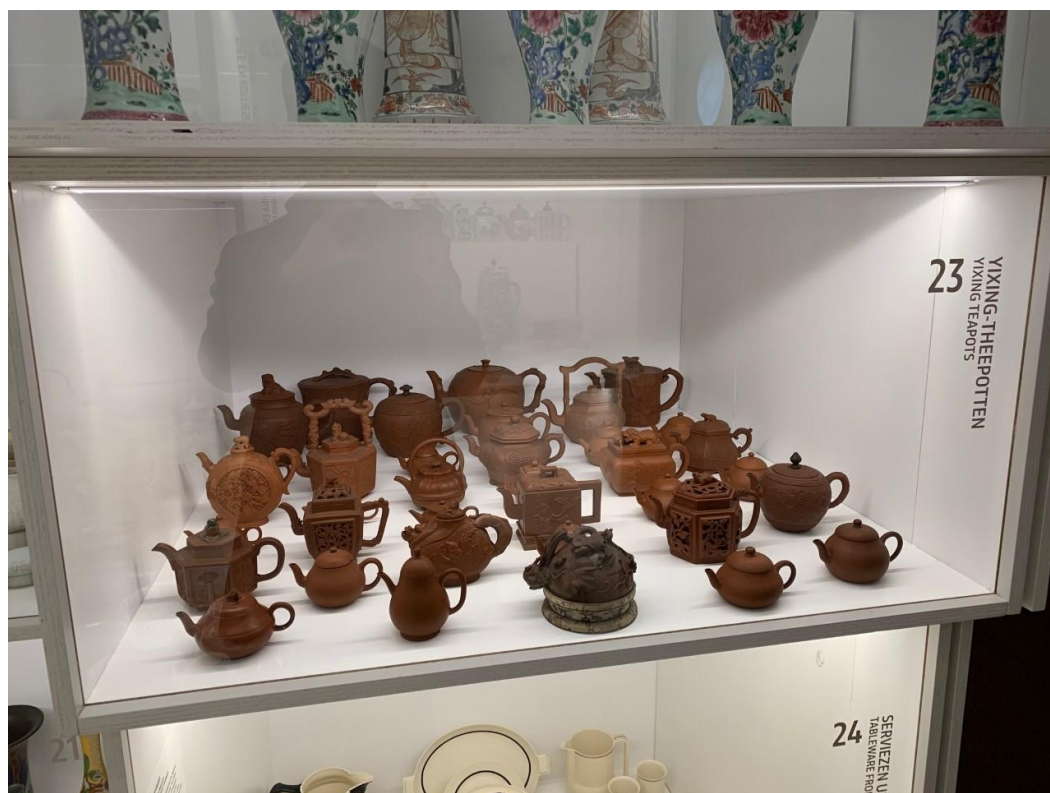
呂伐登公主瓷器博物館陳列室

呂伐登公主瓷器博物館是歐洲地區頗為重要的陶瓷博物館之一，以收藏東方、西方陶瓷著名，年代擴及古代至近現代。該館所藏之紫砂器，年代早至清早期，晚至近代。器類僅見茶壺、杯類，同以茶壺類佔絕大多數。裝飾技法可見貼花、鏤雕等作品，並有許多器表光素無飾之作，後者為格羅寧根博物館、茨溫格宮少見的一類作品。值得注意的是，該館展廳陳列之「萼圃督製」款紅陶梨形壺、紅陶魚鈕壺，外觀雖似紫砂器，然而依據整體造型、壺身內外有色差等特徵，應為廣東潮州窯場仿製紫砂器之作。目前雖無「萼圃督製」款紅陶梨形壺、紅陶魚鈕壺一類製品之可供對應的考古正式出土資料，依據筆者上手流傳於日本、臺灣市肆之同類製品，得以確認應為潮州地區所製。換言之，除了歐洲窯場仿製紫砂器的課題之外，上述呂伐登公主瓷器博物館所藏文物，亦提示中國本地其他窯場與宜興窯紫砂器的工藝交流，為日後值得關注的課題。