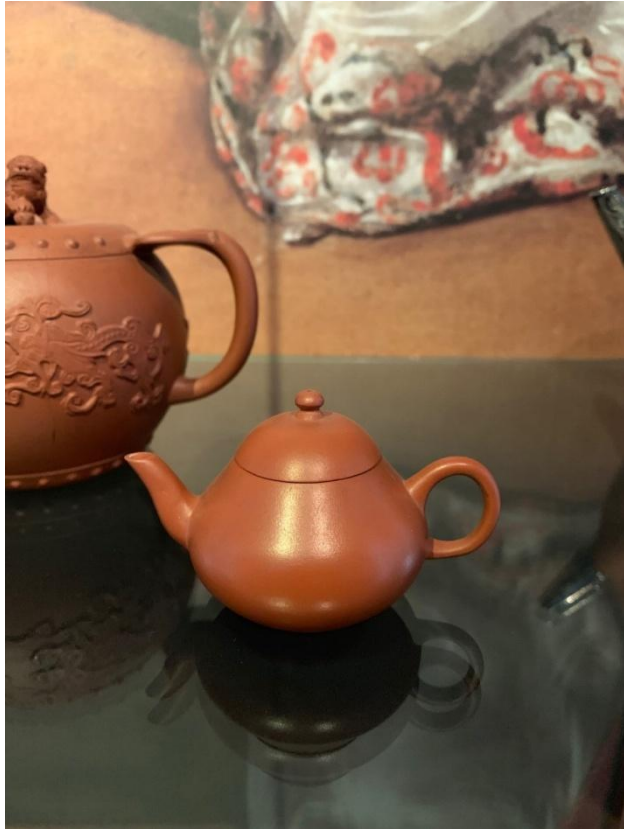
「萼圃督製」款紅陶梨形壺