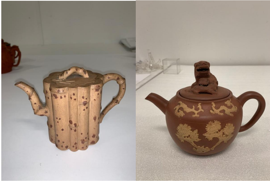
格羅寧根博物館藏紫砂斑竹竹節壺、紫砂貼花龍紋獅鈕壺