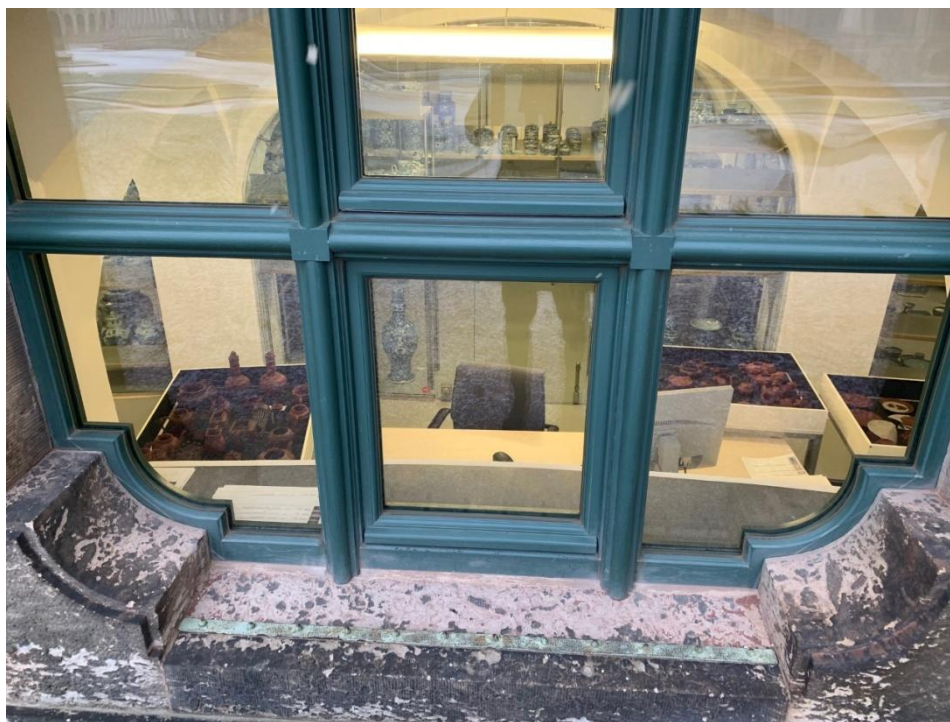
茨溫格宮庫房內工作一景

強者奧古斯都舊藏的紫砂器，為歐洲傳世紫砂器中，數量眾多、質量頗精的一批重要作品。另外，因強者奧古斯都曾針對其珍藏之中國、日本陶瓷，整理、登帳，目前所知有 1721 年、1779 年之紀錄，可知部分作品的年代應可上溯 1721 年、1779 年之前。此一重要年代觀，可供其他考古出土、沉船打撈或博物館收藏等同類製品之重要參照。茨溫格宮藏紫砂器器類包含茶壺、茶葉罐、塑像、碟、碗、蓋碗、杯、爐、蓋罐等，品類頗為眾多，同以茶壺類製品佔絕大多數。依裝飾技法來說，包含貼花、鏤雕、飾金、加彩、加鑲金屬等作品。根據筆者實物上手結果，作品中實際上包含了中國、日本與歐洲地區的製品。就比例而言，絕對多數仍屬中國宜興窯所燒製的紫砂器，僅少數為日本、歐洲地區窯場模仿之作。然而，確認為紫砂器的製品中，年代早至清早期，晚卻可至近代。換言之，部分紫砂器並非強者奧古斯都舊藏，實為後來混入的晚期製品。另一方面，即便紫砂器的年代落在 1721 年、1779 年之前，也不一定即屬強者奧古斯都舊藏，而可能為後來入藏之同時期製品罷了。因此，有關強者奧古斯都舊藏紫砂器之課題，仍有待更多實物、文獻的比對。