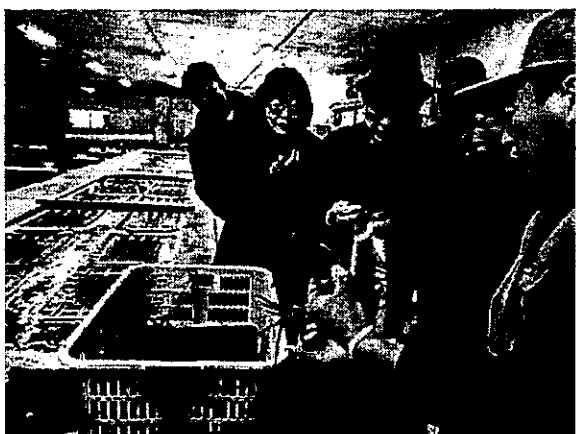
圖 5、南房總千倉川口水產養殖所