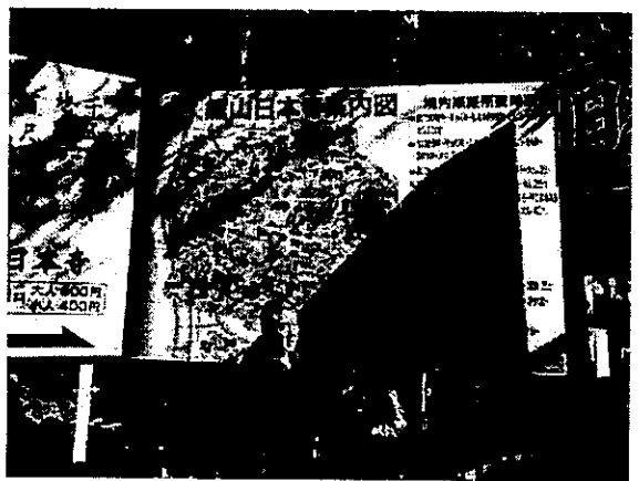
圖 10、鉅山日本寺參訪