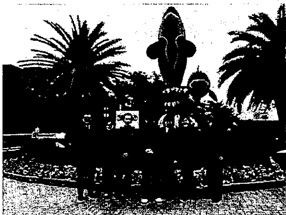
圖 3、Kamogawa Sea 參訪