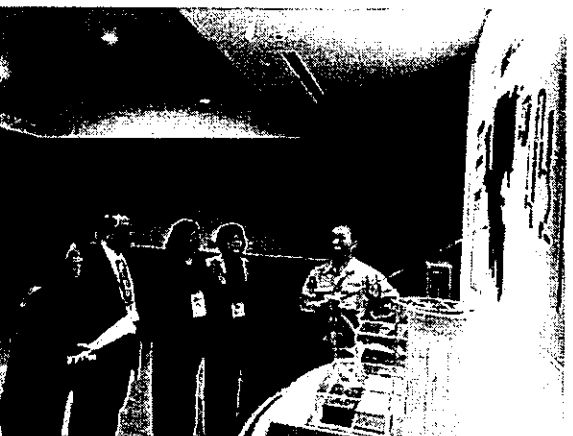
圖 11、千葉市綠能環保參訪