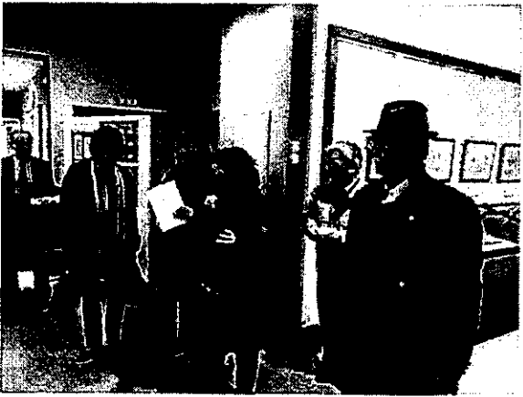
圖 9、菱川師宣紀念館參訪