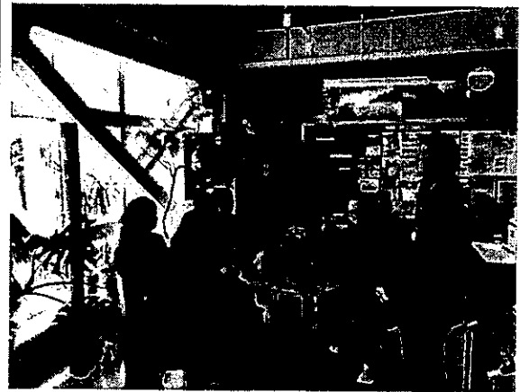
圖 8、保田小學 BOT 參訪