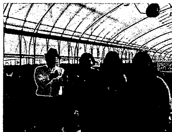
圖 2、千葉縣相葉草莓園考察