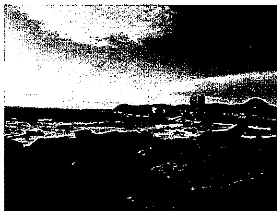
圖 4、白浜野島埼燈塔