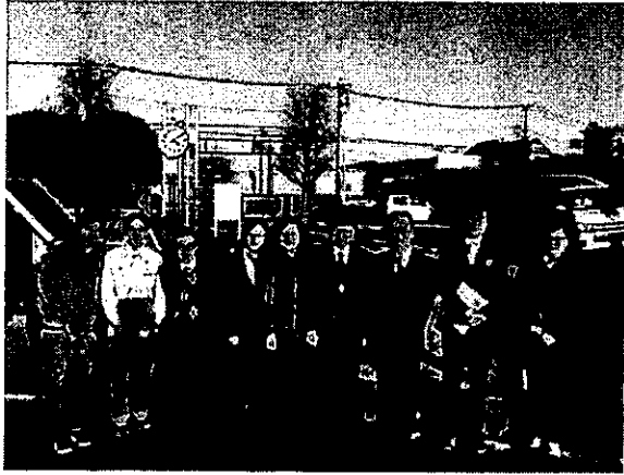
圖 7、千葉縣立京葉工業高校參訪