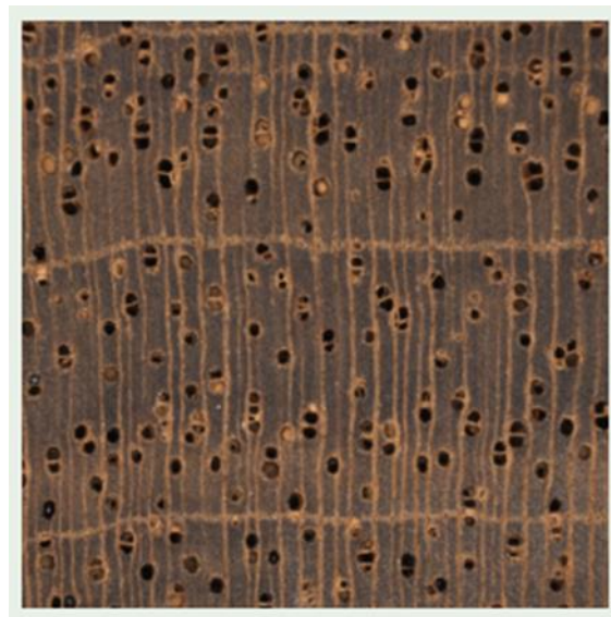
圖 4：木材樣品切面圖

美國森林局介紹手持式機器視覺技術自動化木材識別系統(XyloTron)，目前參與此研究計畫的成員，包括來自美國、加拿大、智利、法國、洪都拉斯、秘魯及馬達加斯加等，該系統透過利用高倍率光學影像設備，獲得未知木材樣品切面末端的顆粒圖片(圖 4)，再透過信號轉換將該形態學特徵，與資料庫內參考影像進行比較，再從該參考影像集合中選擇最匹配度最高的物種，目前該系統辨識率較高的物種約 37 種，面臨主要的挑戰在於影像資料庫之深度及廣度需持續增加，以增加比對辨識率。