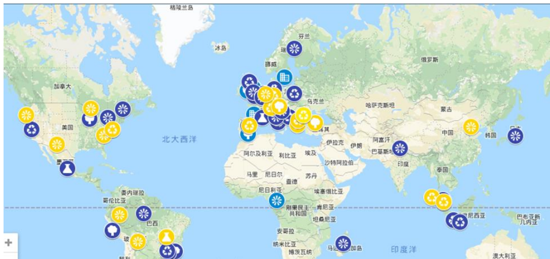
圖 5：GTTN 服務可提供分析服務單位位置分佈

澳洲介紹全球木材追溯網絡(Global Timber Tracking Network, GTTN)服務,該網絡之成員主要為相關背景之專家學者,分別組成三個工作小組,核心活動項目包括標準化方法、構建數據資料庫和專家目錄、溝通及宣傳,在標準化方法部分,主要為確定木材追溯方法之關鍵步驟、審查指南及分享制定國際指南之經驗;在建構資料庫及目錄部分,係考量所有利益相關方需求,建立資料庫及共享數據,同時共享實驗室聯繫方式和專業知識;而在溝通及宣傳部分,則設法匯集決策者、從業者和研究人員之需求,提供協助並引導,另一方面則同時向全球木材供應鍊網絡之研究人員和利益相關者通報可能可運用之服務,該網絡目前整合全球約 40 個公、私單位,可提供在解剖、化學及 DNA 等方面之分析服務(圖 5)。