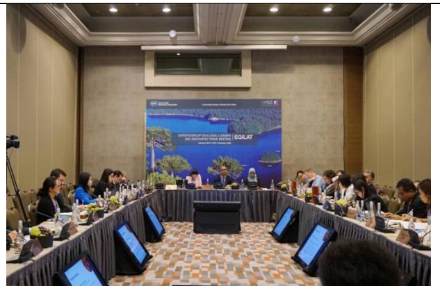
EGILAT 15 會議情形