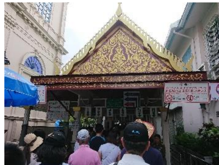
玉佛寺&大皇宮入口