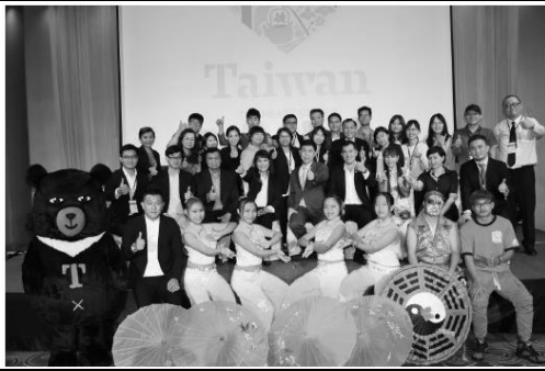
臺灣觀光代表團會後合影