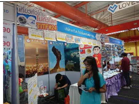
旅展中販賣臺灣旅遊業者展攤