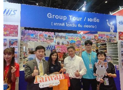
拜會旅展合作泰國業者