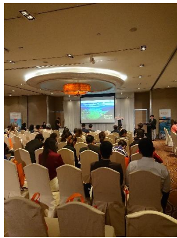
臺灣觀光推廣會-說明會