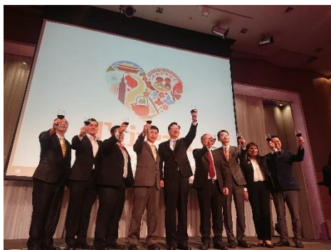
臺灣觀光推廣會-晚宴