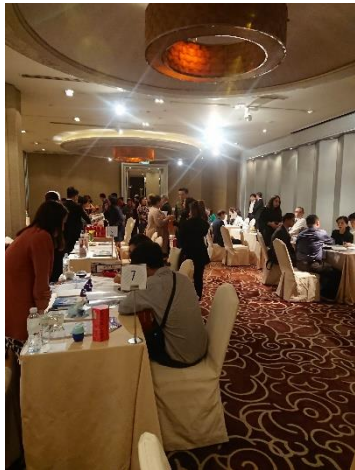
臺灣觀光推廣會-旅遊交易會