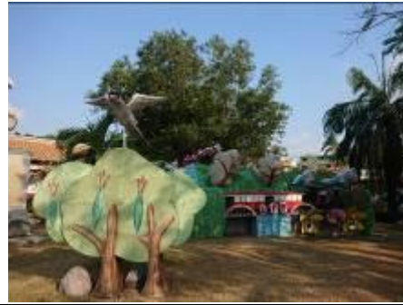
暹羅代天宮展出 2018 臺灣燈會贈送燈組