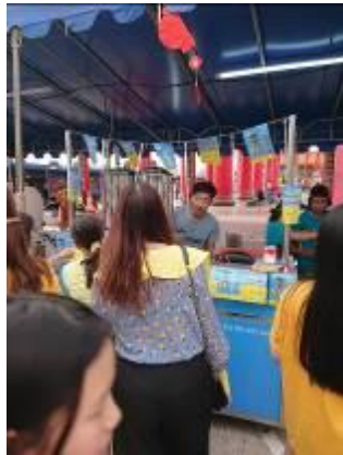
代天宮燈會臺灣美食街手搖飲料攤位