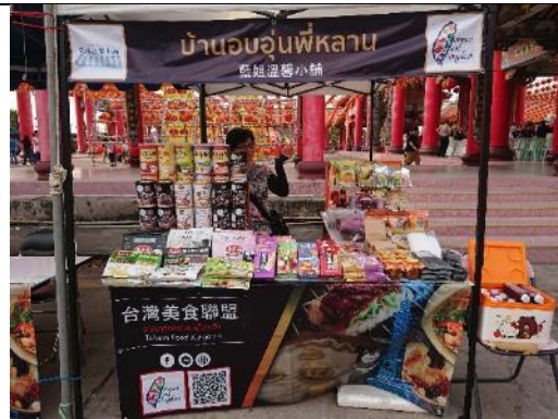
代天宮燈會臺灣美食街特產攤位