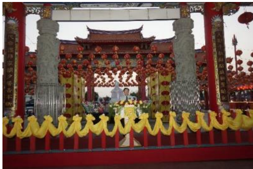
開幕儀式-童振源大使致詞