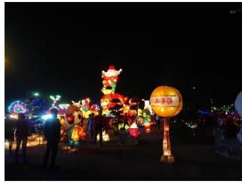
代天宮展出本局贈送之 2018 年臺灣燈會主題燈組