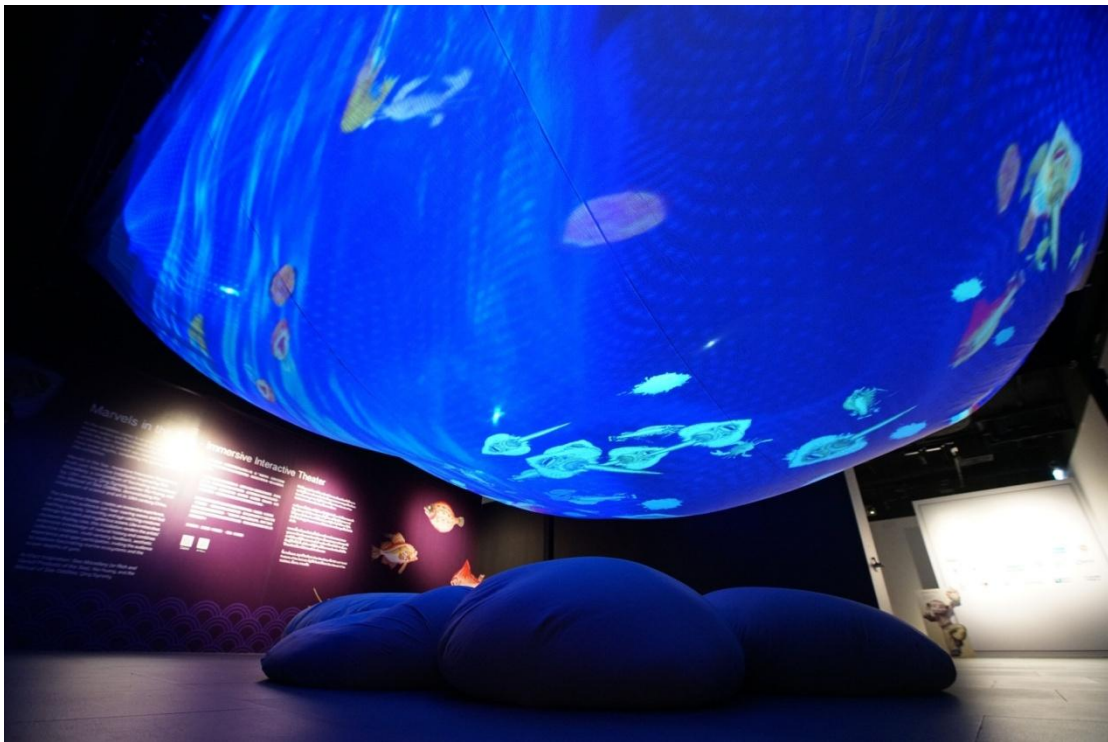
圖 2：「海錯奇珍－沉浸式互動劇場」

展覽的一開始透過「神遊幻境」虛擬實境裝置，邀請觀者進入古代文人的書畫世界，民眾可以戴上虛擬實境頭盔，直接走入元代趙孟頫的名畫〈鵝華秋色〉中。「筆墨行旅」展區精選以水岸景色為主題的典藏繪畫與書法作品，引導觀眾遊覽古典書畫中的山水景緻，並進一步認識院藏文物背後橫跨千年的歷史。在「河畔生活」主題展區，「古畫動漫－清明上河圖」以氣勢磅礴的長卷投影牆呈現在觀眾眼前，透過動態畫面詮釋院藏〈清院本清明上河圖〉中古代沿河居民的日常生活與場景。接著，參訪者進入「水岸印象」展區，以數位藝術裝置的形式體驗各式古老水域的多元面貌。展覽的末段，觀眾也將來到河流的尾端，在河海交會處，欣賞以院藏〈海錯圖〉與〈海怪圖記〉發想的大型新媒體藝術裝置「海錯奇珍－沉浸式互動劇場」（詳圖 2）。