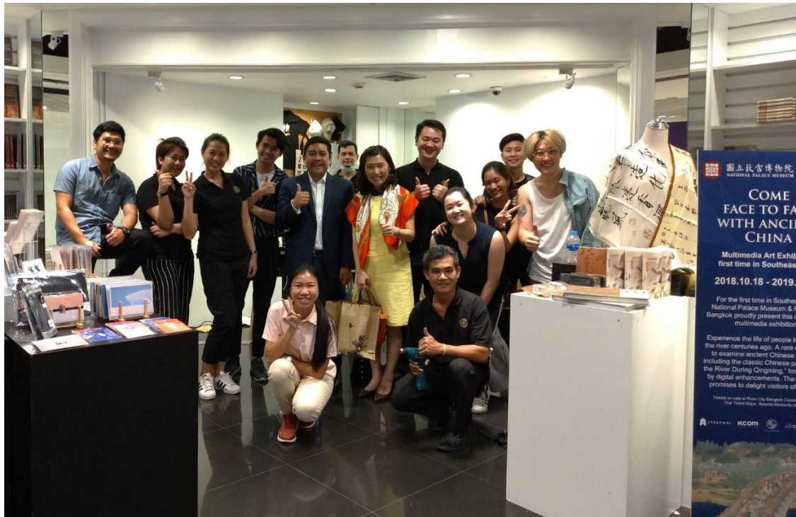
圖 13：河城藝術中心全體於展場外之文創展示區合影

一切準備就緒後，本院長官抵達展場檢驗展場狀況，本院同仁亦同時向河城藝術中心之技術人員與工讀生進行教育訓練與展場導覽(詳圖 14、15)，分批解說展件設備之操作方式，並深入講解展覽內容。由於河城藝術中心員工與內部工程師較少接觸新媒體藝術裝置，也為避免多媒體設備有故障情形產生，特別在過程中告知泰方尚可以將大型新媒體裝置接通網路並透過遠端連線的方式排除故障。此外，由於現代通訊設備相當便捷，教育訓練完成後亦於通訊軟體建立跨國技術支援群組，方便雙方及時通訊解決突發問題。