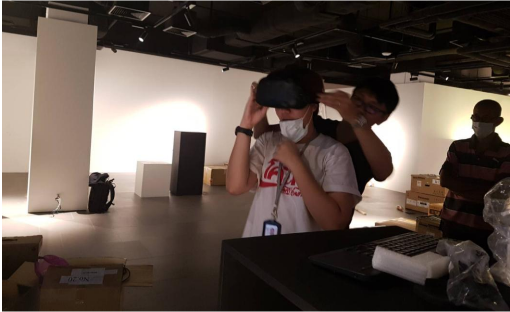
圖 5：教展處同仁協助現場泰國佈展人員體驗虛擬實境內容