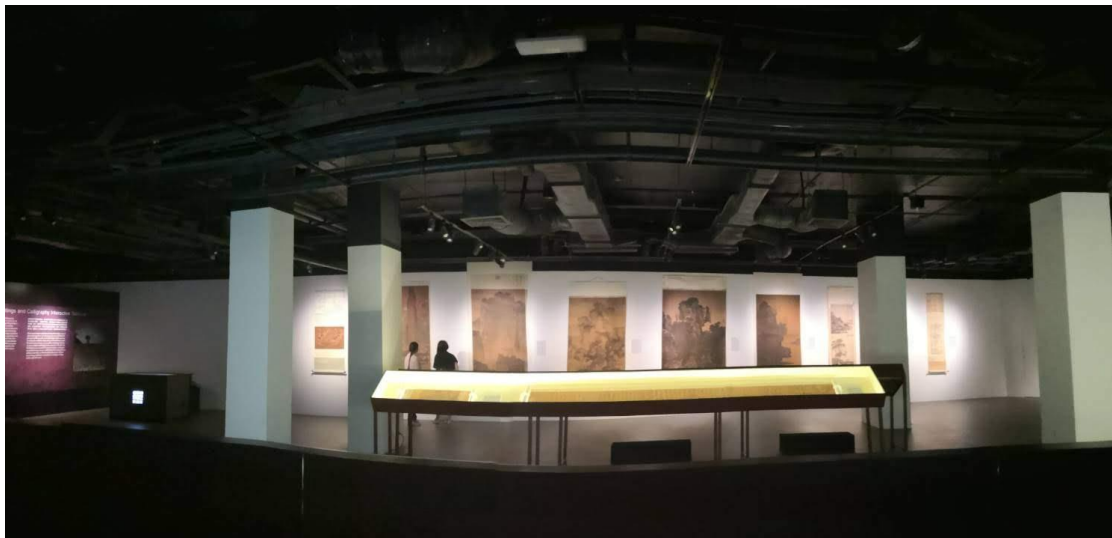
圖 8：本院典藏文物之高仿真複製畫陳列區

如元代黃公望〈富春山居圖〉、倪瓚〈容膝齋圖〉、吳鎮〈洞庭漁隱〉、明代唐寅〈溪山漁隱〉、仇英〈秋江待渡圖〉、清代朗世寧〈畫魚藻〉等經典書畫作品之高仿真複製畫(詳圖 8)。本展區也放映「筆墨行旅」系列影片與講述中國書法歷代演化之「翰逸神飛」影片，透過高解析度的影像展現文物的細節與故事，展演書畫作品中的意境。