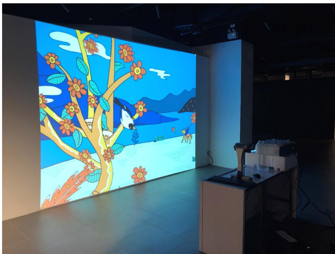
圖7：「神奇百駿」數位展件泰國現場布置

此一「神奇百駿」數位展件係發想自本院文物清郎世寧〈百駿圖〉，該圖為傳教士郎世寧繪於清雍正六年(1728)，為郎世寧早期作品。畫作描繪姿態各異的百匹駿馬，在原野中或臥或立，有些嬉戲覓食、有些遊憩在草原、林木之間。郎世寧透過細膩的光影變化呈現出精緻的寫實特質，並將西洋光影透視法融入中國傳統繪畫技法，呈現中西兼容的繪畫風格。而數位展件部分利用投影方式及繪圖掃描機構成，民眾可先於本院現場準備之馬匹著色圖紙上色後，經由繪圖掃描機掃描自我創作到投影牆上，達成多人集體創作概念。本展件安裝數量較前一天少，故在安裝佈建完成並反覆測試後即完成本日目標(詳圖7)。