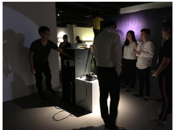
圖 14、圖 15：教展處同仁於泰國進行教育訓練與現場導覽情形