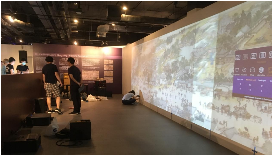
圖 9：「古畫動漫－清明上河圖」泰國現場布置與影像校對工程