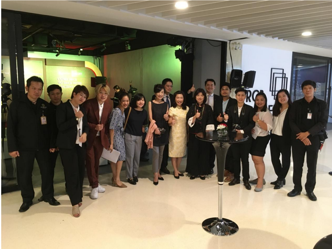
圖 27：本院開幕出席人員與河城藝術中心工作人員合影