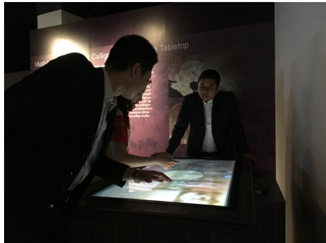
圖 10：本院教展處同仁調整院藏文物高仿真複製畫(左) 圖 11：本教展處同仁協同 Italthai 集團董事長與河城藝術中心總監檢驗互動桌布置情形(右)

同時，另一組工程師逐步將已布建數日的大型新媒體裝置「夏荷」與「海錯奇珍－沉浸式互動劇場」安裝完成。「夏荷」體感互動裝置呈現南宋畫家馮大有〈太液荷風〉筆下盛夏的荷花池，觀眾可以踏上水池裡的荷葉，欣賞眼前荷花盛開的景色，或逗玩朝著腳下游來的魚兒，感受夏日水畔蓬勃的生命力(詳圖 12)。本院的大型新媒體裝置「海錯奇珍－沉浸式互動劇場」取材自清代生物學家暨畫家聶璜所繪的〈海錯圖〉與清宮〈海怪圖記〉。佈置完成後，民眾可以臥躺於俗稱「懶骨頭」的躺枕上，沈浸在奇幻多變的深海景緻裡，或手持漁火