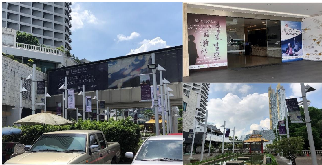
圖 6：展覽外部宣傳示意

完成昨日的虛擬實境數位展件佈建作業後，本日另需完成「神奇百駿」數位展件，而前往展場的道路上有發現泰國方有進行本展覽相關的外部宣傳文宣，像是在當地知名飯店及展覽所在的購物中心大樓間醒目的空橋側面張貼了清楚標註本院全銜載示的大型輸出海報，以及在購物中心門口的兩側也同樣張貼了相關展覽資訊的海報(詳圖 6)。