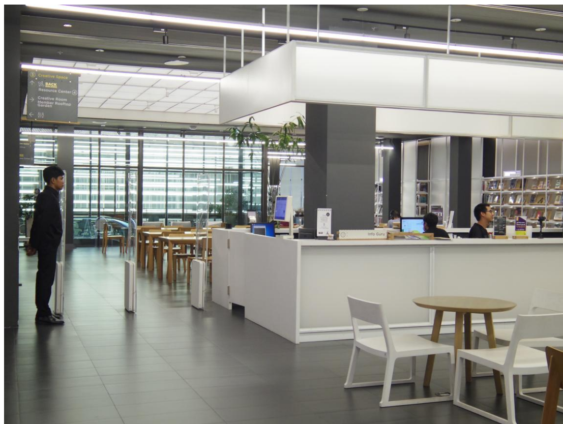
圖 28：泰國創意設計中心(TCDC)之專業設計圖書館

「公共學習」的理念，因此更著重於舉辦各式國際文化展演、藝文展覽、工作坊、講座活動、文創商業媒合等等，引領國內的創意思考與設計發展，促進文創與設計方面的國際交流，進而提升國內的文化經濟發展。 3 基於上述緣故，泰國創意設計中心內部規劃專業的創客空間、創意商業服務空間、設計圖書館、資料庫系統、展覽廳、咖啡廳、文創商店及屋頂觀景台等(詳圖 28)，提供製造文化活水的公共空間。