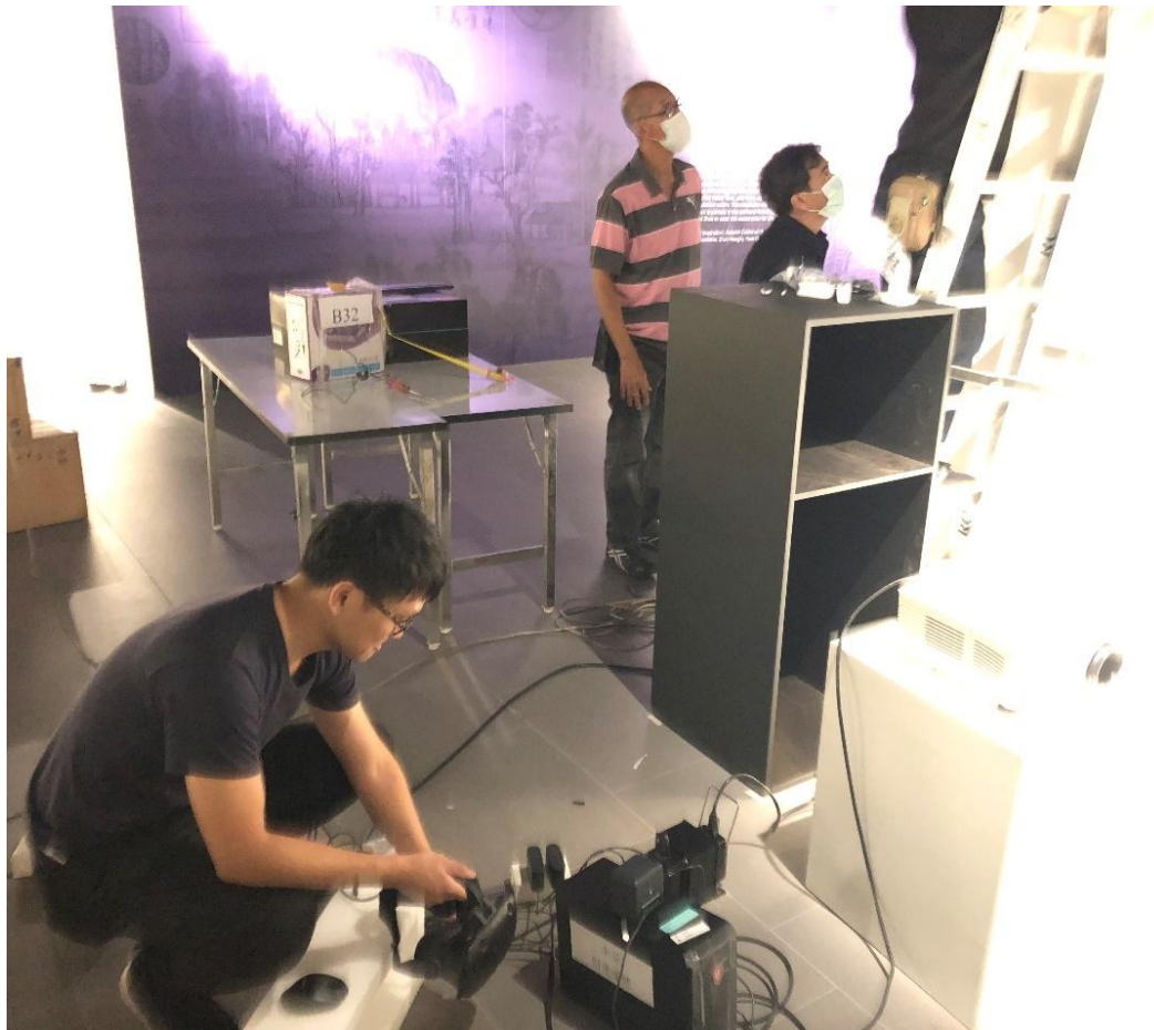
圖 4：教展處同仁佈建虛擬實境展件

及控制手把的校準，步驟繁多，惟經一番作業後順利的完成是日的目標將 4 台虛擬實境展件佈建完成，也讓現場好奇的泰國展場佈建人員先行試用(詳圖 5)，並普遍的獲得所有使用者高度滿意的評價，讓同仁感受到數位藝術文創結合產生的美的感受，是可以打破人種及語言隔閡的圍籬。