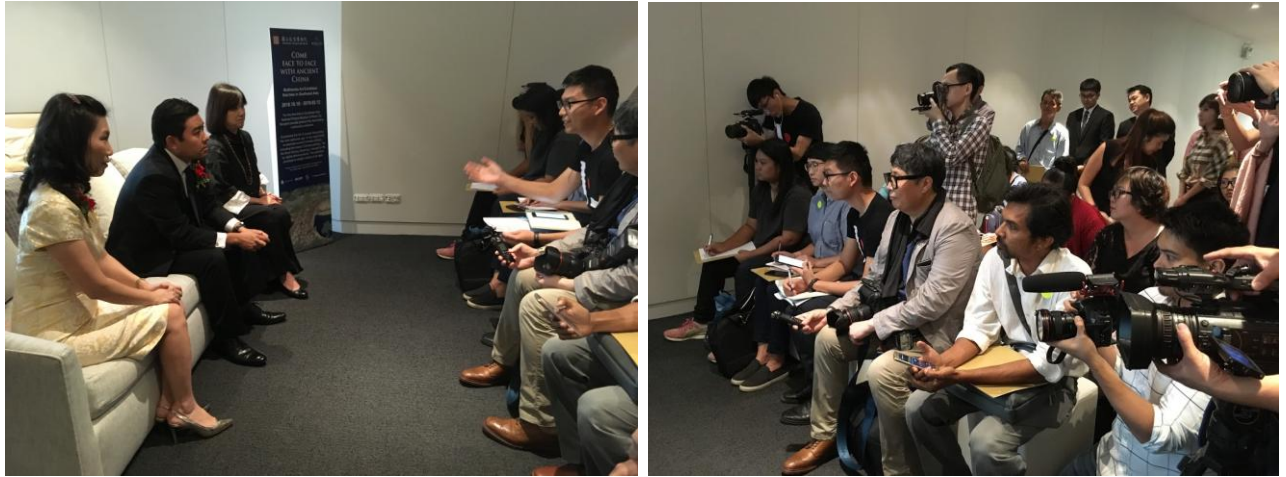
圖 18：「清明上河圖－故宮新媒體藝術展」媒體聯合採訪