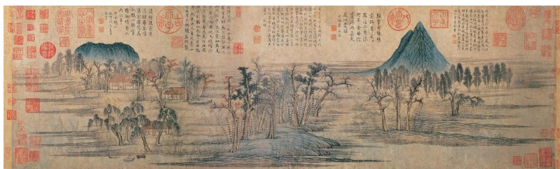
圖 3：元 趙孟頫〈鵲華秋色〉局部

在十月十四日當天先由本院一位教展處同仁先行抵達，因本次分工係由本院在國內就展覽場地先行繪製展覽平設圖，再由泰國方機構按圖索驥的施做木工電力，故在當天泰國方即已完成基本之木作施工，而教展處同仁當天需先進行「神遊幻境」虛擬實境展件及「神奇百駿」數位展件，首先是「神遊幻境」虛擬實境展件，此件是本院於 105 年製作之虛擬實境體驗展件，當時係以本院國寶級文物元趙孟頫〈鵲華秋色〉(詳圖 3)作為創作發想，該幅畫為趙孟頫於元貞元年(1295)從燕京仕官後南歸，為解摯友周密思鄉之愁所畫。周密是宋末元初著名文學家及鑑賞家，原籍濟南，惟出生於吳興，在杭州等地過著隱居不仕的生活，從未到過山東濟南，但對故鄉懷有濃厚的思戀，故趙孟頫以此畫來稍解周氏思鄉之懷。在製作虛擬實境展件時本院忠實的將畫中山水以 3D 立體方式呈現出來，像是描繪山東濟南附近的兩座名山—華不注山和鵲山，中間還有黃河江水縈迴，沼地上錯落著各式叢樹及屋舍等。