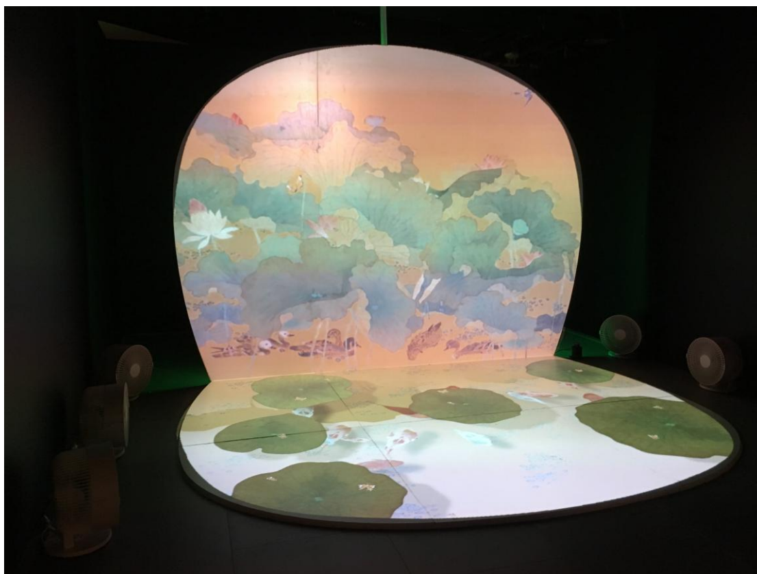
圖 12：「夏荷」體感互動裝置泰國現場布置

與海中的蝦蟹魚類互動，以感應棒觸動畫面裡的墨漬後，神秘的古代海洋生物就會顯現在眼前，讓民眾藉由本互動體驗裝置一窺古人眼中的海洋異想世界。