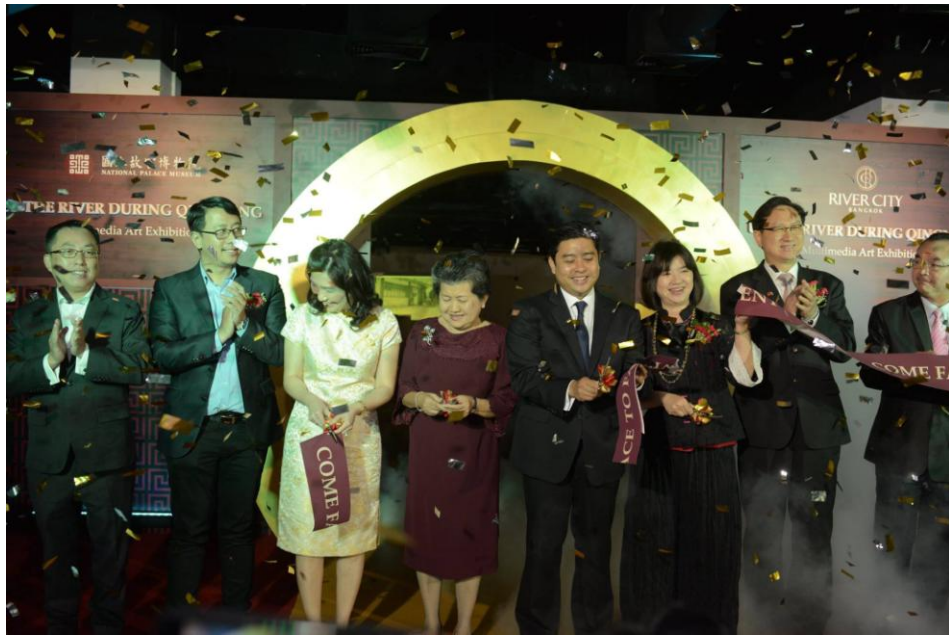
圖 23：開幕剪綵儀式