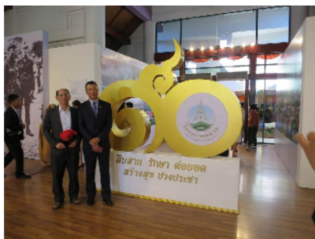
圖：本會福壽山(左)及清境農場場長(右)於會場留影