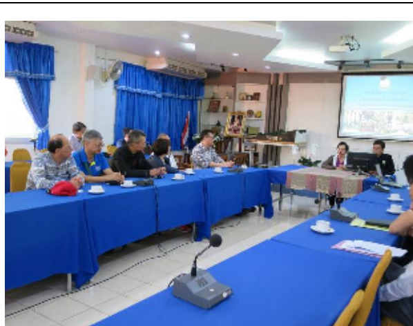
圖：本會代表團赴邦達農業工作站了解其與臺灣農業合作交流狀況

接續由基金會資深工作人員介紹近年該基金會與國合會合作計畫成果，介紹時提到目前推廣泰北地區農民所生產之溫帶蔬菜及高經濟果樹等農產品，因採取友善環境的栽培管理方式，田間病蟲害危害嚴重，因此與國合會協助發展生物農藥及果實蠅的病蟲害綜合管理防治(IPM)辦法。目前兩會正積極開發結球萵苣、高麗菜與蕃茄等蔬菜的適地生物防治技術，針對生物防治與化學防治之實驗室及田間實際狀況進行比較，並協助進行水果套袋技術。