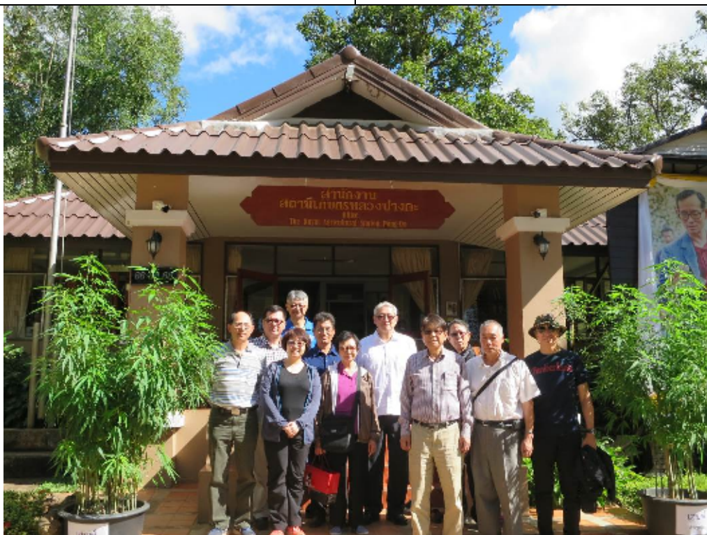
圖：本會代表團參訪皇家計畫基金會所屬邦達農業工作站並合影留念