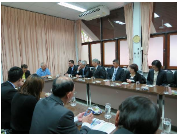
圖：皇家計畫展售會籌備會主席(右7)代表基金會向臺灣代表致歡迎之意

本會主任秘書感謝基金會邀請，並代表主任委員致意。希望基金會人員來我國武陵、福壽山及清境農場參訪外，另可以參考107年的模式，互派人員交流有關茶、果樹栽培。最後並預祝接下來四天的皇家計畫展售會圓滿成功。