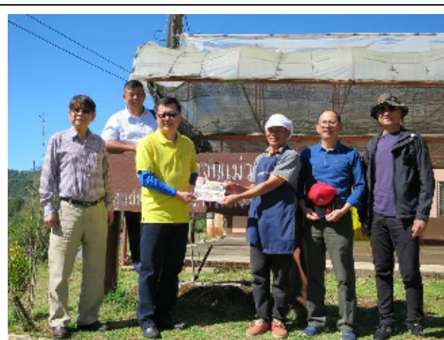
圖：本會主任秘書(左 3)致贈禮品予昆旺農業工作站茶廠負責人

12 月 21 日下午前往茵他儂(Inthanon)農業工作站，該工作站兼負引種、選(育)種、選苗等研究作業及推廣任務，其場區除生產作業區外，另規劃有產品販售店、餐廳、小木屋(現暫不開放)，以及皇家詩里本修花園(Royal Garden Siribhume)。