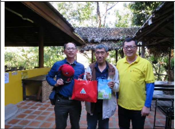
圖：本會主任秘書(右 1)及福壽山農場場長(左 1)致贈禮品予茵他儂農業工作站場(站)長(中)

12月23日本會代表團與財團法人國際合作發展基金會(下稱國合會)代表前往邦達(Pang Da)農業工作站，由站(場)長先說明該場主要農業發展(輔導)範圍及其主力研究推廣作物，如柑橘、雙色玉米(選種中)、甘薯、葡萄、百香果(台農 1 號，原皇家品種有受軟腐性影響，由國合會協助引整，目前基金會先以嫁接方式再進行選育種，但目前農民普遍還是比較喜歡台農 1 號)、藍莓、木瓜(有從臺灣引種來進行選種)、火焰百合、蘭花、麻、網室蔬菜、黃金果、楊桃、釋迦、芒果、酪梨、無花果、茶葉、奇異果、豆類(貫行及有機種子繁殖)、竹筍等。