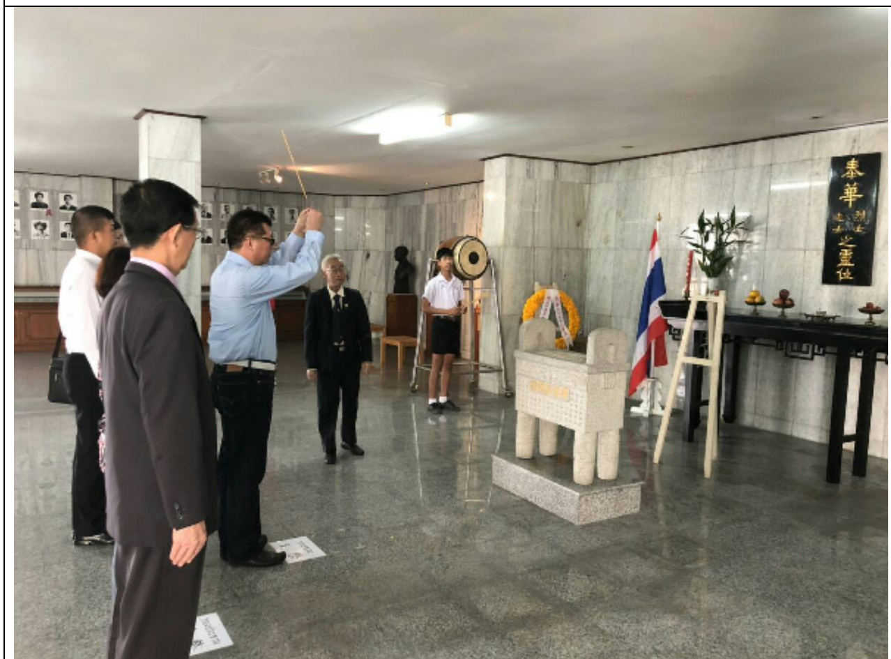
圖：主任秘書(中持香者)率駐泰武官暨代理事長向遺族致敬