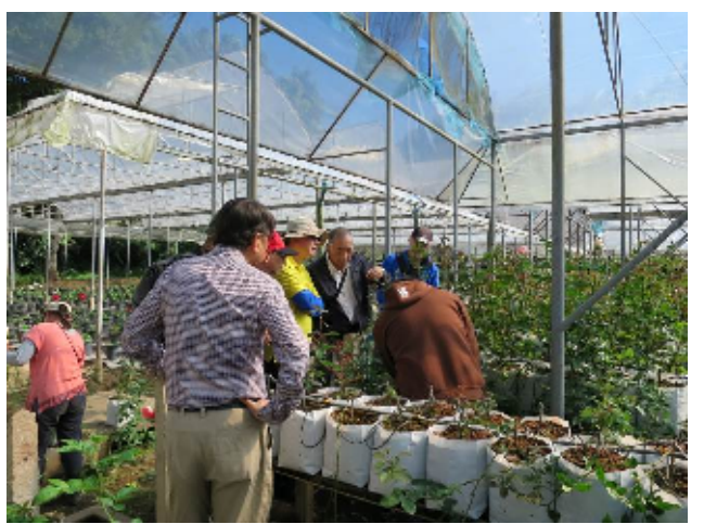
圖：本會代表團赴茵他儂農業工作站參觀其育苗場（溫室）