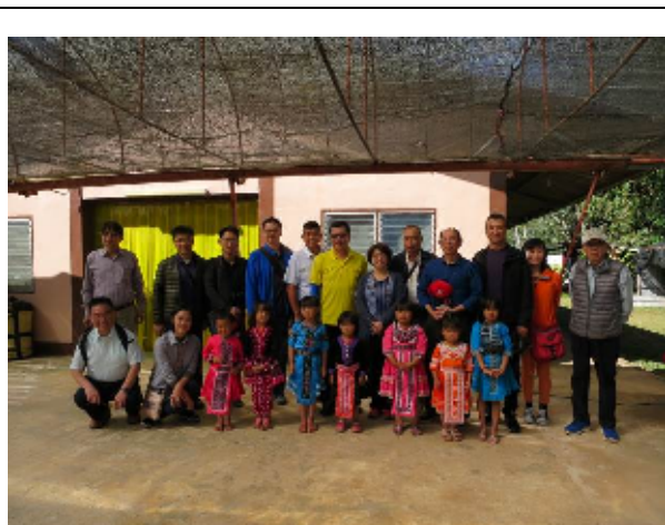
圖：本會代表團於昆旺農業工作站與當地住民小朋友合影

本會福壽山農場場長及武陵、清境產銷輔導組組長曾於 107 年 8-9 月參訪該工作站並給予茶園管理(加強水土保持、肥料調整及適當合理的茶葉修剪)及製茶(增加日光萎凋場的空間、汰舊更新老舊的製茶機械及改善茶葉加工室的空調設備)等指導建議。趁本次再訪，福壽山農場巫場長向主任秘書說明農業交流執行狀況。