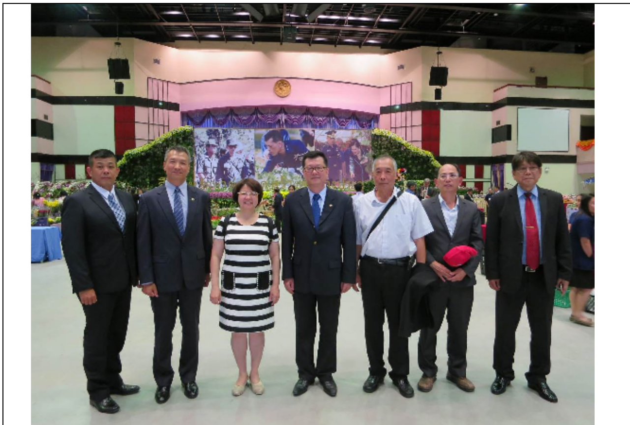
圖：本會代表團參加 2018 皇家計畫展售會並於會場合影留念

典禮後由籌備會主席及基金會主席、主任等人引導公主及賓客參觀會場內各農業研究站成果，包括各項農特產品(蔬果、花卉)與山地原住民手工藝品，其中由臺灣引進之百香果品種「台農 1 號」深受泰國當地農民喜愛亦於本次展場中展示。展覽於公主巡視完後即開放一般民眾參觀並現地販售農特產品，現場選購氣氛熱烈。