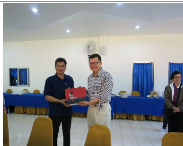
圖：本會主任秘書(右)致贈禮品予邦達農業工作站場(站)長(左)