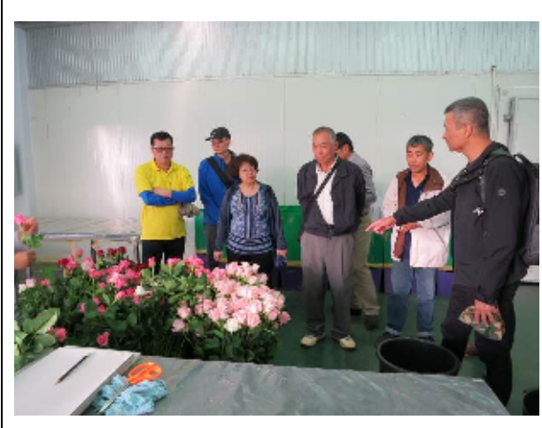
圖：本會代表團赴茵他儂農業工作站參觀其花卉分級包裝場

其主要目的是改善泰北地區農民生活，故其育苗作業上仍以人工作業為主，所育品種中不乏高單價之鮮食蔬菜，然對於此類高經濟價值產品，尚未通盤考量以外銷方式，以賺取更高額的利潤。