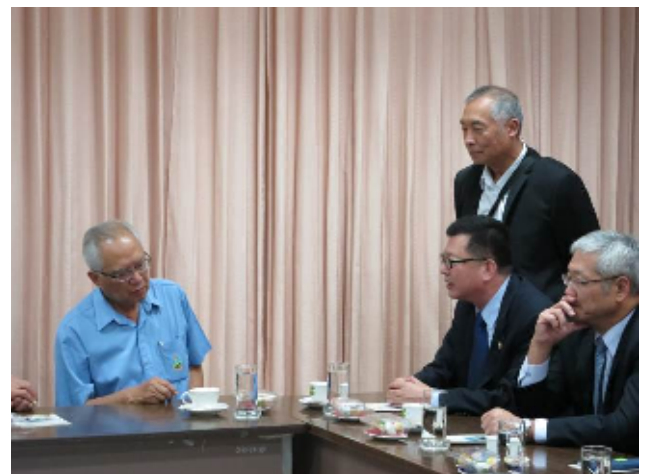
圖：本會主任秘書(右3坐者)向籌備會主席(左1)表達本會誠摯歡迎基金會成員來臺參訪