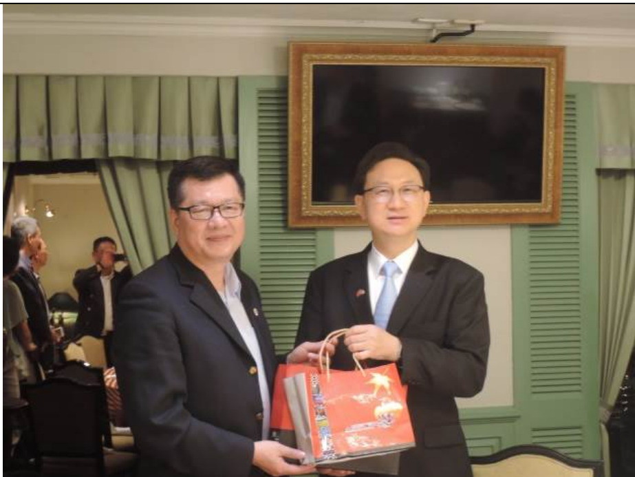
圖：本會主任秘書(左)致贈童代表(右)禮品彰顯情誼

後續童代表提到代表處將搬遷至新址，屆時會有一陳展空間可供本會農場展示農業或觀光發展成果或產品，另希望農場能配合泰國學校學制推出 4-5 月及 10 月學生方案，以吸引泰國學生能組團來臺。