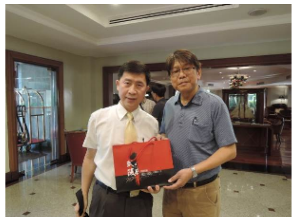
圖：本會武陵農場場長致贈禮品予交通部觀光局曼谷辦事處巫場長