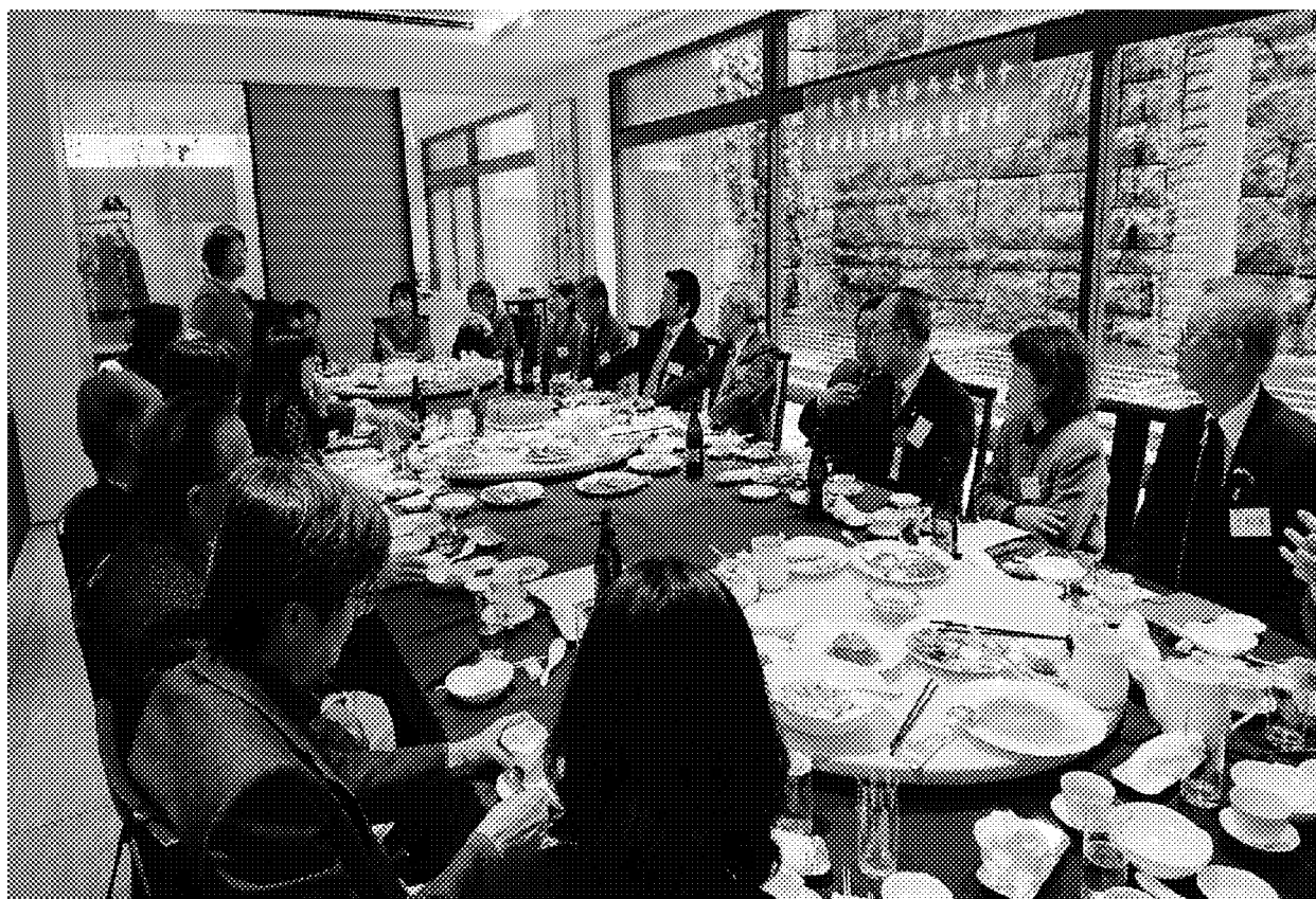
與僑會會長及幹部餐敘交流