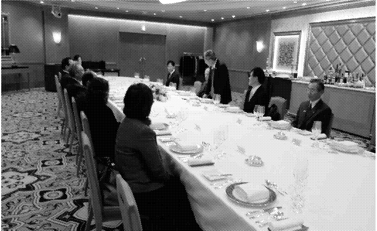
與僑會會長及幹部餐敘交流