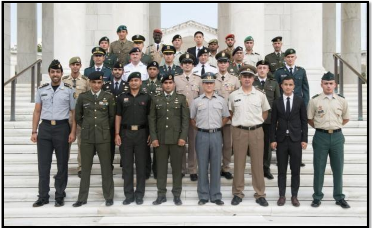
各國國際學生合影