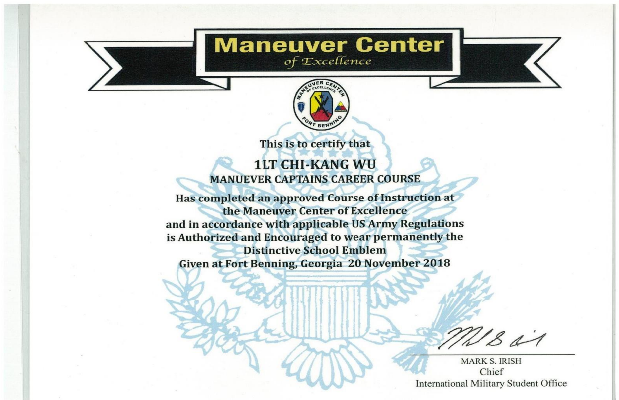
國際學生結業證書