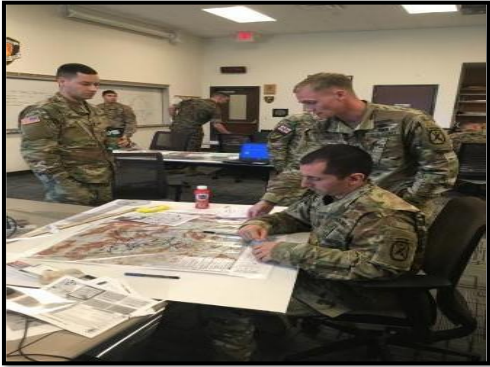
實施 IPB 討論