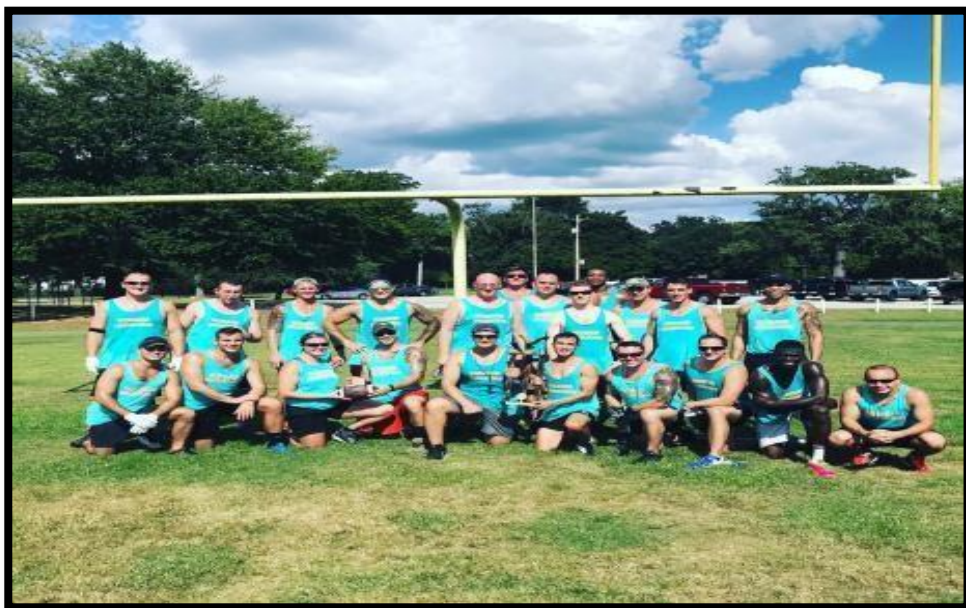
本班榮獲美式足球冠軍殊榮