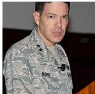
斯蒂芬奧利弗中將