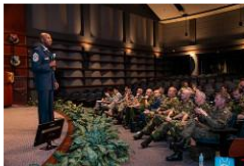
美空軍總士督一等長歐·賴特 (CMSAF KALETH O. WRIGHT)