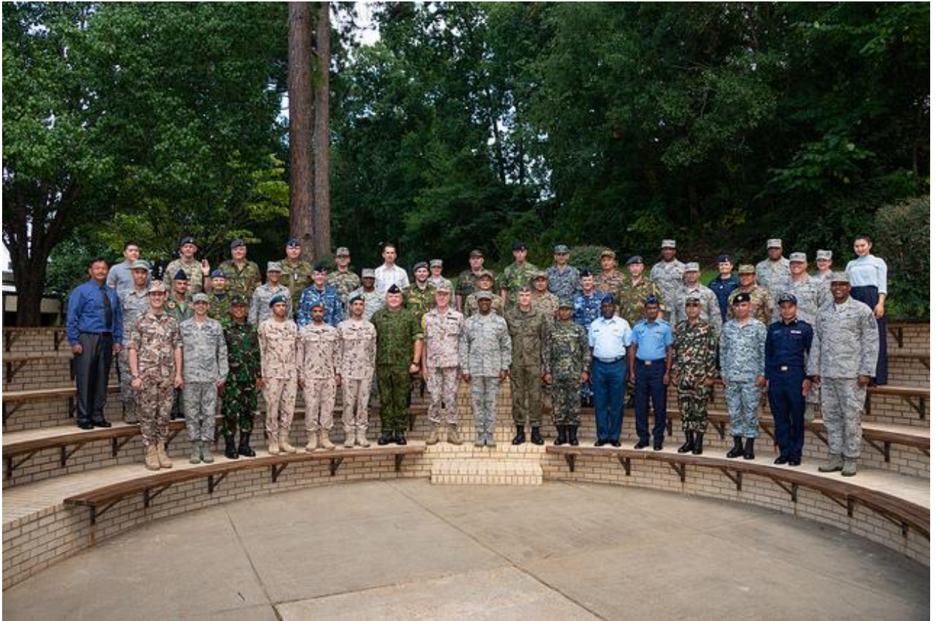
各國資深領導士官合照