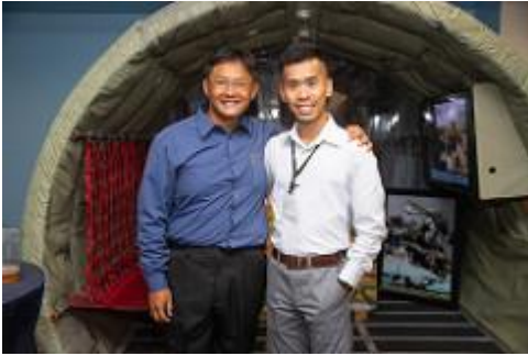
隨身接待員隋中士

四、本次座談會參加人員：32國資深士官40員代表出席、美方21員，共同參與此次高峰會。 (名單附件二)