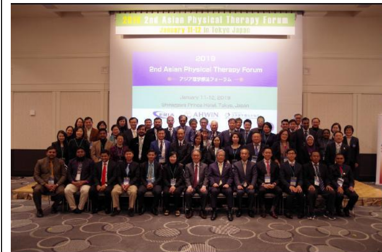
第二屆亞洲物理治療論壇 全體合影