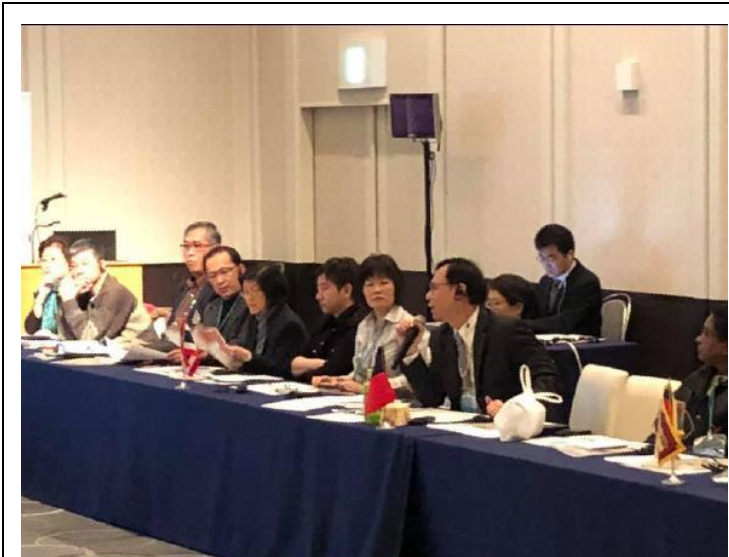
衛福部醫事司石崇良司長於 會議中發言