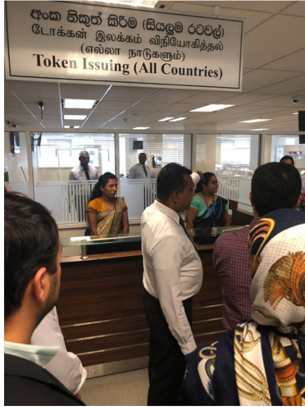
圖 11 核發號碼牌櫃檯