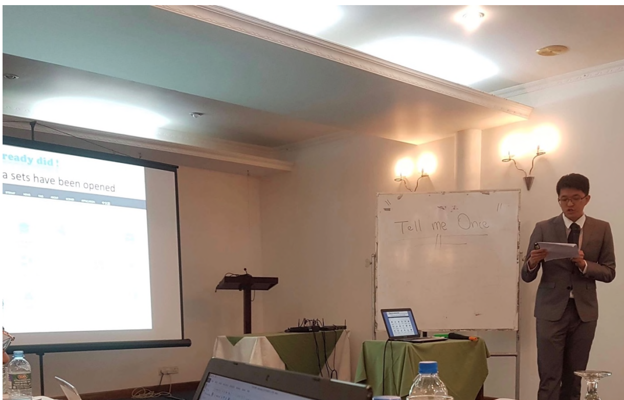
圖 7 我國代表進行專題報告