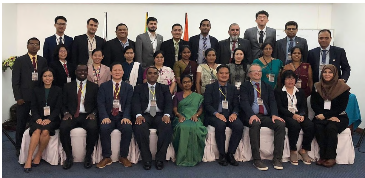
圖 1 開訓典禮全體學員合照

會議第一天由斯里蘭卡國家生產力秘書處會長 W.M.D Suranga Gunarathne 先生及斯里蘭卡公共行政管理與法務部秘書 P.G.D. Pradeepa Serasinghe 女士致歡迎詞，並進行斯里蘭卡傳統開幕儀式。