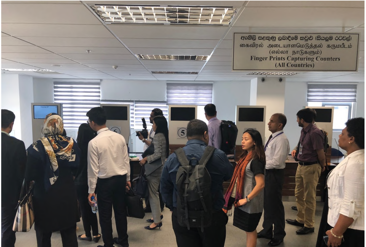
圖 12 捺印指紋櫃檯