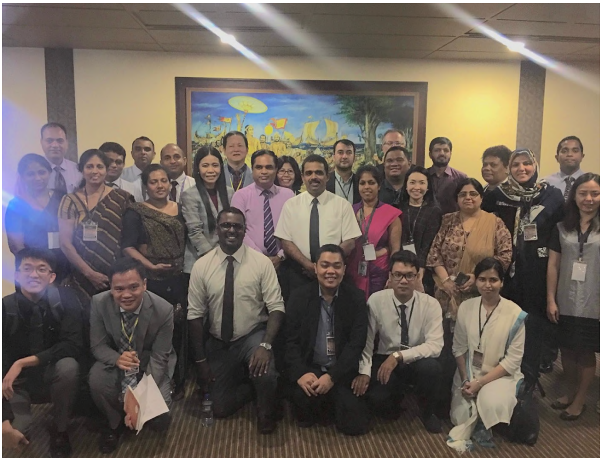
圖 10 各國代表與移民署署長合影

(2) 斯里蘭卡移民署為了解決過去民眾因申辦業務必須大排長龍的問題，導入資訊系統及流程改造以解決排隊的問題，民眾到移民署申辦業務，先抽取號碼牌之後，即可依照申辦業務的不同類型去辦理相關業務，例如：按捺指紋、繳費。同時電腦螢幕亦可即時顯示目前等候人數及人員等資訊。