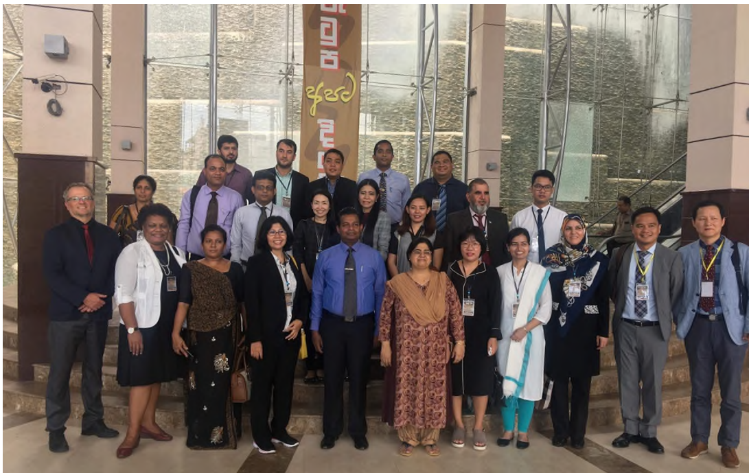
圖 9 各國代表於海關合影