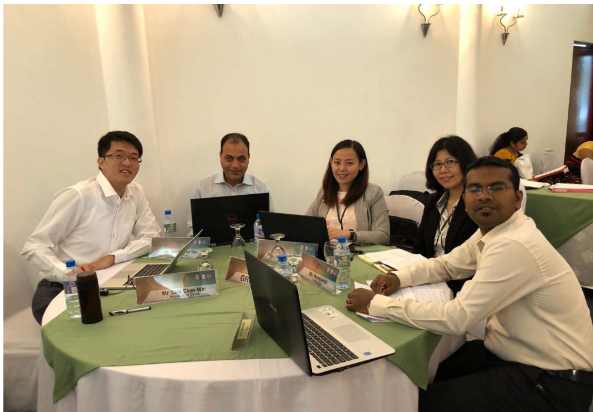
圖 13 小組討論

9月21日上午由各小組針對前4日之學習內容進行討論，並由各組發表心得感想，下午並由個人發表個人心得與建議，最後，由斯里蘭卡國家生產力秘書處會長 W.M.D Suranga Gunarathne 先生致詞，並頒發結訓證書。