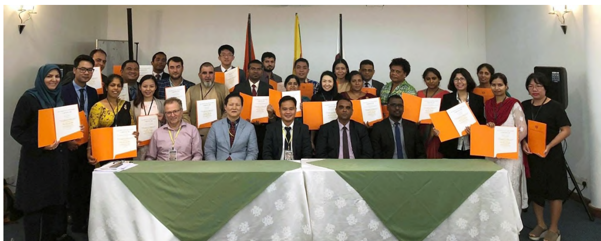
圖 14 各國代表領取結訓證書後合影