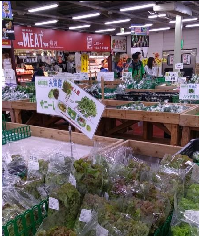
圖三、うまんちゅ市場農産品上架販售情形。