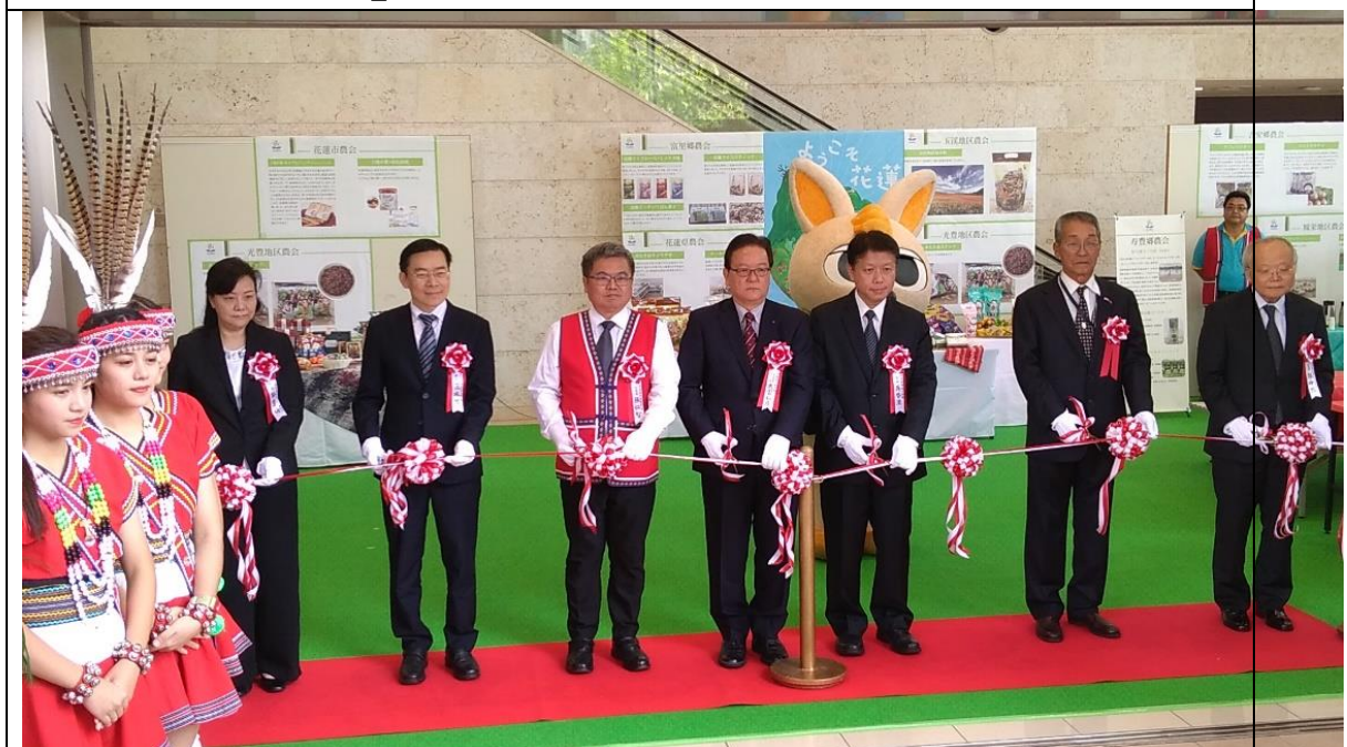
圖八、「與美麗寶島的邂逅『臺灣特展』2018 in 沖繩」-花蓮物產展」開幕剪綵儀式。