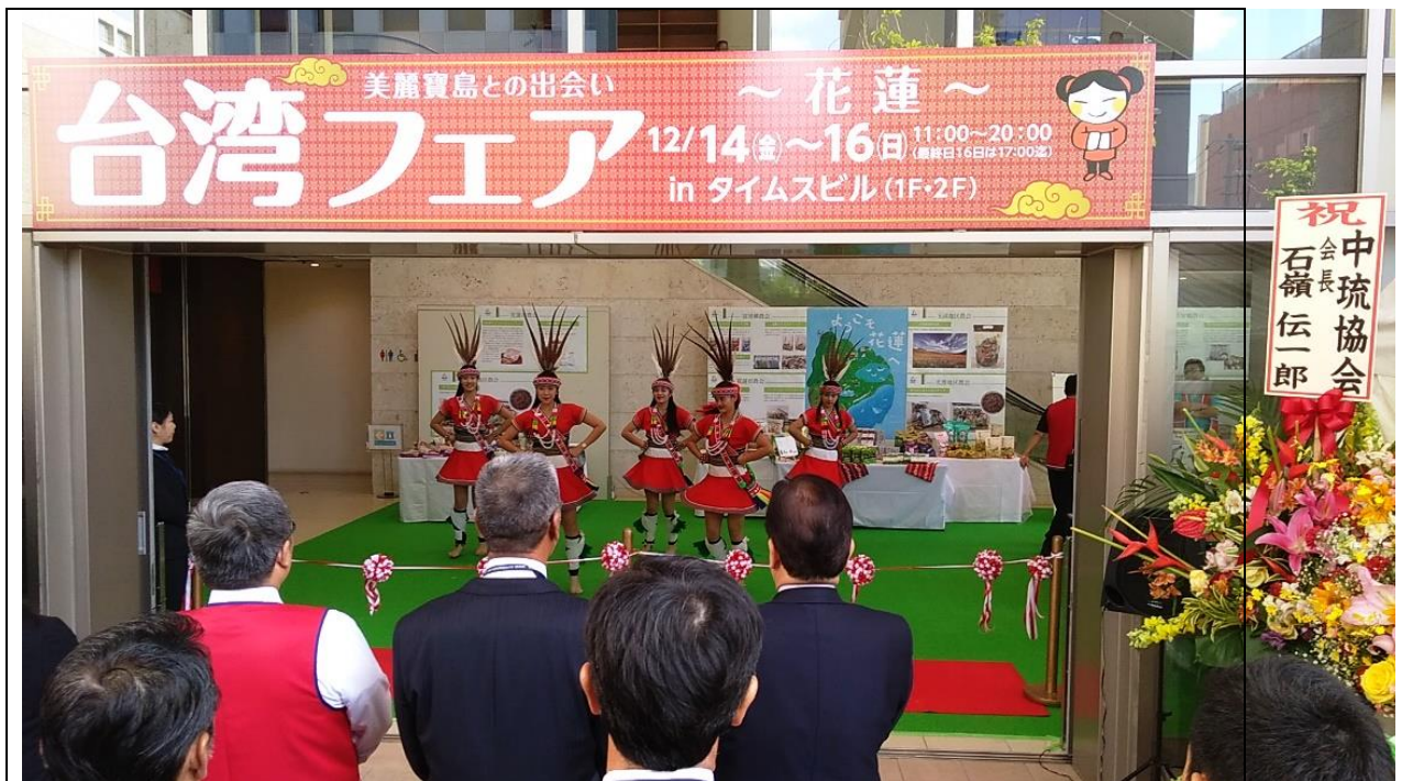
圖七、「與美麗寶島的邂逅『臺灣特展』2018 in 沖繩」-花蓮物產展」暖場活動。