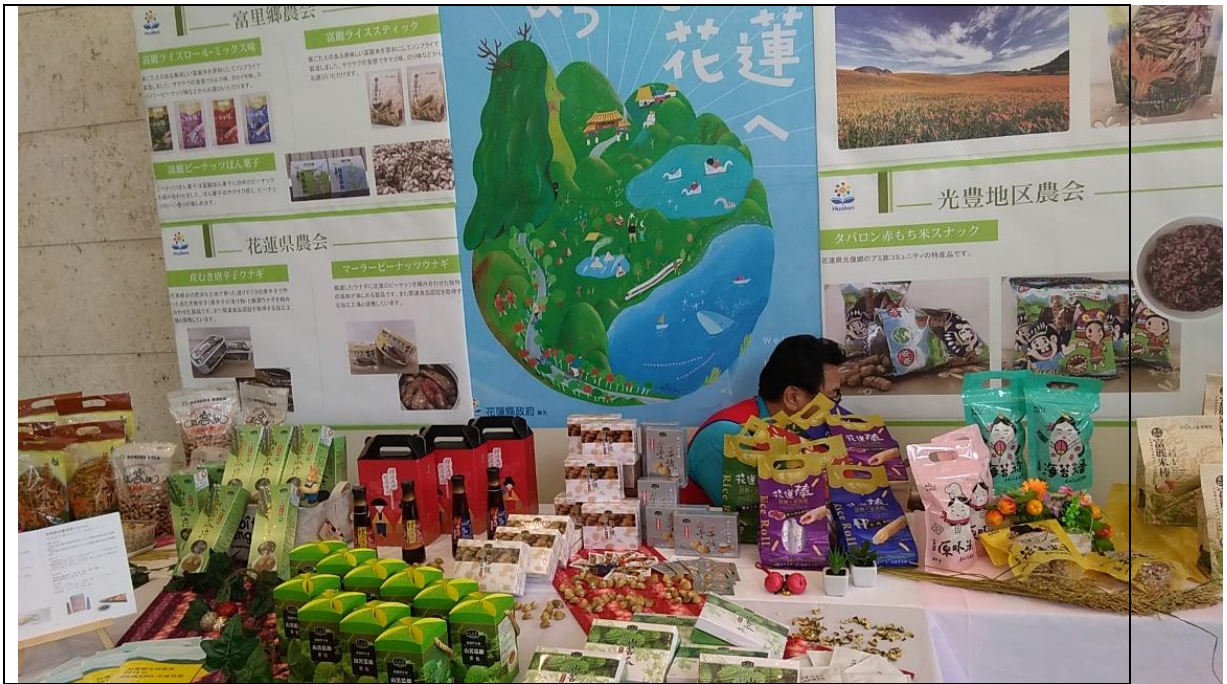
圖九、「與美麗寶島的邂逅『臺灣特展』2018 in 沖繩」-花蓮物產展」現場陳列花蓮縣農特產品。