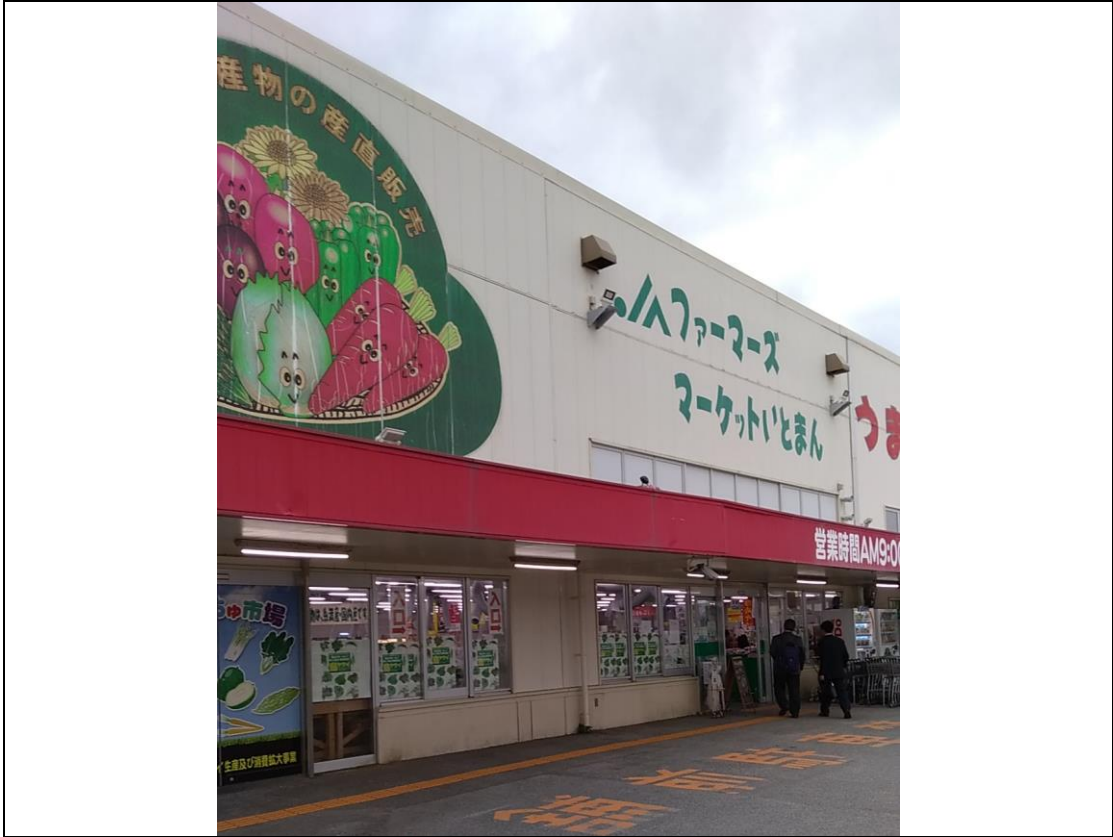
圖二、沖繩縣糸満市 うまんちゅ市場建築外觀。