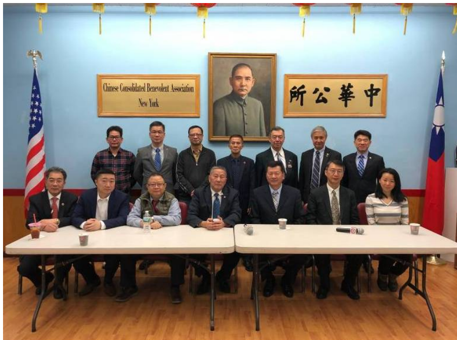
主任秘書(前排右3)拜會紐約中華公所，該所伍主席(前排右4)表示認同國父孫中山先生理念，永遠支持中華民國