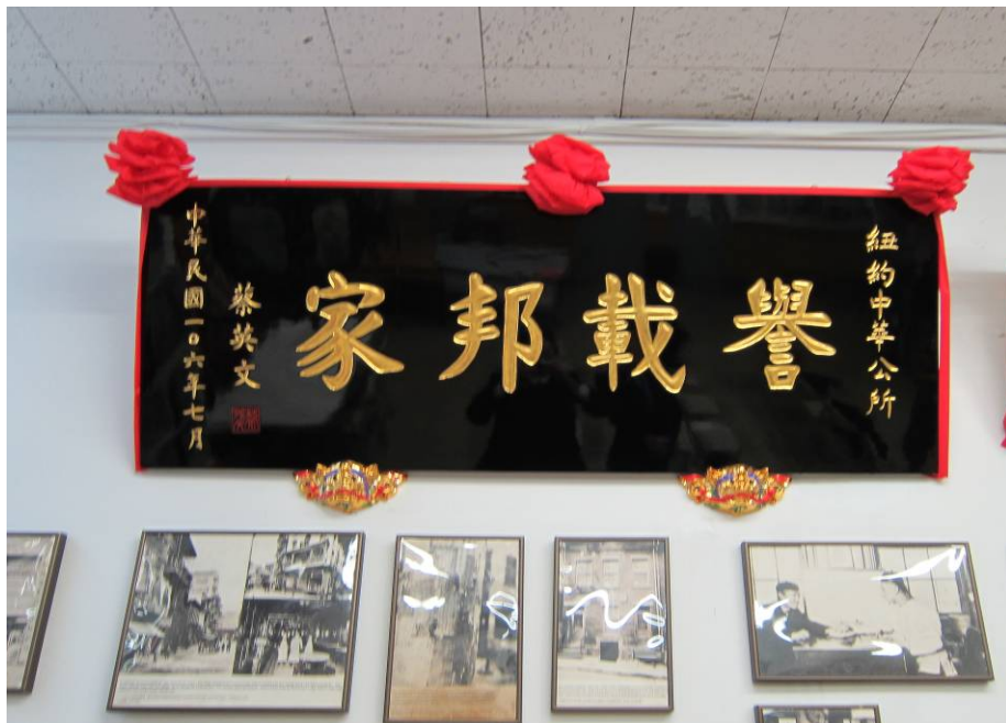
蔡總統頒贈紐約中華公所「譽載邦家」扁額一座，勉勵公所廣續為華人子弟謀福，為中華文化盡力。