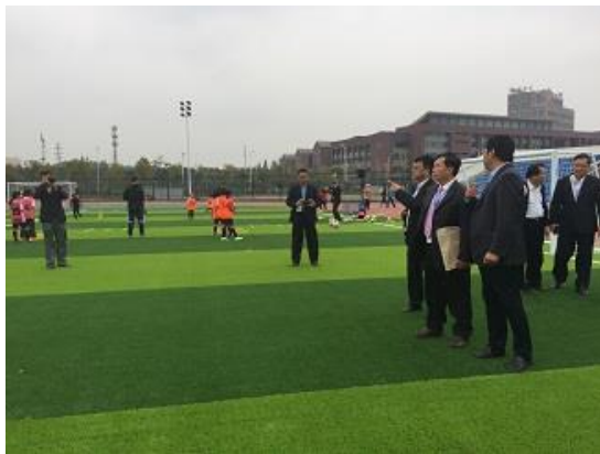
參觀江陰二中女足隊練習

江陰二中在教育局中被定位為一個體育藝術發展特色學校，尤其時女子足球隊的培養，學校有一個400公尺標準的田徑運動場，鋪上人工草皮，平時學生的體育課及足球隊的訓練都在田徑場上進行。學校為完全中學，為延續女子足球隊的選手來源，持續招收國中部2個女足特長班。江陰二中女足隊自1999年成為無錫市市隊校辦，目前江陰二中的女足隊註冊隊員為80人，其中國中23人、高中27人，另與城中及要塞小學共建培養小學生30人，帶隊體育教師(教練)共5人。近年來女足隊獲得了省長盃高中組冠軍，國中組亞軍、2016年全國國中女子足球聯賽冠軍、最佳教練、最佳射手及最佳球員；並於2005年及2007年世界中學生足球錦標賽獲得女子組的亞軍及冠軍。