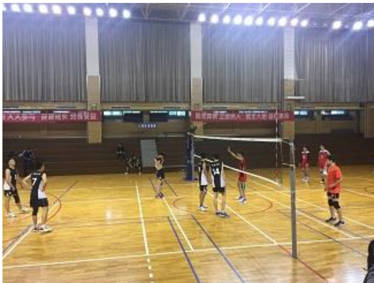
南京一中 V.S. 東南大學排球友誼賽

南京一中目前的專業運動團隊有男子排球隊及健美操隊，男子排球隊為目前全國前三的排球隊，選手的來源主要是特長生，教練也是由江蘇省省隊的教練來擔任。排球隊的成績近年拿過 1 次全國第一，3 次全國第二，2012 年到法國參加世界中學生排球錦標賽拿到男子組第三名。