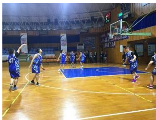
金陵中學女籃隊訓練