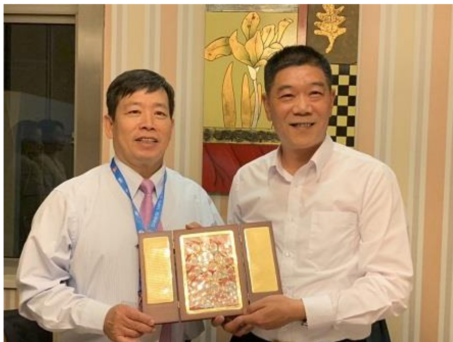
朱廳長致贈團長紀念品