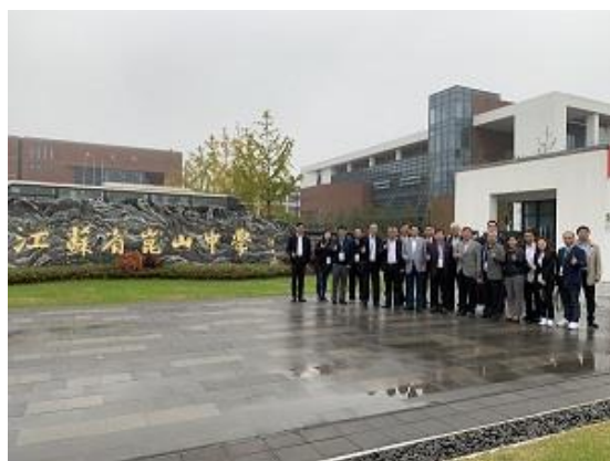
崑山中學校門前合影

目前國家的政策理念也是希望學校提供學生“適合的教育”，但每個學校的計畫跟每個學校的做法都不一樣，每個學校注重的重點不一樣，大陸學校的層次是很分明的，招生是依一個批次一個批次區分的，因此每個學校必須以學生程度提供學生所需要的學習。