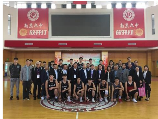
與南京九中男籃隊合影