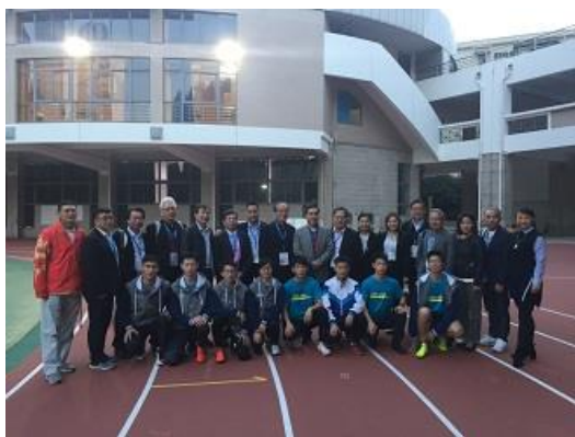
與金陵中學田徑隊合影

學校今年特地為學生選擇體育課做了一套選課系統，學生可以依據運動項目的喜好填選志願，然後由電腦做分配，學校通常鼓勵學生 3 年之中選擇 2-3 個項目，但也有很多學生從第一年到第三年都選擇同一個運動項目。