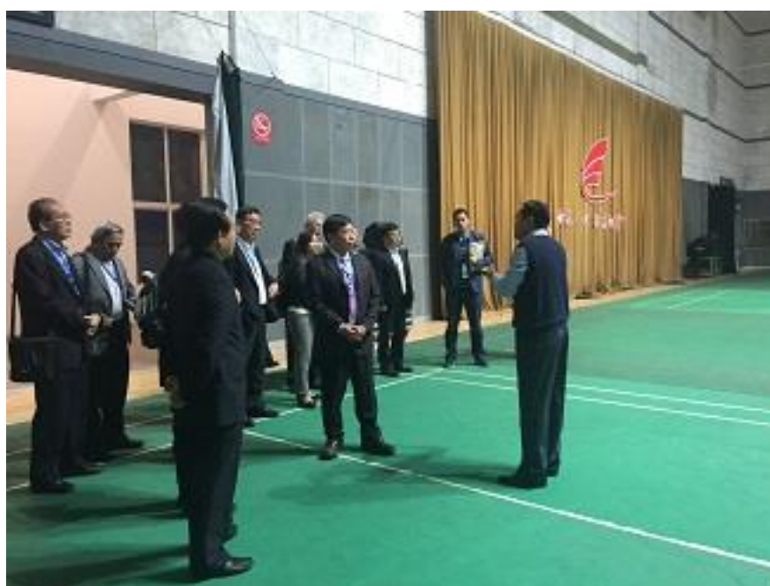
參觀江陰高中體育館

學校在學生體育與健康的課程安排上，自 2005 年開始採用選項教學，目前學校有開設足球、武術、健美操及游泳…等課程。2008 年學校被正式列為“江蘇省武術傳統學校”；2011 年學校成為江蘇省青少年足球隊訓練基地及江蘇省培養足球後備人才重點學校，2011 年 12 月，國家體育總局授牌江陰高中“青少年體育俱樂部”。江蘇省 U17 男子足球隊自 2011 年 3 月開始駐訓校至今，先後取得了聯賽冠軍、足協盃季軍、冠軍、亞軍等歷史性突破，創造了一系列“江蘇記錄”。2014 年 8 月，代表江蘇省參加第 12 屆全國學生運動會，“教體融合，省隊校辦”工作有聲有色，2016 年，江陰高中足球隊又提前一輪奪得了 2016 年全國男子足球 U17 聯賽的冠軍，為“江蘇足球記錄”又增添了濃墨重彩的一筆。高考成績逐年攀升，錄取清華、北大、復旦、南大、人大等重點大學的人數也有提升。