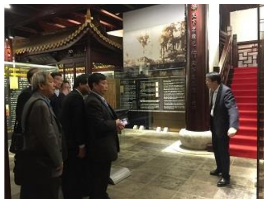
參觀蘇州中學校史館