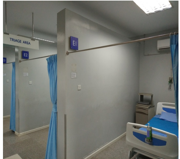
▲急診檢傷採獨立間設計，顧及病患隱私