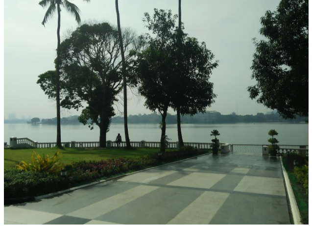
▲Kan Thar Yar International Specialist Hospital (坎塔爾亞爾國際專科醫院)面茵雅湖畔