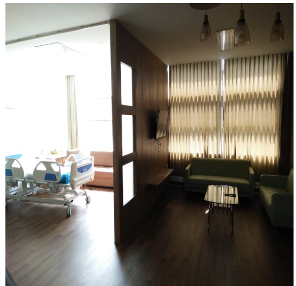
▲單人病房，每日 100 美金