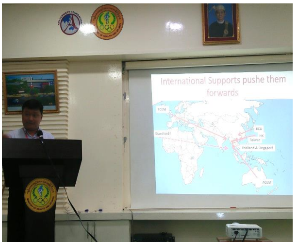
▲國際間支援緬甸包括台灣