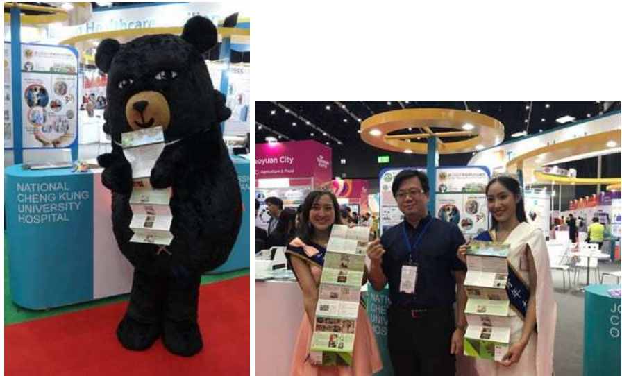
圖十七：台灣觀光代言人喔熊（Oh Bear）及台灣-泰國青年大使均協助宣傳台灣觀光醫療