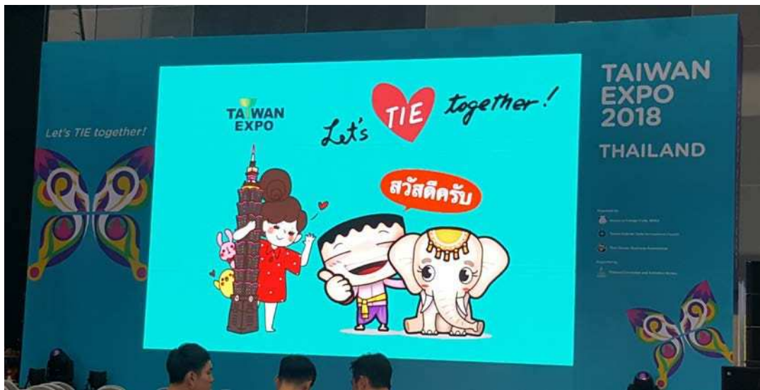
圖五：台泰知名插畫家「我是馬克」及「Trai」繪製本次台灣形象展插畫及本次台灣形象展 SLOGAN：Let s TIE Together