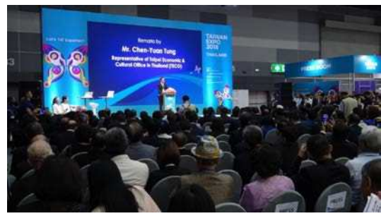
圖七：出席貴賓-駐泰國台北經濟文化辦事處 (Taipei Economic & Culture Office in Thailand) 大使童振源