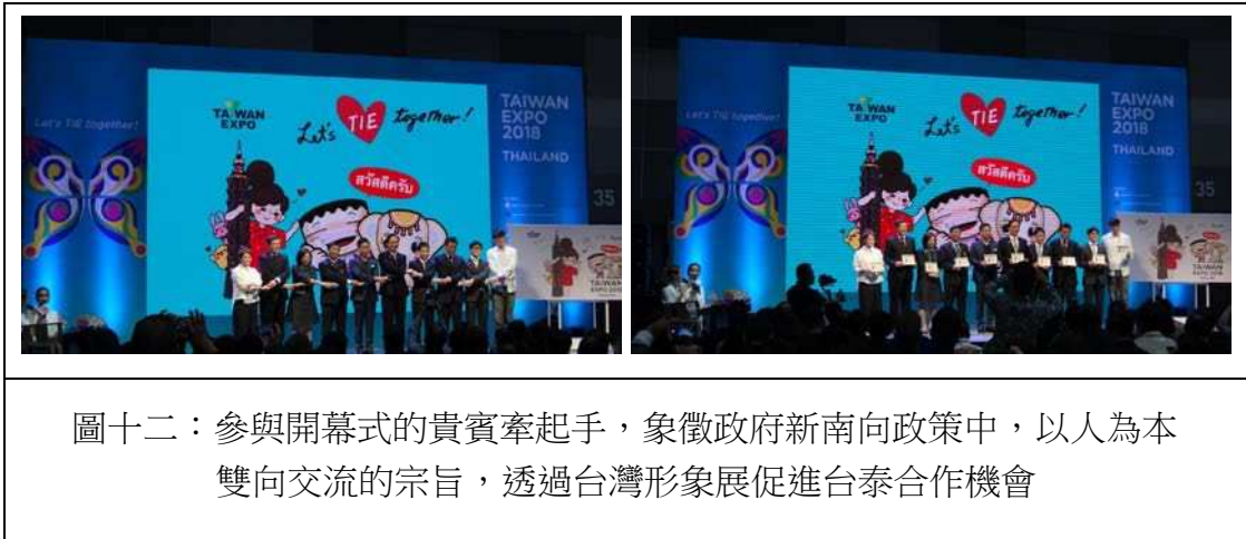
圖十二：參與開幕式的貴賓牽起手，象徵政府新南向政策中，以人為本雙向交流的宗旨，透過台灣形象展促進台泰合作機會