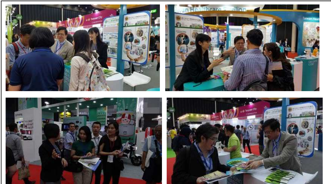
圖二十：民眾靠櫃詢問

由於泰國政府致力連結其醫療服務業及觀光業，又因其高品質的醫療水準、相較於歐美國家而言低廉的收費、舒適的就醫環境及即時而完善的服務等因素，每年吸引超過 250 萬名國際醫療觀光客。根據統計，醫療旅遊約占泰國國內生產總值（Gross Domestic Product, GDP）的 0.4%。此外，泰國獲得國際醫院評鑑（Joint Commission International, JCI）的醫院數量亦居於東協國家之冠。國際旅客赴泰國最常使用的醫療服務包括健康檢查、近視雷射矯正、整形或醫學美容等，因此一般民眾對於來台從事健康檢查及醫學美容的需求較低。這三天的展覽一般民眾靠櫃詢問，以疾病（癌症）治療需求為最多。本院為國家級癌症中心，設有包括乳癌、婦癌、頭頸癌、胸腔腫瘤暨食道癌、肝癌、大腸直腸癌、上消化道癌、泌尿道癌、血液癌症、內分泌癌及兒癌團隊與安寧照護團隊，以各癌症照護團隊為主軸，結合本院多專科整合門診、門診化療、臨床試驗相關訊息及資源、個案管理師照護、癌症資源中心（營養諮詢、社工心理支持）及癌症病友團體，提供全方位的醫療服務及資源連結，達到最有效率的治療方式，也是提高存活率及生活品質的最佳治療模式。未來可將「癌症治療」列為本院亮點項目。