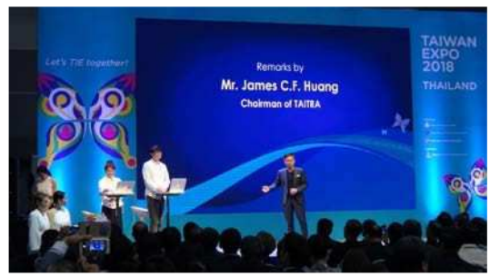
圖十一：出席貴賓-外貿協會 (Taiwan External Trade Development Council, TAITRA) 董事長黃志芳