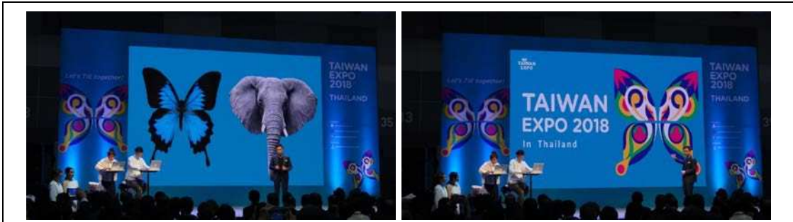
圖四：結合泰國聖物大象及台灣蝴蝶王國的意念，設計出泰國台灣形象展的主視覺圖示