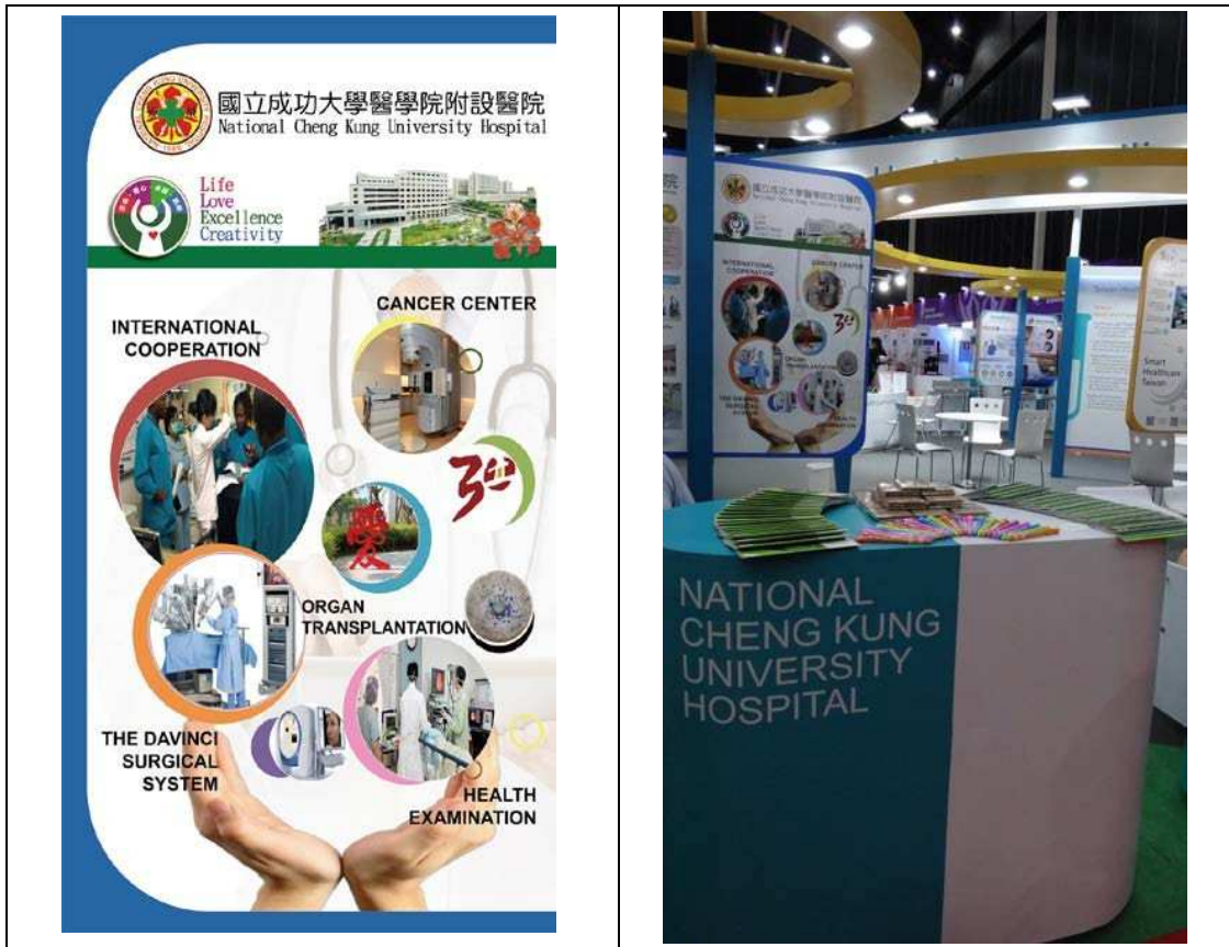
圖十五：成大醫院宣傳之醫療強項：國際合作、癌症中心、器官移植、達文西手術系統及健康檢查