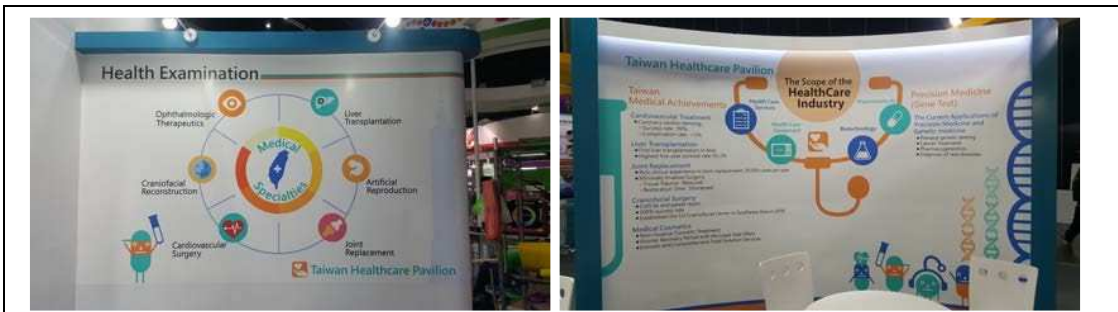
圖十三：健康形象館背板，宣傳台灣醫療強項（眼科治療、顱顏重建、心血管疾病介入、關節置換、人工生殖及換肝等）及醫療成就。