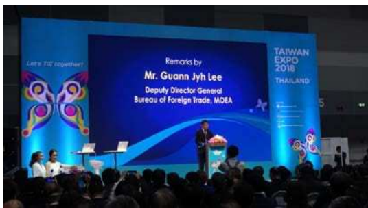
圖八：出席貴賓-經濟部國際貿易局 (General Bureau of Foreign Trade, MOEA) 副局長李冠志