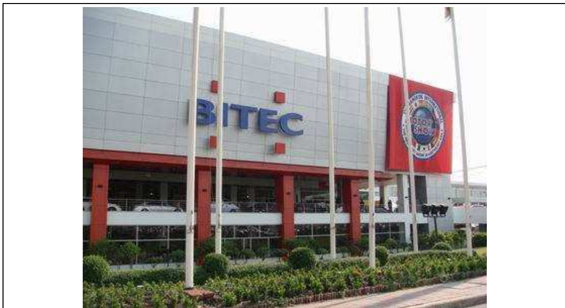
圖一：泰國曼谷國際貿易展覽中心 (Bangkok International Trade and Exhibition Centre, BITEC)

(二) 地點：泰國曼谷國際貿易展覽中心 (Bangkok International Trade and Exhibition Centre)