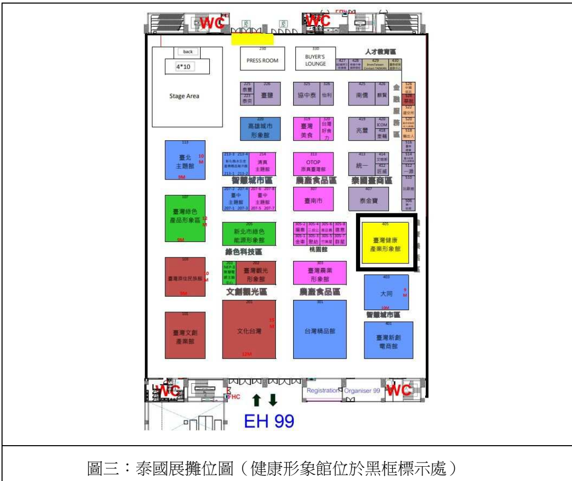
圖三：泰國展攤位圖（健康形象館位於黑框標示處）

(三) 展覽規模：共計 8 大主題區（文創觀光區、智慧城市區、綠色科技區、農產食品區、金融投資區、人才教育區、健康樂活區及泰國台商區），總計 210 個參展單位，以「Let's TIE Together」為 slogan，多元呈現台灣面向。