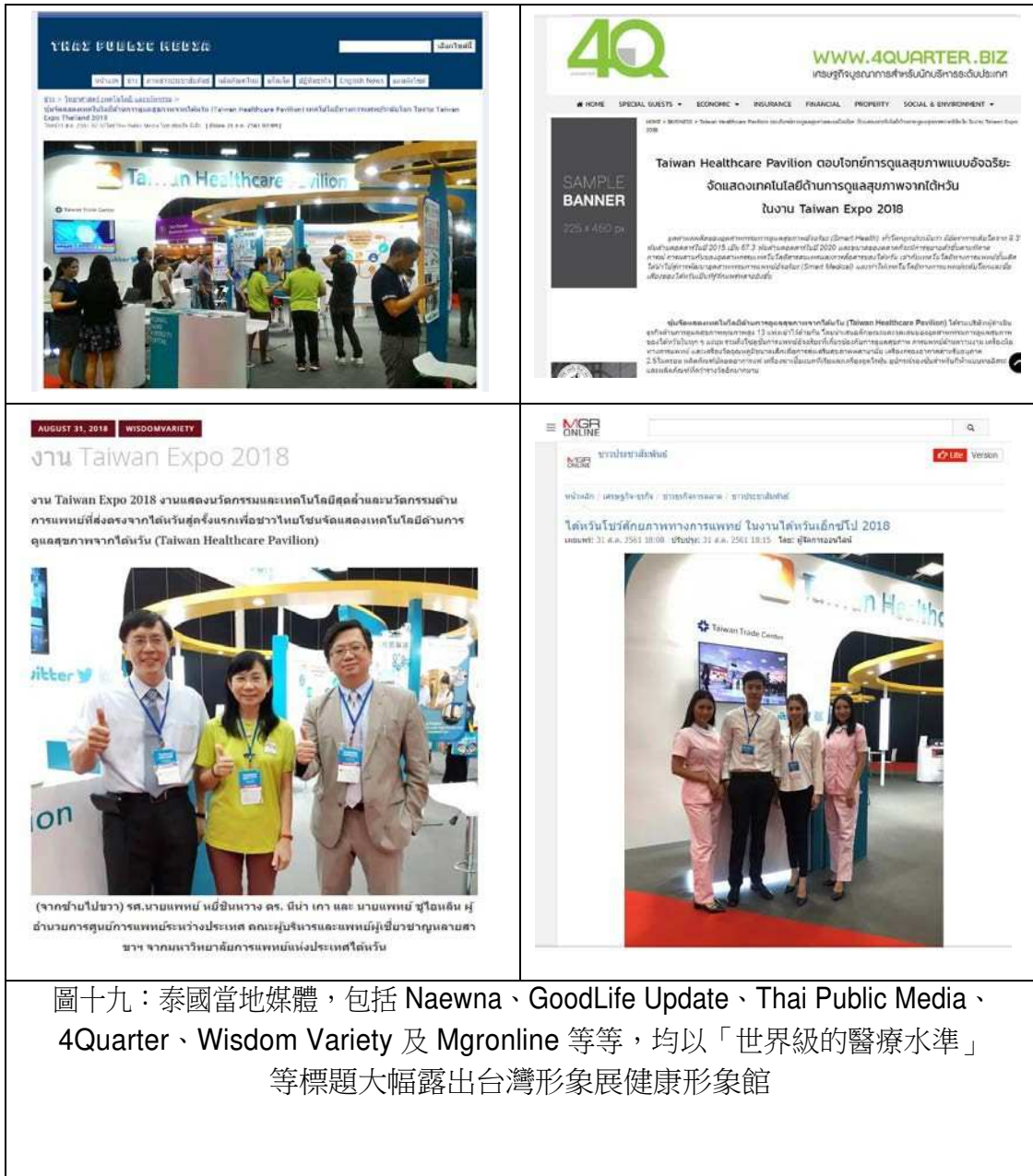
圖十九：泰國當地媒體，包括 Naewna、GoodLife Update、Thai Public Media、4Quarter、Wisdom Variety 及 Mgronline 等等，均以「世界級的醫療水準」等標題大幅露出台灣形象展健康形象館