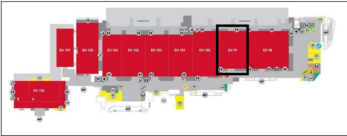
圖二：展覽廳平面圖（本次展覽廳為 EX99，黑框標示處）

(三) 展覽規模：共計 8 大主題區（文創觀光區、智慧城市區、綠色科技區、農產食品區、金融投資區、人才教育區、健康樂活區及泰國台商區），總計 210 個參展單位，以「Let's TIE Together」為 slogan，多元呈現台灣面向。