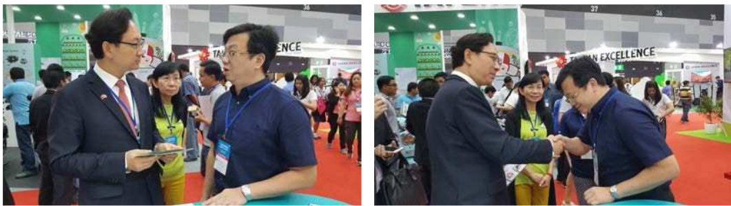
圖十八：駐泰國台北經濟文化辦事處大使童振源博士亦特地前往本館，希望連結起我國醫療機構與泰國醫學院、醫院及醫療業者的交流及合作