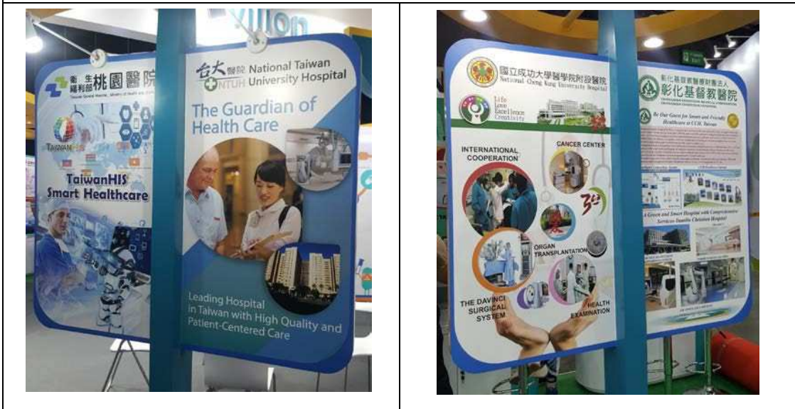
圖十四：參展之醫療院所（臺大醫院、桃園醫院、彰基及成大醫院）