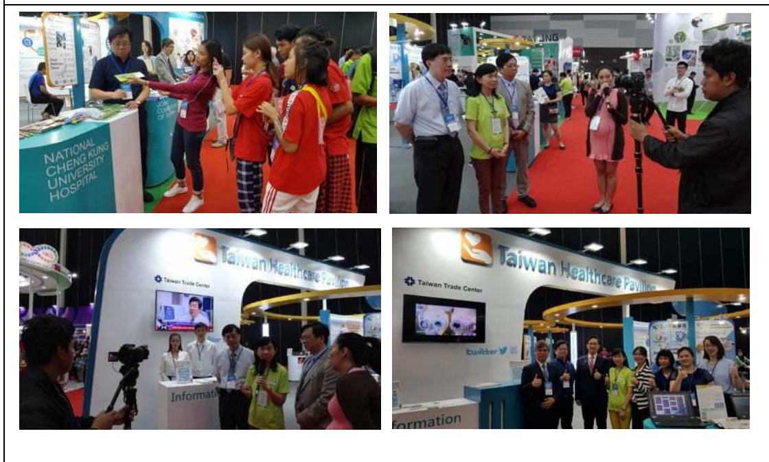
圖十六：包括當地學生團體及媒體記者等均熱烈採訪