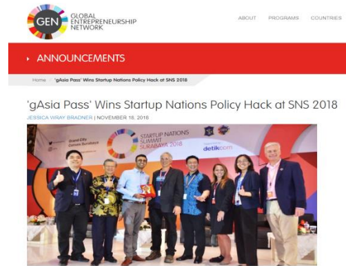
圖說：GEN 官網專文報導本倡議獲獎