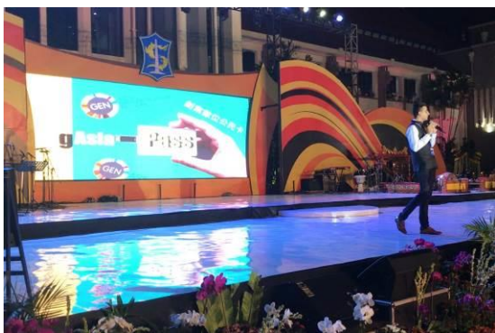
Yatin 於政策黑客松決賽上說明 gAsia Pass 概念並展示視覺設計