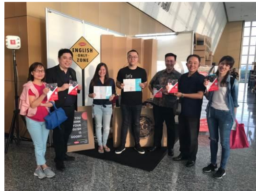
右圖：我團成員與大會周邊新創展示攤位交流