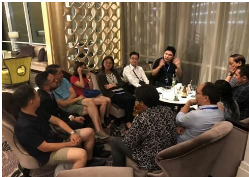
左圖：gAisa Pass 討論過程

的關鍵。會中討論方向主要可分為三點：(1)亞太國家政府在 gAsia Pass 計畫的參與範疇及效益；(2)非 GEN Asia 國家代表(如歐洲、拉丁美洲等)如何與連結 gAsia Pass 計畫；(3)各國民間單位如何加入 gAsia Pass 計畫。會議重點在於傾聽各方的意見，並建立未來合作的可能機會。會後並決議運用 WhatsApp，成立 gAsia Pass 討論群組，邀請在場各國代表加入，作為未來及時發布最新資訊及持續交流管道。