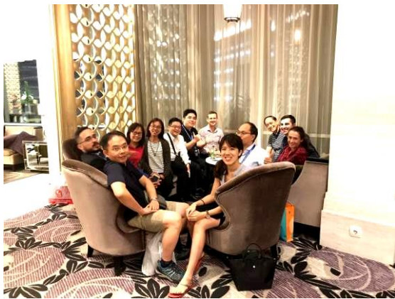
gAsia Pass 討論會我團代表與各國代表合影