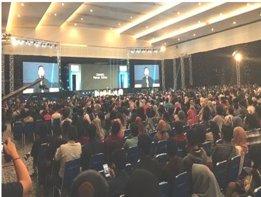
左圖：2018 創新創意科技節大會現場