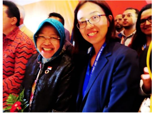
胡貝蒂副處長於大會開幕式與泗水市長 Mayor Risma 合影留念