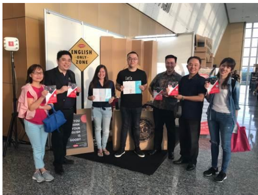
我團代表與創新創意科技節新創團隊 CONVO 交換林口新創園及線上英文學伴資料