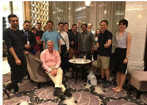
右圖：gAisa Pass 討論合影