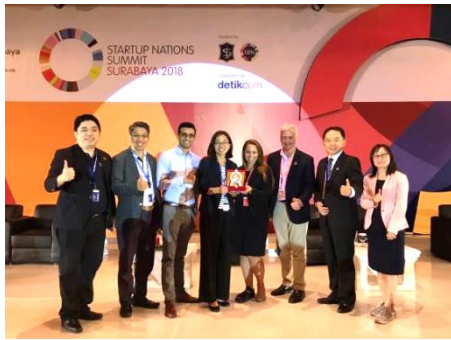
圖說：獲獎後我代表團與 GEN 總部合影