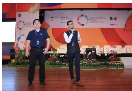
圖說：政策黑客松初賽競賽過程