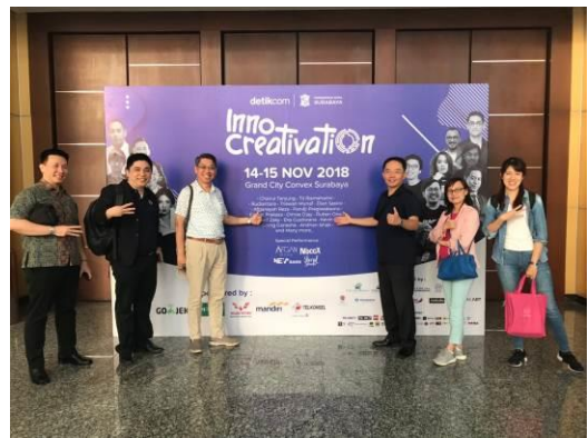
我團代表於創新創意科技節看板前合影