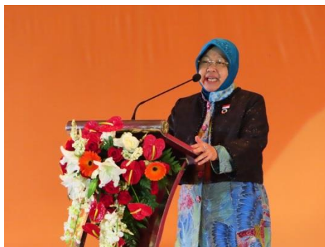
左圖：泗水市長 Tri Rismaharini 開幕致詞