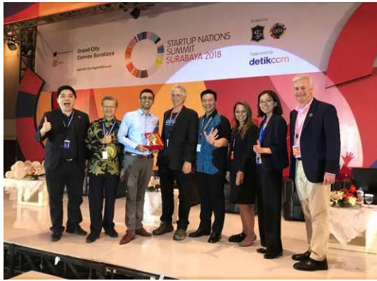
gAsia Pass 團隊獲得政策黑客松競賽冠軍