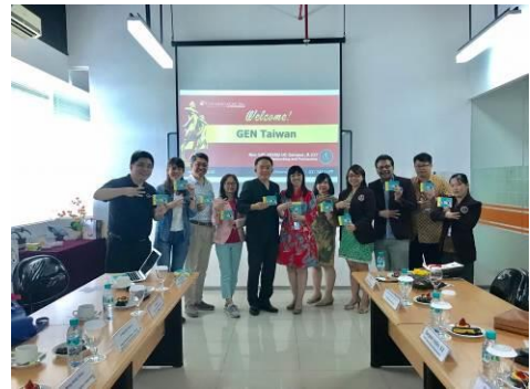
我團代表與西普拉大學代表手持 gAsia Pass 小卡並比出"E"ntrepreneur 手勢合影