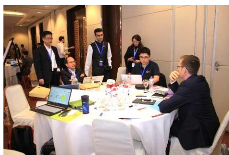
圖說：gAsia Pass 團隊賽前準備

大會並於 GEN 官網上同步以專文 “gAsia Pass Wins Startup Nations Policy Hack at SNS 2018” 報導，讓本倡議順利躍上國際舞台，啟動臺灣與國際跨境新創資源鏈結管道。(gAsia Pass 倡議簡報內容及大會報導如附件 2、3)