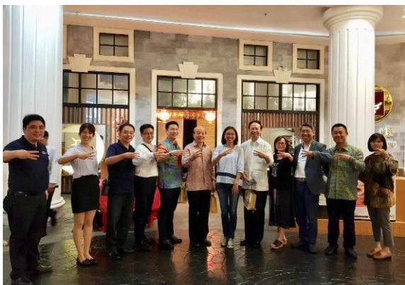
我團代表與駐泗水辦事處及青創楷模合影