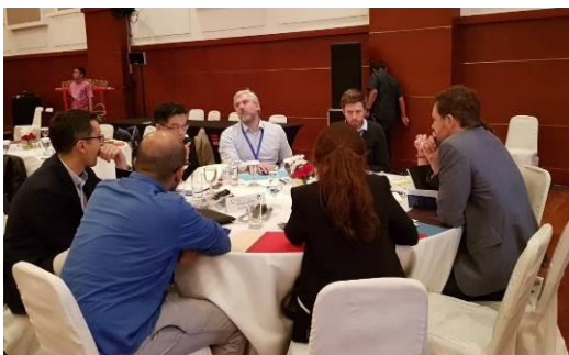
左圖：GEI & Startup Genome 討論過程