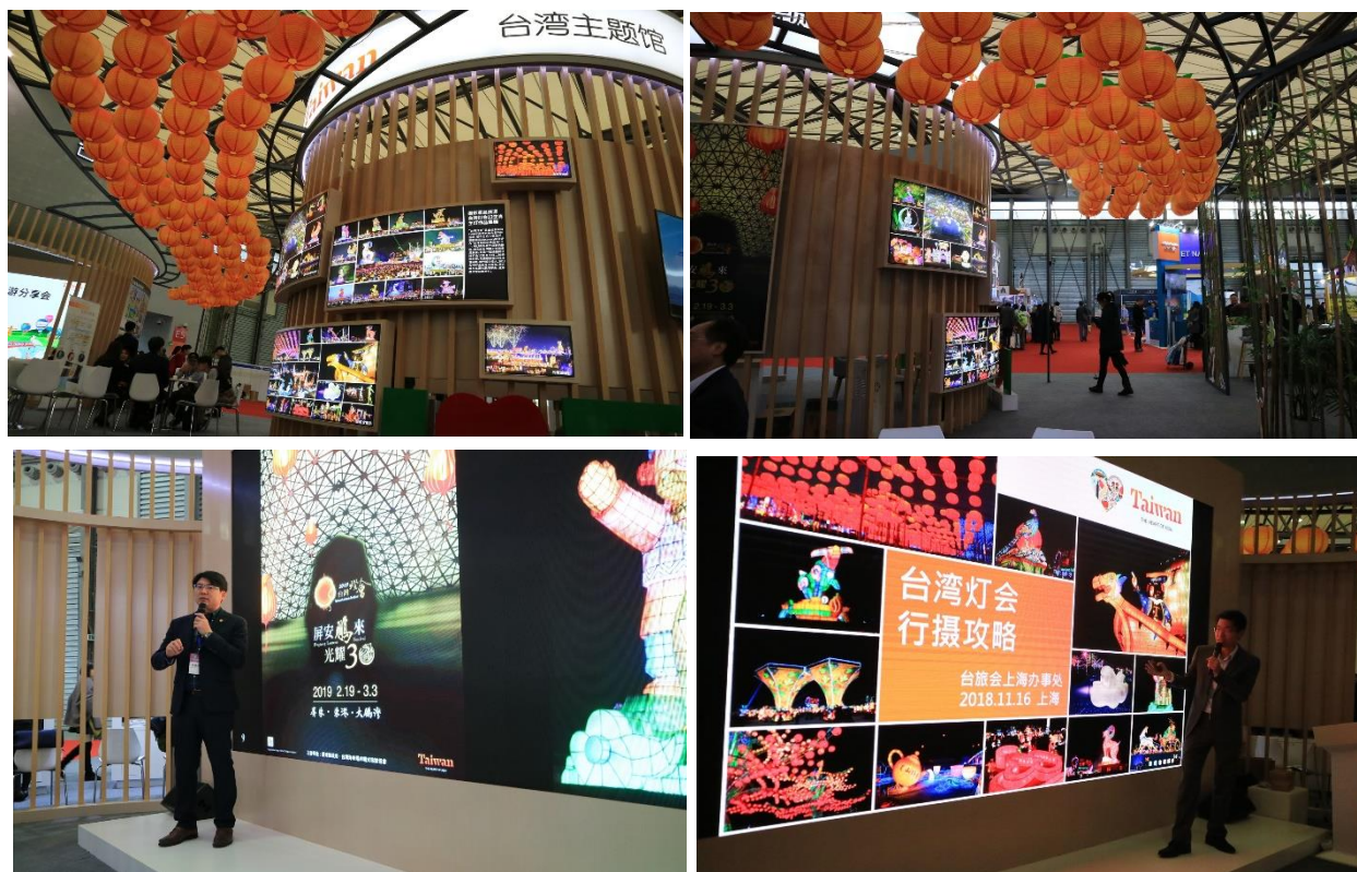
台灣燈會展示主題區及分享會