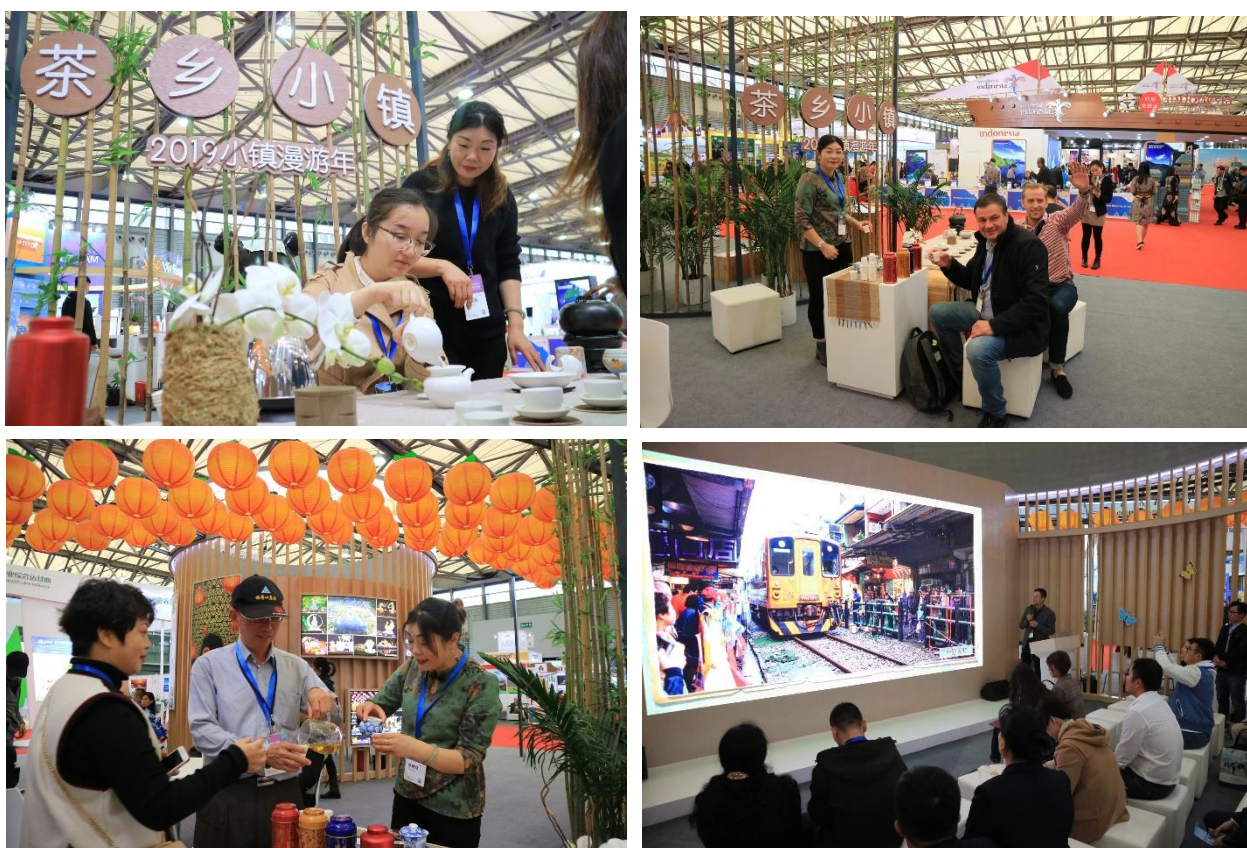
「2019 小鎮漫遊年」茶鄉小鎮奉茶體驗區