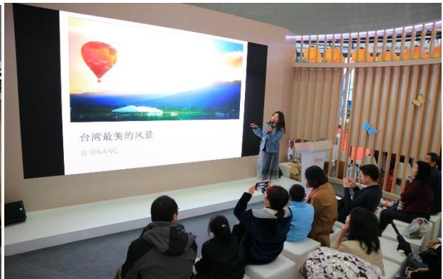
加强金马澎小三通离岛旅游推广