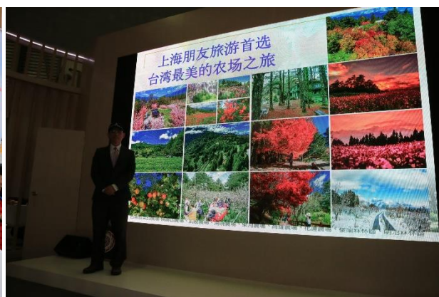
九族文化村原住民歌手表演及福壽山、武陵、清境三農場推廣