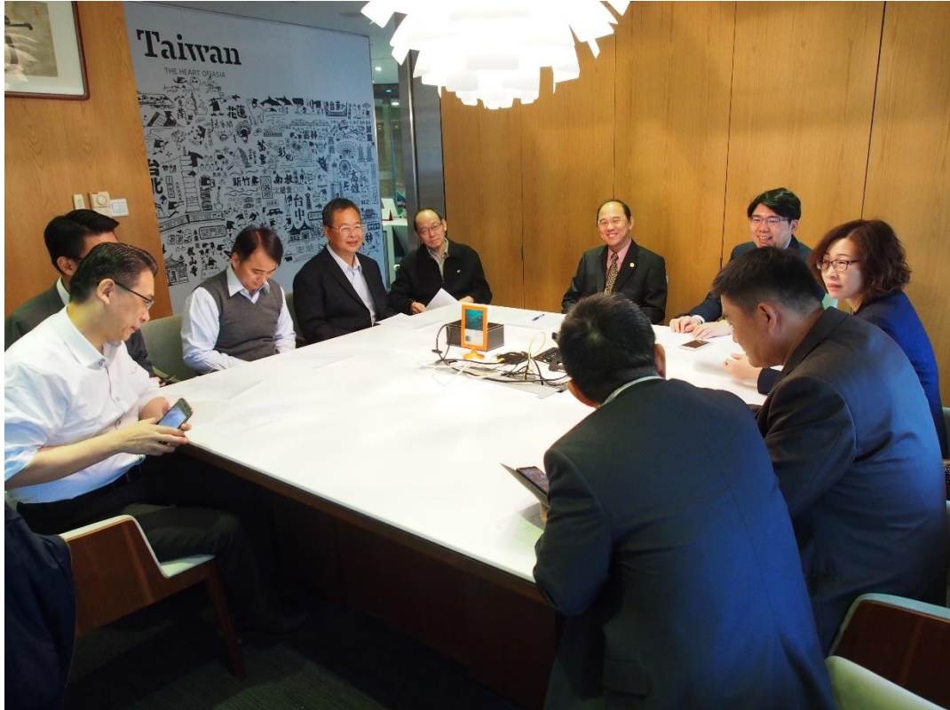
台旅會上海辦事處並聽取本次行程及策展情形簡報