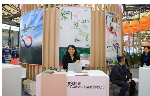
中華航空及臺灣飯店業者展臺