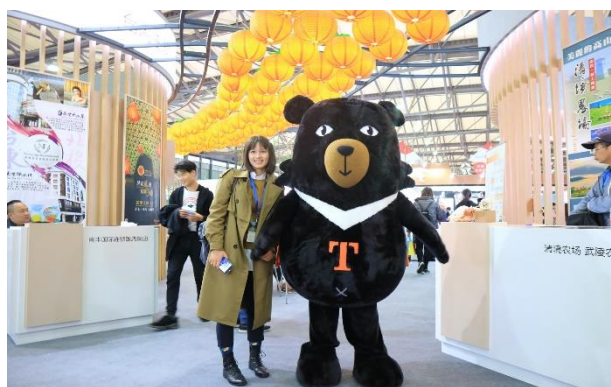
臺灣觀巴協會推廣及喔熊展場照片