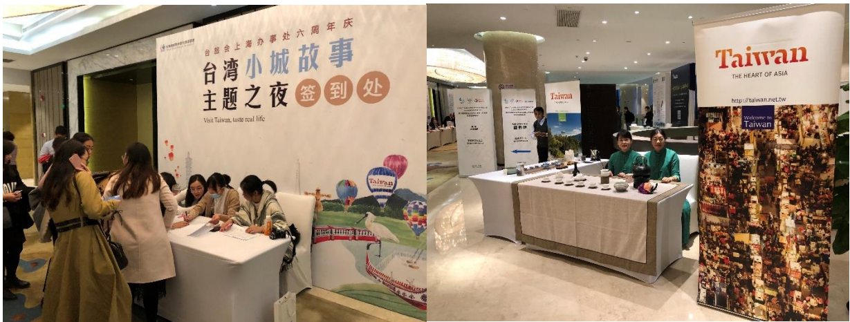
「臺灣小城故事主題之夜」來賓簽到處並設有臺灣茶葉品茗櫃台