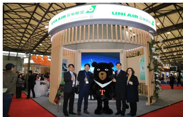
長榮航空及立榮航空主打臺灣自由行產品