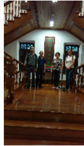
圖十五：參觀澳門茶文化館

隨後前往南灣·雅文湖畔文創商店參訪。在各式商家中，最令人驚艷的是扶康會欣悅展能藝術工作室的文創商品(如圖十六)，由失能或有缺陷人士手工親自製作。在該工作室人員說明下，得知其屬公益單位，為輔導身心障礙人士，根據其特有專長聘請專業老師教授，故呈現的文創商品深具澳門文化與特色，令人驚艷。