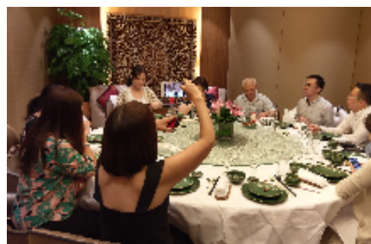
圖十二：澳門旅行同業餐會