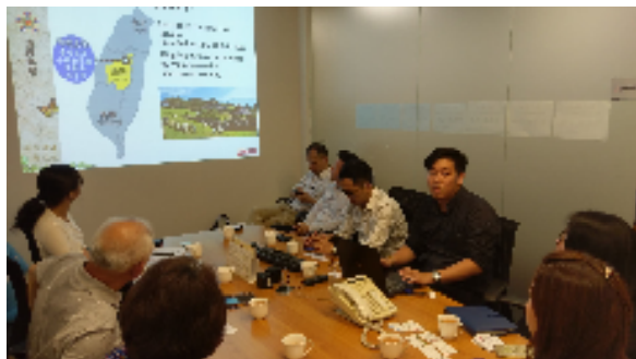
圖八：向東瀛旅行社簡報