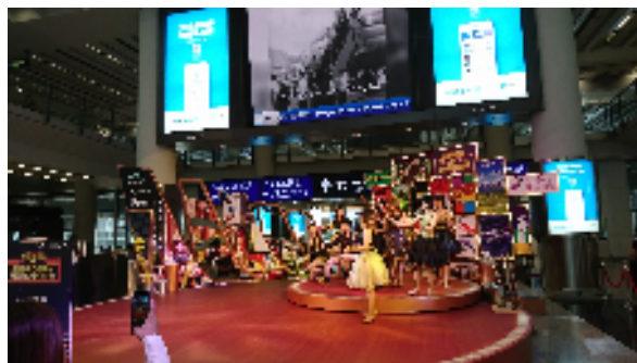
圖二：旅客諮詢中心表演節目