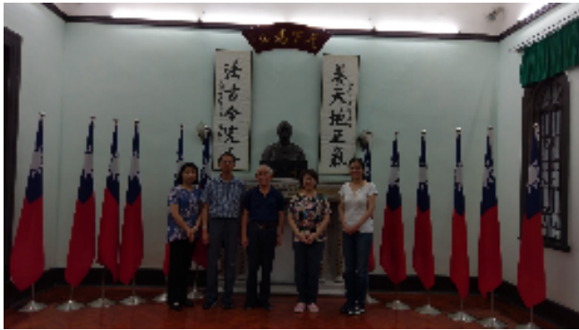
圖十四：參訪澳門國父紀念館