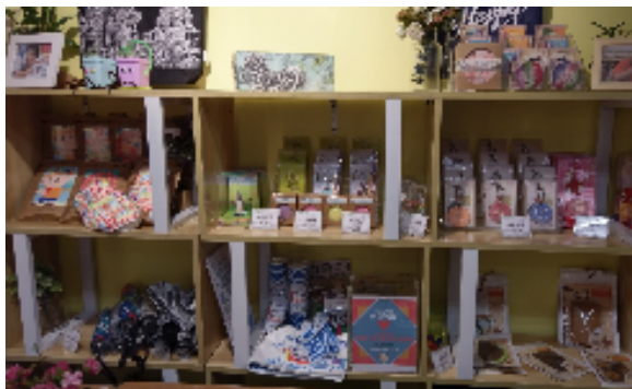
圖十六：南灣·雅文湖畔文創商店

9時前完成飯店退房手續後，到訪位於議事亭前地之澳門旅客詢問處。議事亭前地是澳門重要的觀光景點之一，旅遊人潮眾多。該處所提供之文宣摺頁以中英日韓及葡語為主，並提供多達6種語言的導覽機供旅客免費借用(如圖十七)，遊客可自主性導覽，相當貼心與便利。10時乘前往位於澳門氹仔的國際機場，搭乘長榮 BR-802 班機，約於15:30 返抵國門，結束8日觀光行銷與推廣拜會行程。