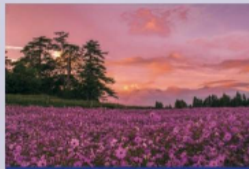
福壽山農場9-10月波斯菊盛開