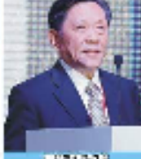
澳門基會代表在論壇上發言。