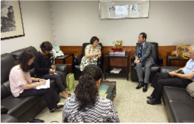
圖九：拜訪高銘村代理主任