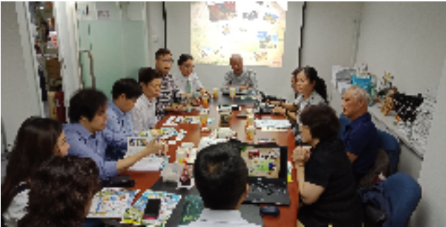
圖四：輔導會三高農場簡報

本次出席計有港台旅行社同業商會、Zuji 公司、香港中國旅行社、尊貴旅遊服務有限公司、金偉成國際旅運有限公司、饗食之旅、雄獅旅遊香港分公司等 8 家公司，於當日上午 10 時 30 分進行本會三高農場旅遊產品簡報(如圖四、五)。先由清境農場帶入後，再介紹武陵農場與福壽山農場之四季旅遊特色景點、農特產品及體驗旅遊活動。向香港業者直接說明各項遊程內容，三高山農場除可各別前往旅遊之外，也可由臺灣地接社串接後，成為 2 至 3 日遊之行程，具有彈性、便利性及賣點。本會完整深入說明農場各項旅遊資源，當地業者反應熱烈也深感興趣。在辦事處協處下，於同日先行邀約香港旅遊同業至本會三高農場進行 4 天 3 夜熟悉之旅，即「香港－桃園機場－清境農場－福壽山農場－武陵農場－桃園機場－香港」(附件一)，藉由實地勘查農場旅遊環境與設備，更深入瞭解農場所擁有資源與特色後，進而包裝成港客喜愛之旅遊產品、上架與銷售。