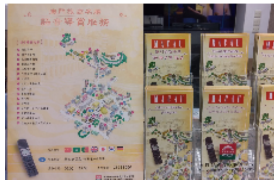
圖十七：澳門旅客詢問處