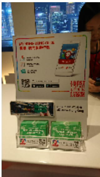
圖一：香港國際機場旅客諮詢中心

期 2 週、每日 7 場的表演節目－「百老匯之夏日狂想」(如圖二)，讓往來遊客駐足觀賞，一同拍照合影，讓機場增添許多文藝氣息。