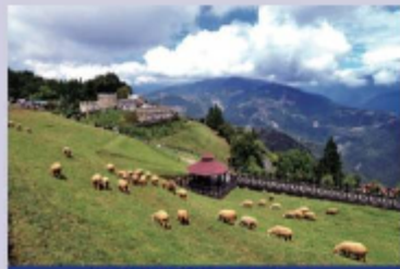
清境的青青草原-林景示導

她表示，三座高山農場遊樂設施完善、住宿設備完善，如清境農場國民賓館獲得旅館業經評鑑三顆星，武陵與福壽山農場的賞鯨除乾淨明亮並深具在地特色，均具國際水準，非常歡迎澳門民眾來臺造訪農場，無論漫步山林、大啖特色料理、品嚐高山茶，均可讓澳門民眾不虛此行，收穫滿滿。