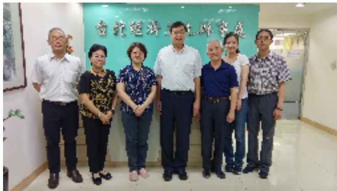
圖十三：拜訪陸委會澳門事務處

下午 2 時，在澳門事務處引薦下，本會一行訪問澳門特別行政區政府旅遊局。本會與該局互相進行簡報，該局說明訪澳旅客以大陸地區為大宗佔將近 7 成，其次則為香港及臺灣。至於國際旅客則約佔 9%。但該局行銷澳門的手法與辦理活動回饋操作模式，使得澳門的旅館業年住宿率高達 88.9%，表現非常亮眼。在交換意見後，讓本會農場學習其多元行銷方式與管道，做為爾後經營參考。