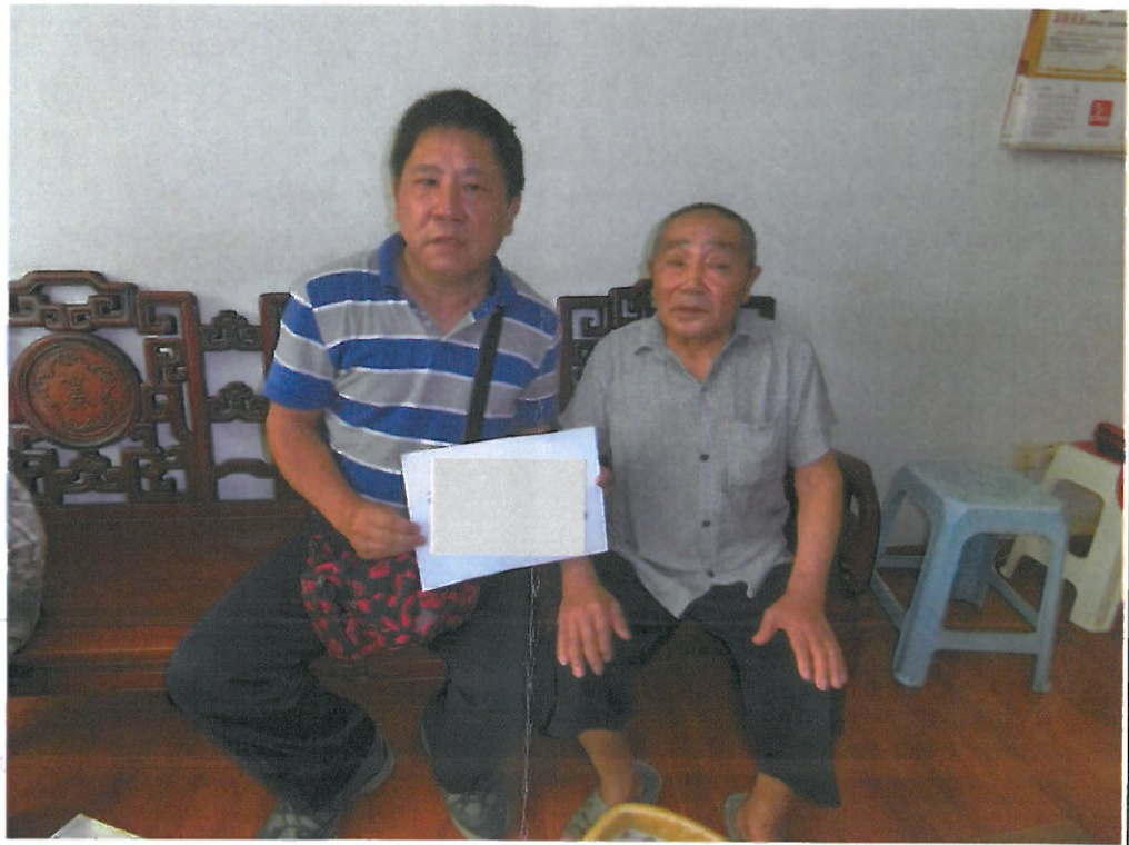
故榮民羅○錫繼承人羅○瑞(右)