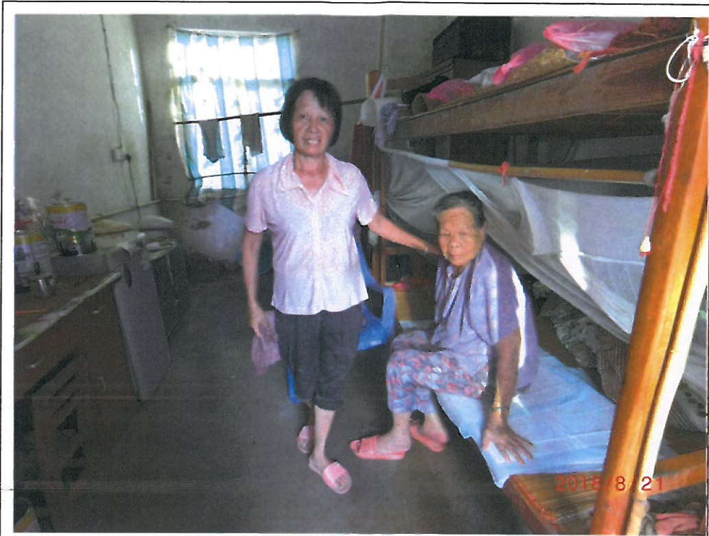
故榮民方○繼承人方○芳(右)