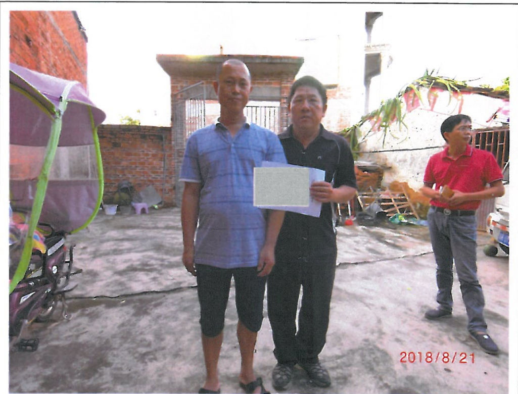
故榮民方○姪子方○宇(左)