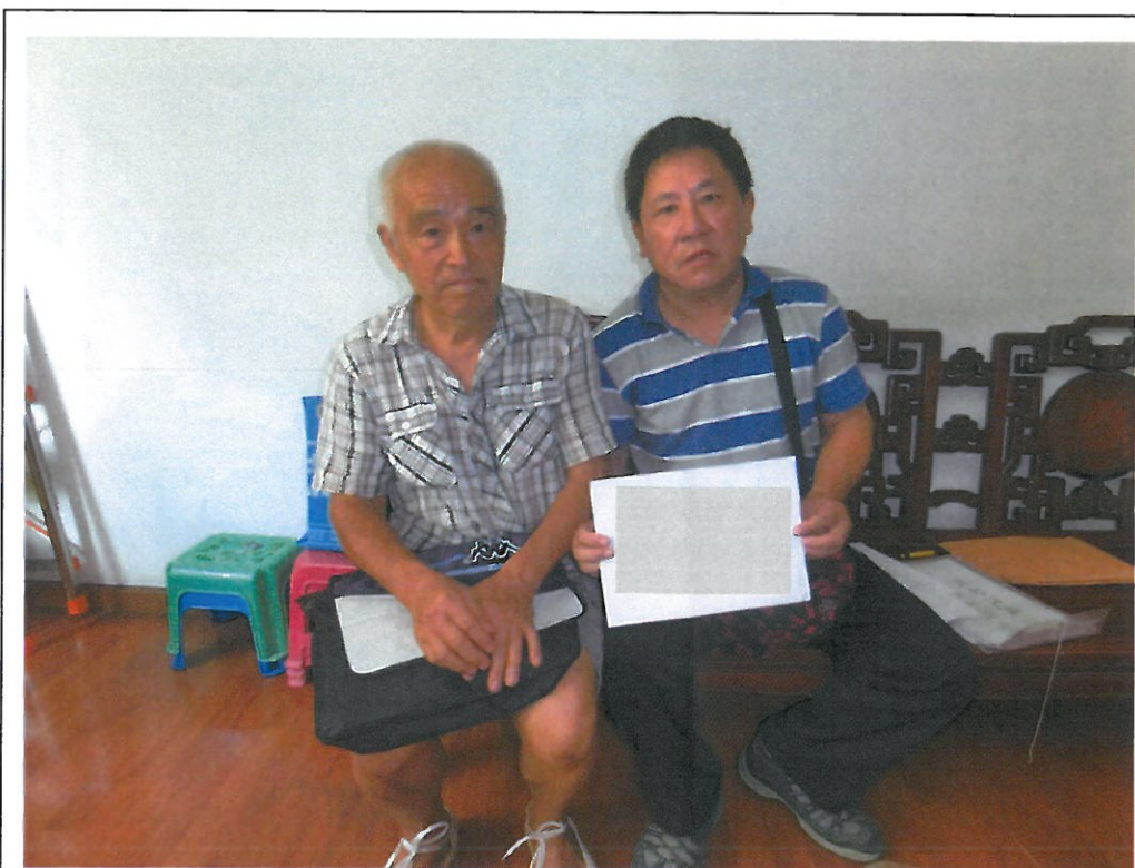
故榮民羅○錫繼承人羅○豫(左)