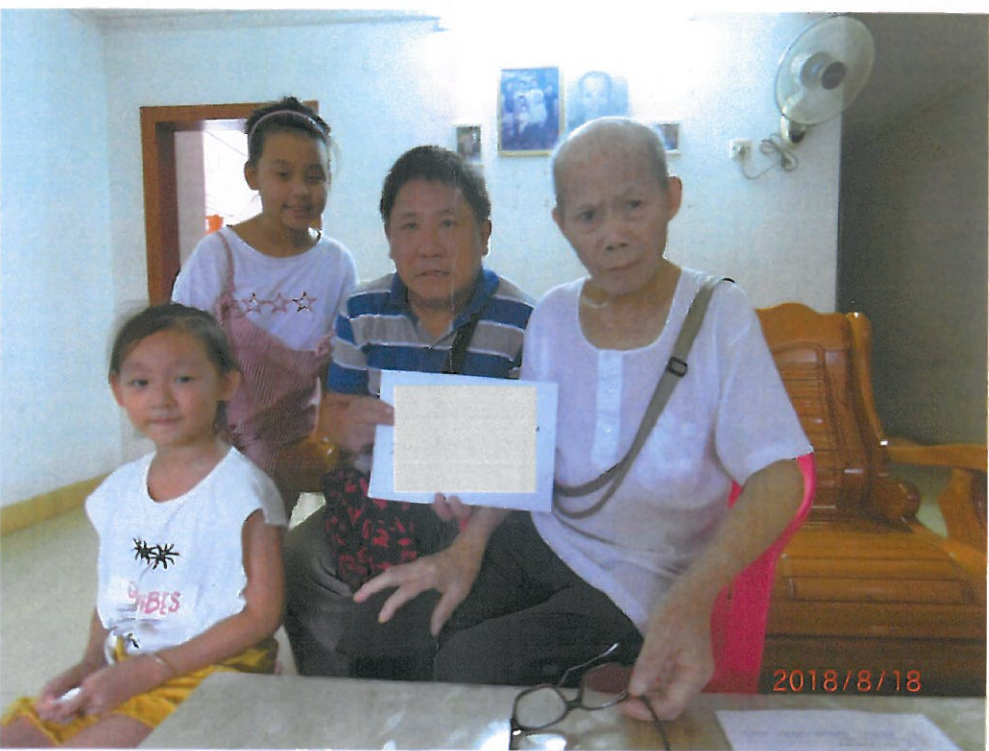
彰化榮家長居榮民林○裕伯伯(右)