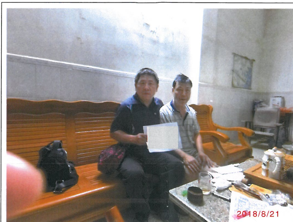
故榮民歐○繼承人歐○文之子陳○康(右)