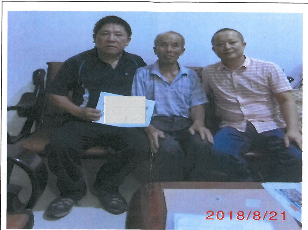
故榮民馮○輝姪子馮○生(中)及姪孫馮○新(左)