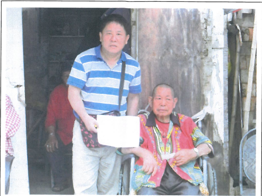
板橋榮家長居榮民熊○伯伯(右)