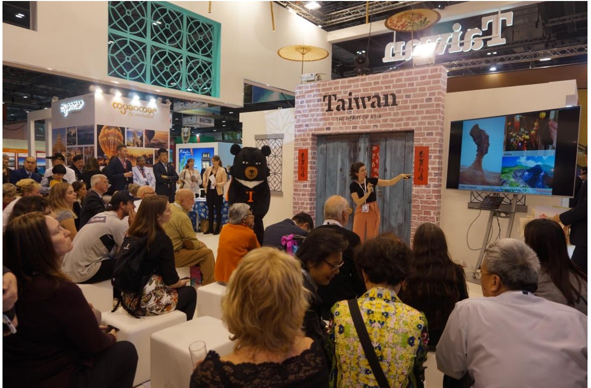
倫敦旅展 Happy Hour 觀展業者參與情形-聆聽臺灣觀光資源簡報