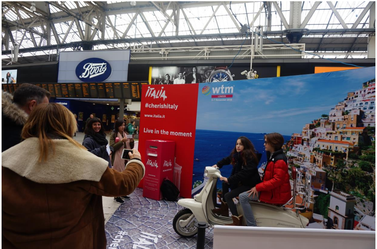
義大利旅遊局為宣傳旅展活動於滑鐵盧車站設置情境拍照區