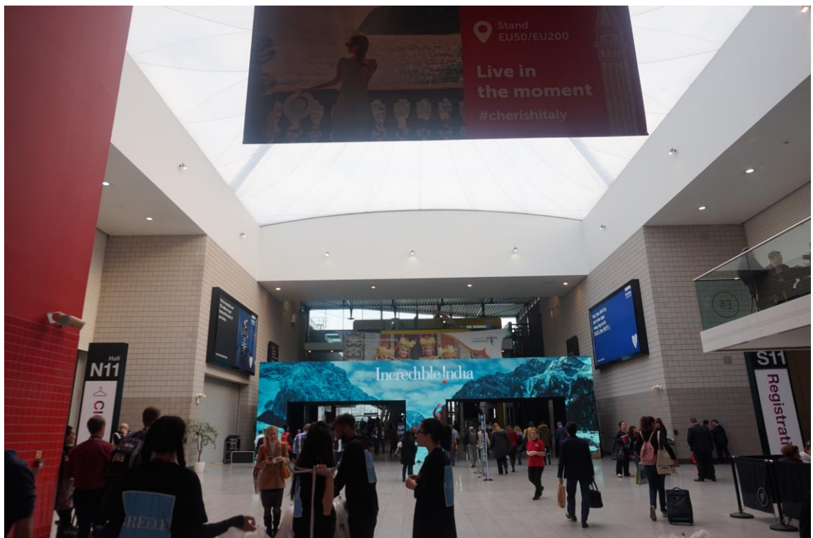
旅展現場各國刊登廣告情形