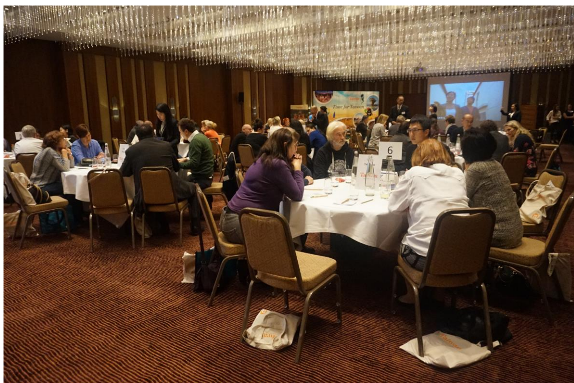
法蘭克福觀光推廣雙方業者專注溝通交流