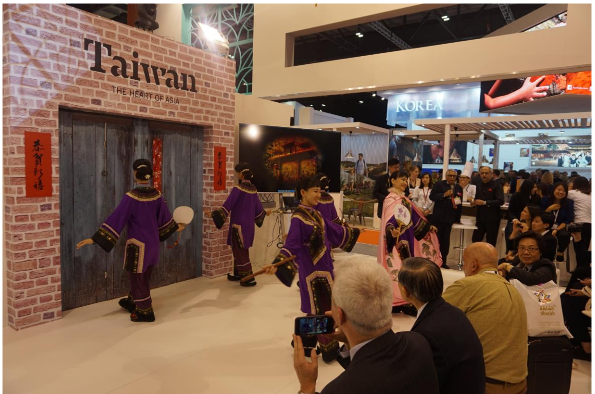
倫敦旅展 Happy Hour 觀展業者參與情形-欣賞文化表演