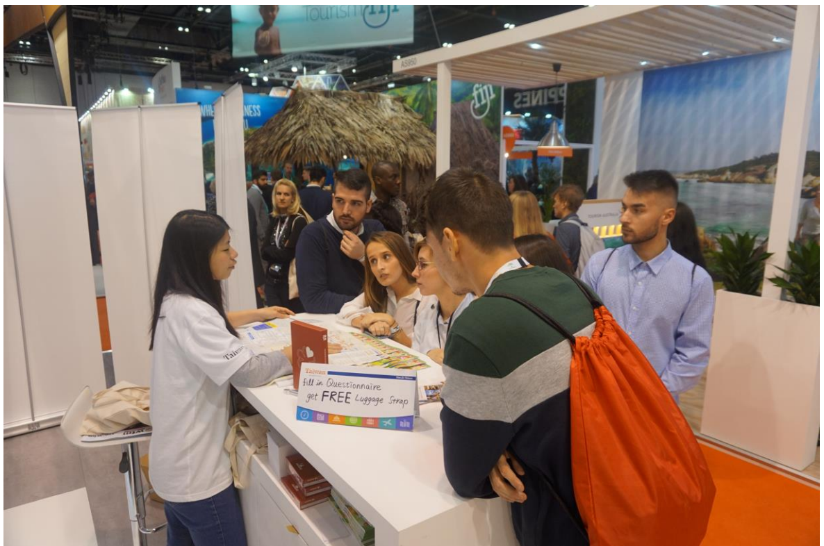
臺灣館人潮-資訊洽詢