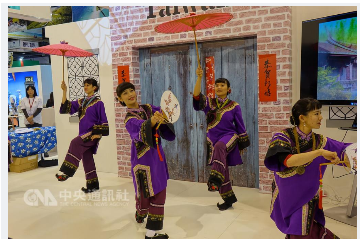
全球第二大旅展倫敦 WTM 旅展 5 日揭幕，今年以「小鎮」為主題，特邀「雞屎藤舞蹈劇場」隨團演出。 107 年 11 月 6 日

郭元益糕餅博物館在現場帶來傳統點心「壓糕 DIY」，高雄美濃油紙傘老店「廣德興」師傅現場指導油紙傘彩繪，都吸引觀展民眾親手體驗。（編輯：陳永昌）1071106