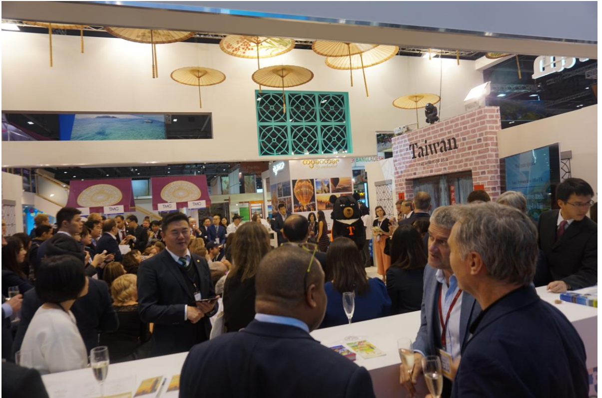
倫敦旅展駐英國臺北代表處林永樂大使致詞