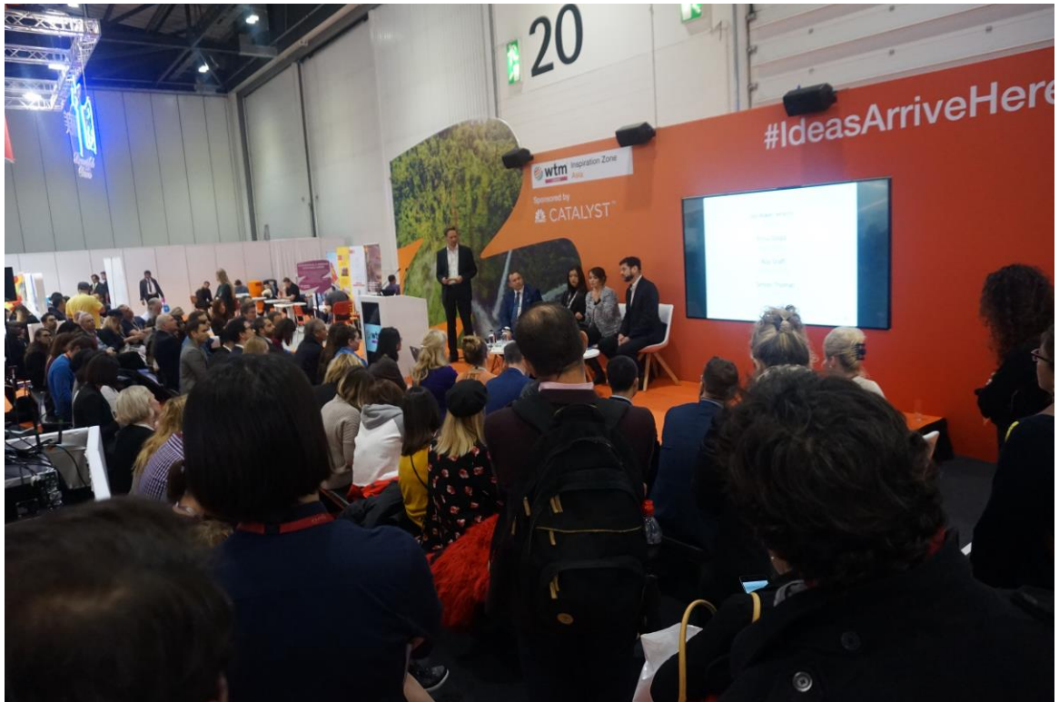
旅遊業者參與腦力激盪區研討情形