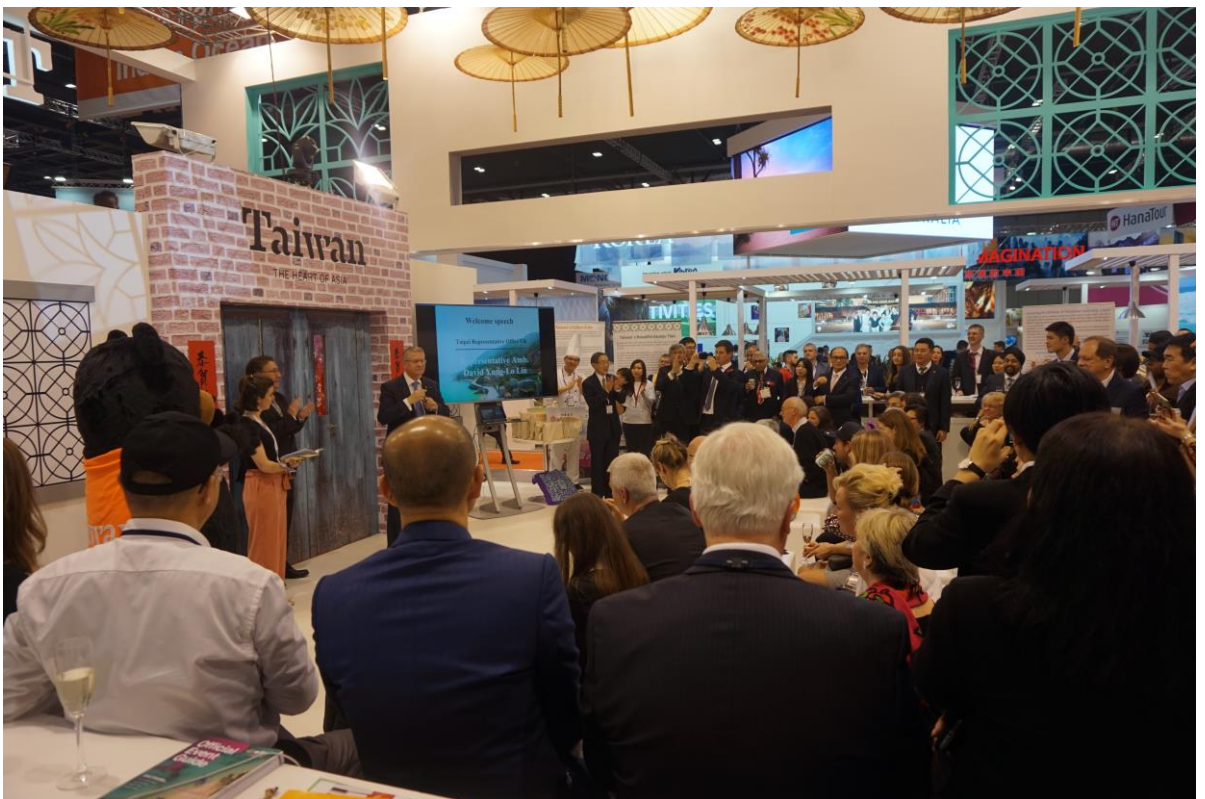
倫敦旅展英國國會羅森代副主席致詞