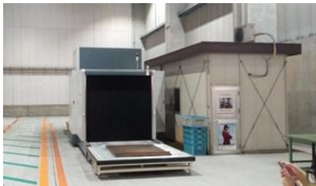
圖 2 航空貨站通關查驗設施

那霸機場的凌晨高速物流樞紐特色，為夜間 10 點至 12 點從亞洲與日本國內主要城市將貨物運抵沖繩那霸機場，於那霸機場進行轉機通關後，於隔日早上 5 點至 9 點送達亞洲與日本國內。而配合高速物流與貨物樞紐，擴大日本各地方農林水產品出口，並規劃結合電子商務與特產產品中央廚房烹調、組合銷售概念(清真食品處理、農畜水產加工等)，提高日本國內產品增值；以及發展成為亞洲區域的零件修理庫存中心；並進行日本國內首創的航空機件整備事業(MRO：Maintenance, Repair, Overhaul)，設置相關產業聚落與人員培訓機制等。另因日本東京冬天氣溫達零下 2 度、夏天達 30 多度，溫差大致經營冷凍貨物的公司需付出較高的溫控成本，而沖繩氣候溫差變動小，目前許多溫控產業有意至沖繩投資發展。