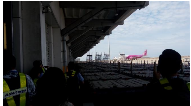
圖 3 航空貨站旁即為停機坪裝卸貨