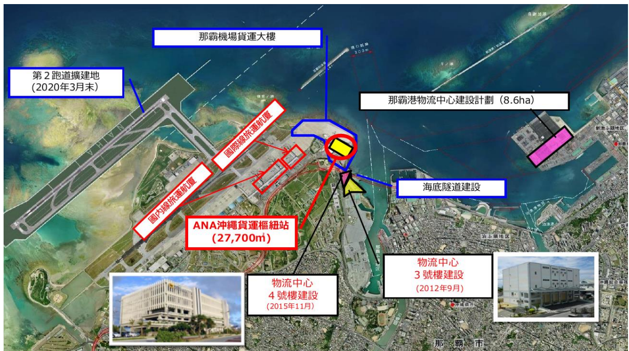
圖 1 那霸海空港及周遭物流規劃

沖繩縣積極規劃興建擴增那霸港與那霸機場並於周遭設立物流中心，規劃建設海底隧道工程等，縮短海港與空港間距離為 7 公里僅需 15 分鐘內即可到達，利用海空聯運與物流產業鏈的結合，創造競爭優勢。