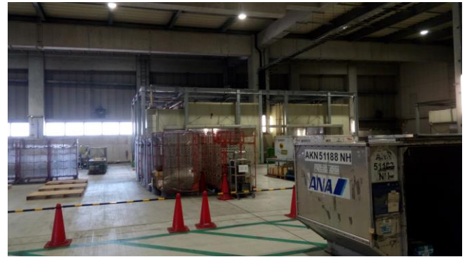
圖 5 航空貨站內部冷凍倉儲設施