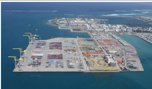
圖 6 那霸港國際貨櫃碼頭

另為利用那霸港結合國內與國外物流需求，於公共國際貨櫃碼頭後方土地規劃分 3 期興建綜合物流中心，作為倉儲、轉運、檢測、拼裝與加工等作業，第 1 期 3 層樓之綜合物流中心預定於 2019 年啟用，提供業者冷凍、冷藏與常溫貨物經營需求。