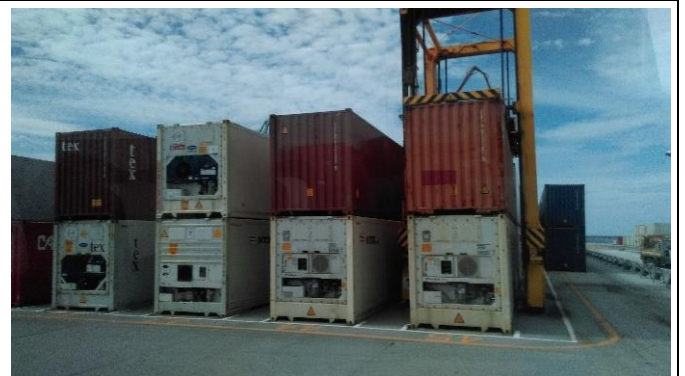
圖 7 貨櫃碼頭內存放情形