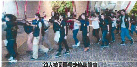
20人被司警帶走協助調查

博彩罪案調查處代處長陳仲賢透露，警方一直密切關注娛樂場衍生的罪案，並針對常見錢活動制定方案進行預防及打擊。當局認為在警方的預設機制打擊下，未見相關博彩罪案趨於嚴重，亦未見有向社區擴散的趨勢。