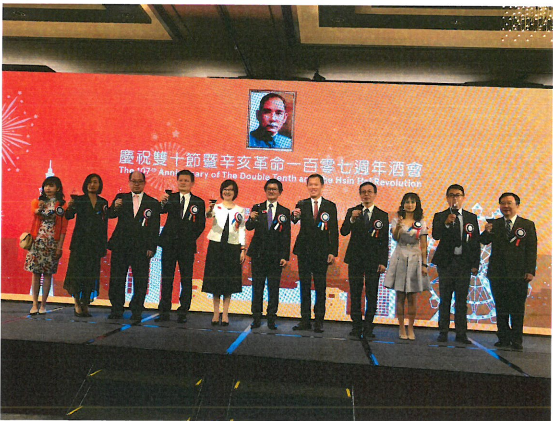
港處慶祝雙十酒會