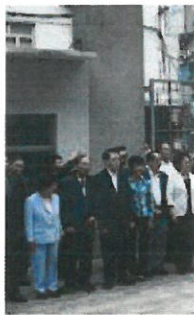
活形翠 展調流 動祖國

孫中山先生畢生追求中華民族復興，追求國家統一，這是包括台灣同胞在內的全體中國人民和全球華人的殷切願望，是海內外中華兒女的共同心願和神聖使命。舉行集會日的是懷憶孫中山先生，繼承他的遺志，呼籲台灣當局認