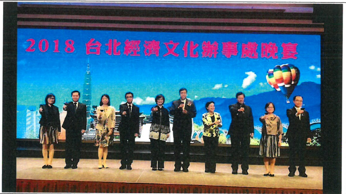
澳處慶祝雙十晚宴