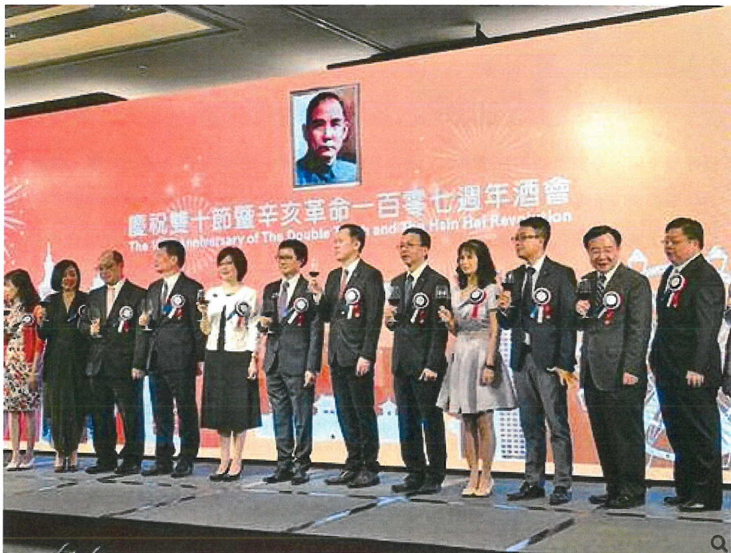
香港各界慶雙十暨辛亥革命107周年，昨晚在金鐘JW萬豪酒店舉行慶祝活動。