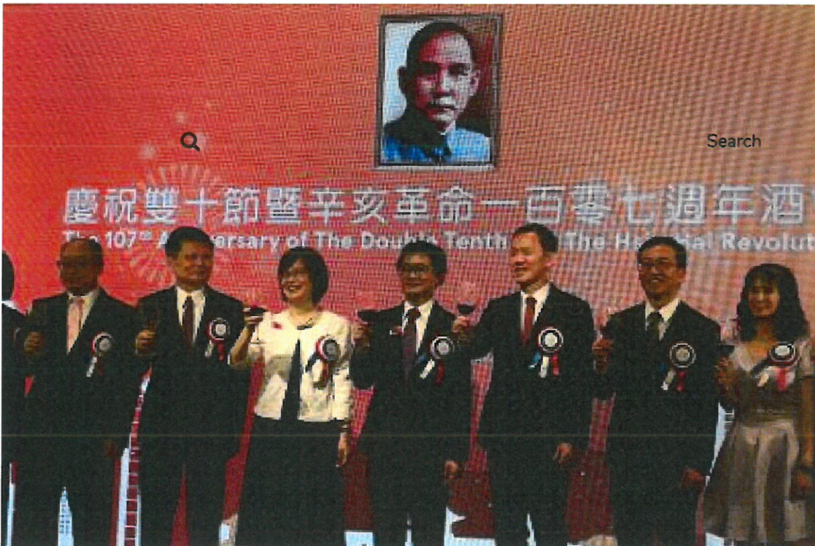
照片說明：杜嘉芬（左三）李偉庭（中）高銘村（右三）

香港各界慶祝雙十節暨辛亥革命107週年酒會10日晚間在港島金鐘JW萬豪酒店舉行，逾600人出席同慶。以特邀嘉賓身份專程由台灣來港出席酒會的大陸委員會港澳蒙藏處處長杜嘉芬指出，台灣會以「求穩、應變、進步」的政策主軸來處理兩岸關係，也期盼台港兩地加強交流，以正常且密切的台港關係，增進兩岸的情感連結。