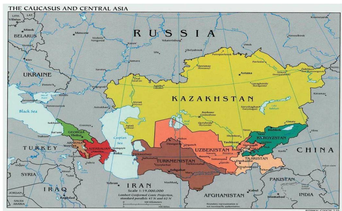
圖一 中亞五國地圖

五、 中亞地區石油、天然氣及礦產等天然資源豐富，農業及畜牧業非常發達，惟以往在蘇聯的計劃經濟下，根據各國的比較優勢發展單一產業，如哈薩克之石油、烏茲別克之棉花、吉爾吉斯之黃金，製造業和輕工業仍處於初步開發階段，產業發展不均衡，過度依賴天然資源出口，影響經濟的穩定性。此外，中亞五國均屬內陸國家，面臨交通不便，運輸成本高的問題。