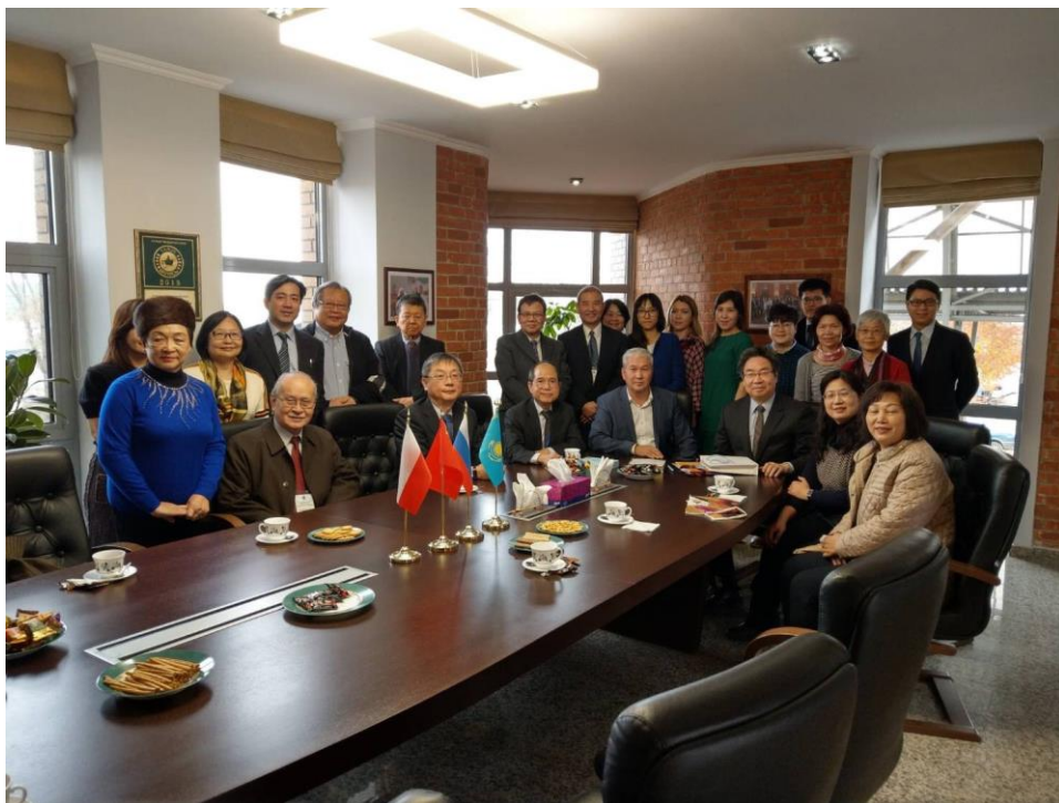
11月2日參訪阿拉木圖食品工廠 Almaty Product