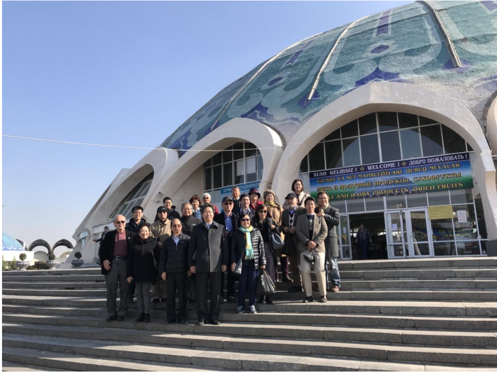
11月4日參觀烏茲別克塔什干最大傳統市集 Chorsu Bazaar