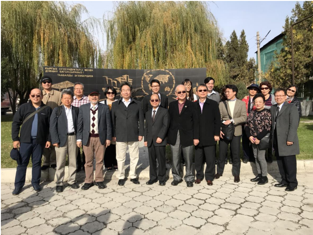
11月6日參訪吉爾吉斯飲料食品公司 Shoro