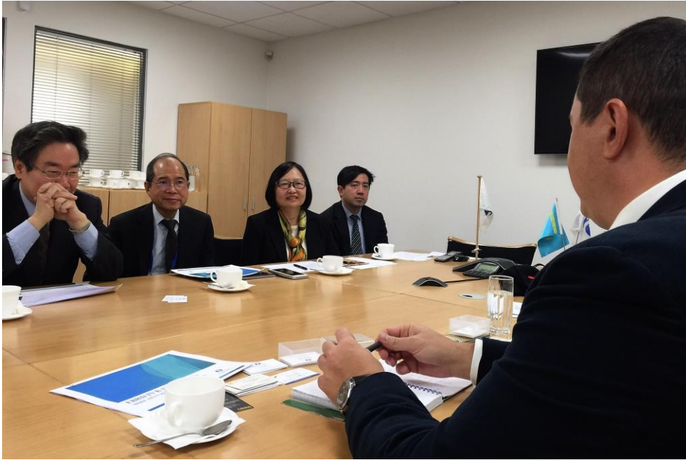
11月2日拜會 EBRD 阿拉木圖駐地辦事處