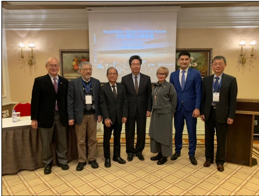
10月31日「台哈（薩克）企業論壇及貿洽會」