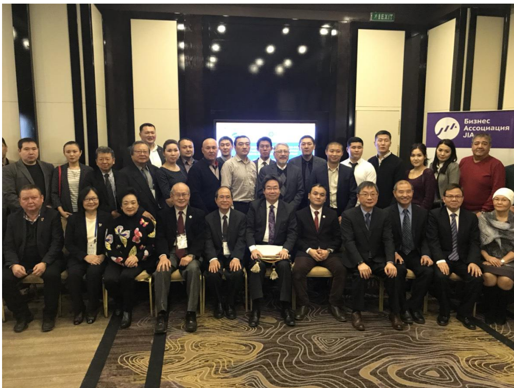
11月6日「台吉（爾吉斯）企業論壇及貿洽會」全體合影