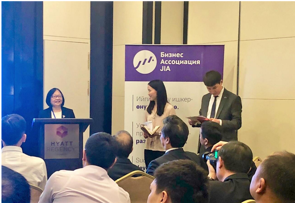
11月6日台吉企業論壇輸銀代表簡介該行業務