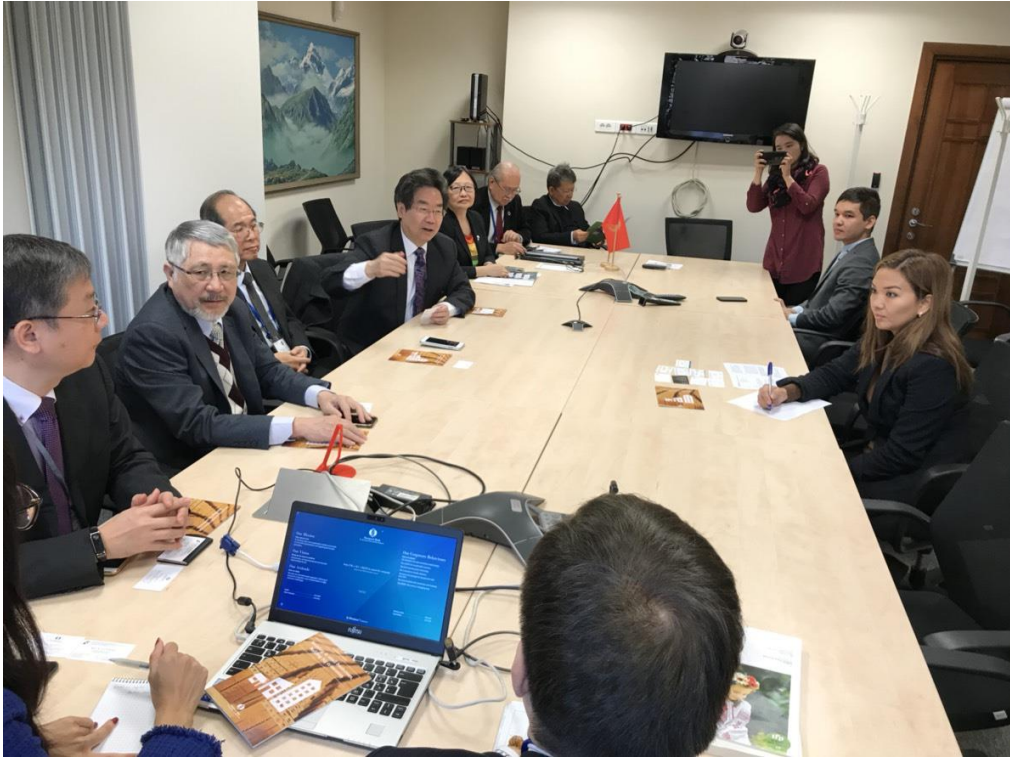
11月6日拜會 EBRD 比什凱克駐地辦事處