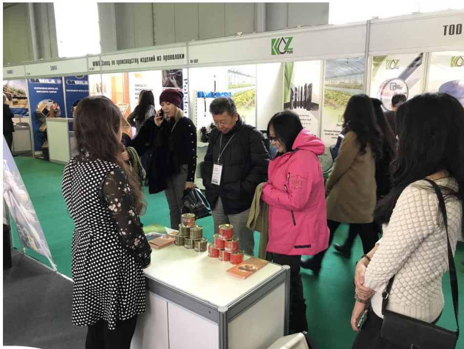
11月1日參觀第21屆中亞國際食品工業展覽暨第13屆中亞國際農業展