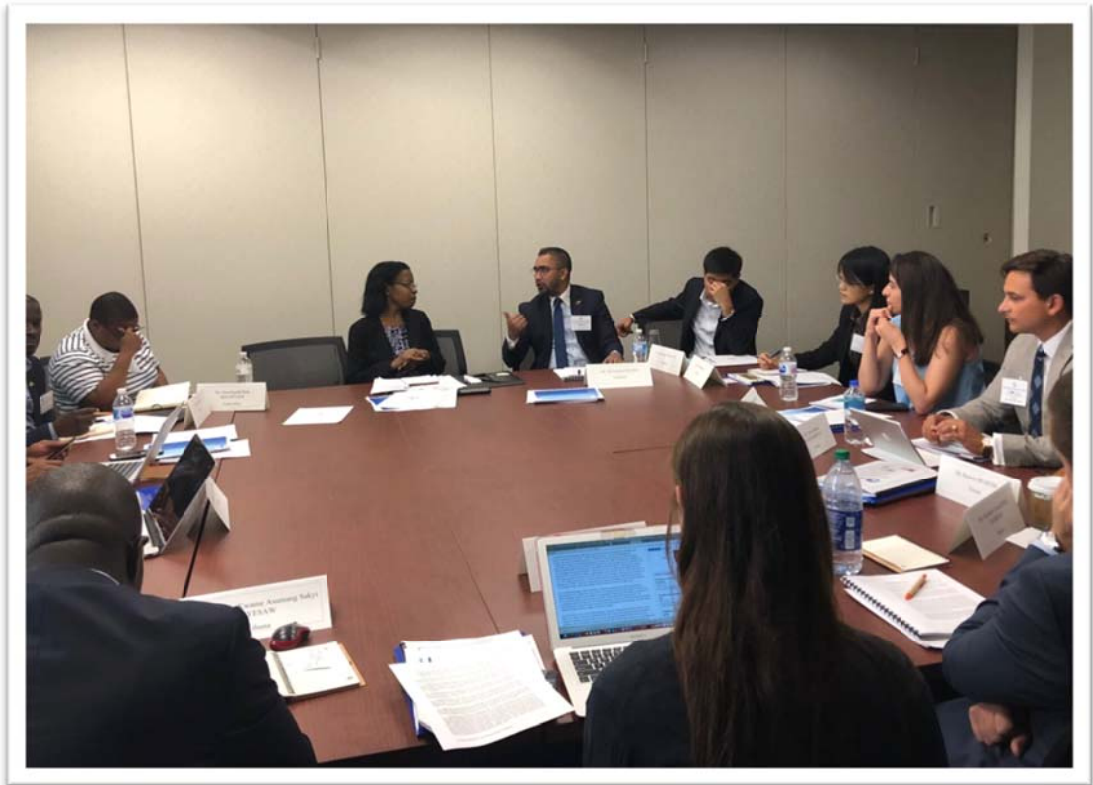
照片 3：團員參訪美國貿易代表署