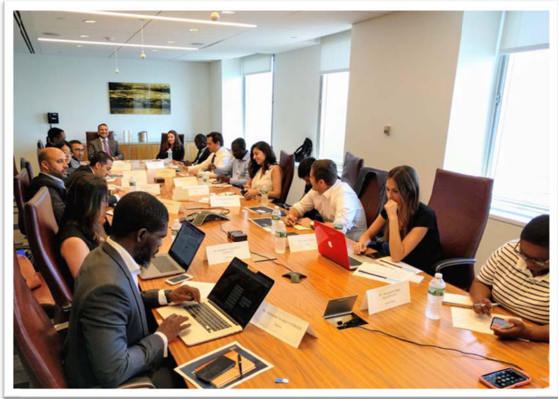
照片 18：團員拜會美國全國期貨業公會(National Futures Associations)