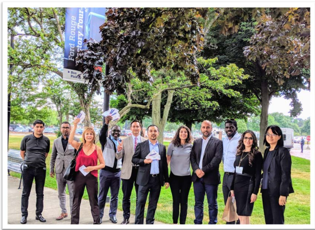
照片 16：文化參訪－底特律福特博物館