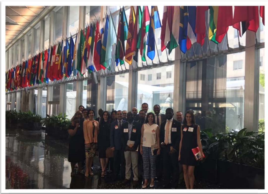
照片 2：團員參訪美國國務院