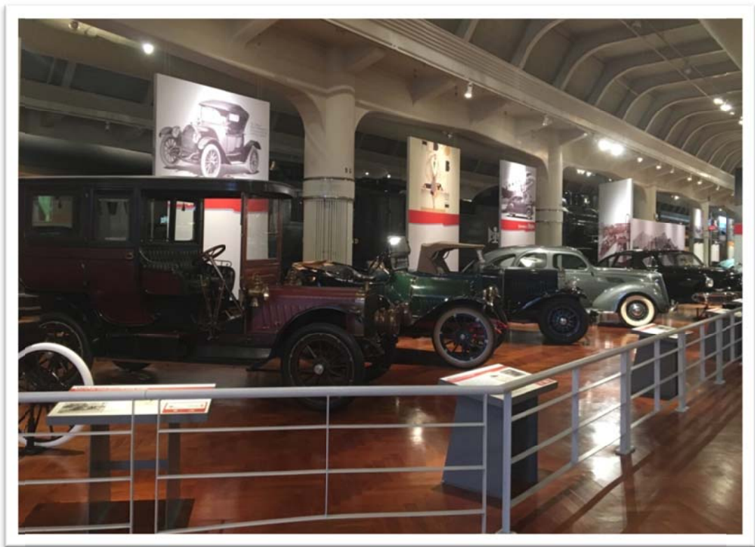
照片 17：文化參訪－底特律福特博物館