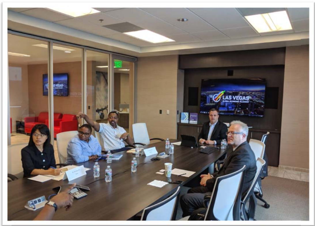
照片 4：團員參訪美國內華達州州長經濟發展辦公室