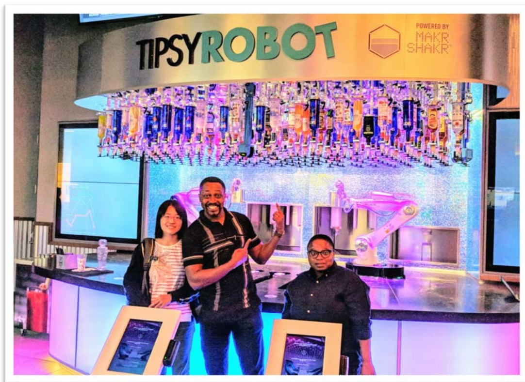
照片 6：團員參觀美國拉斯維加斯賭場之機器人調酒師(Tipsy Robot)