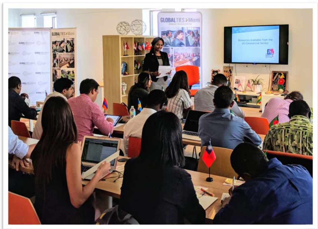
照片 10：團員拜會邁阿密美國出口協助中心