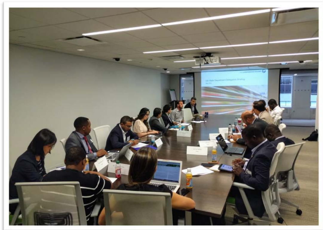
照片 19：團員拜會美國紐約智庫經濟評議會(Conference Board)