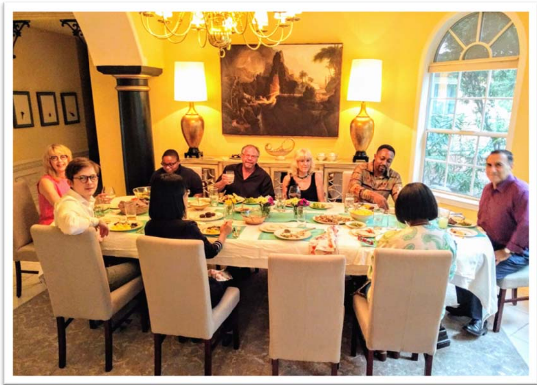
照片 7：團員接受拉斯維加斯當地家庭接待共進晚餐(Home Hospitality)