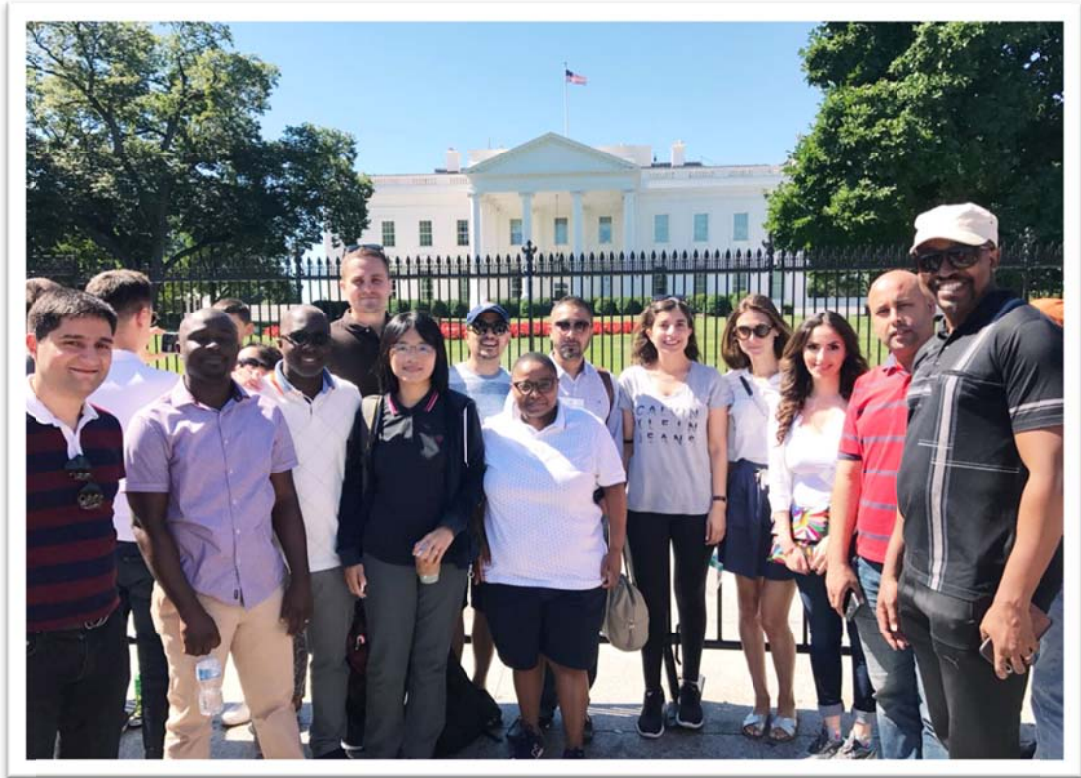
照片 1：團員於美國白宮前合影