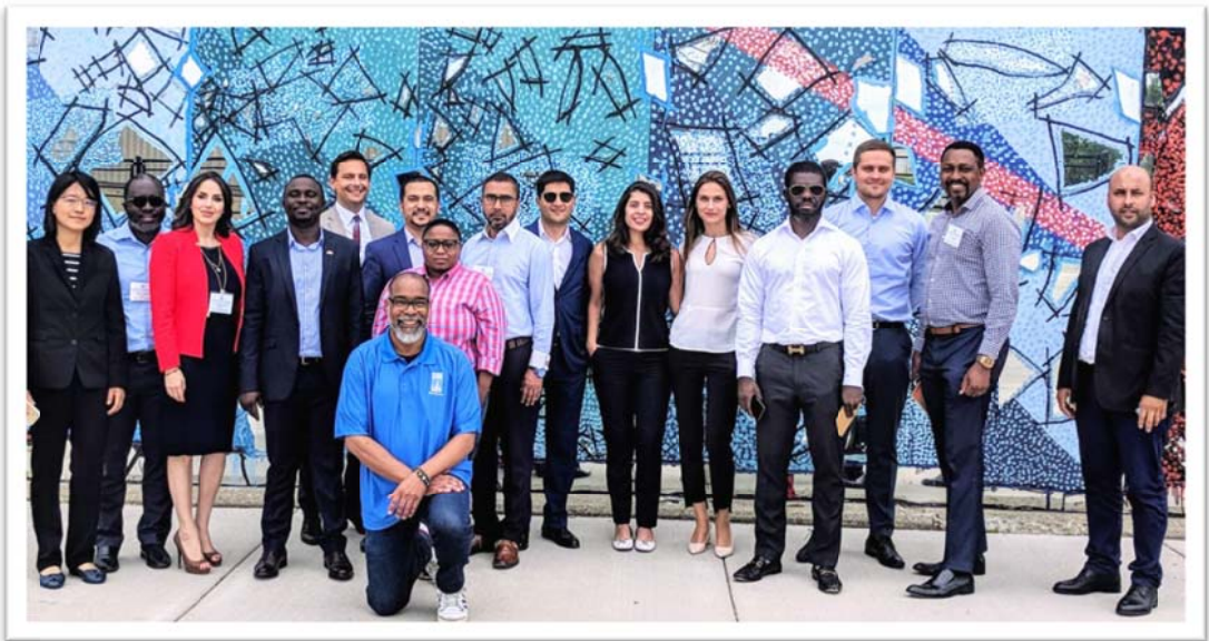
照片 11 至 13：底特律經濟發展公司(DEGC)安排城市導覽