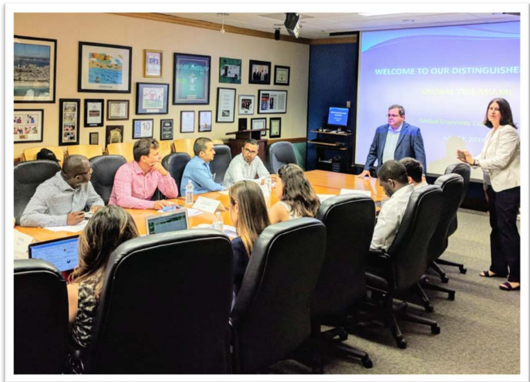
照片 8：團員拜會美國佛羅里達州邁阿密-戴德郡經濟發展與國際貿易局