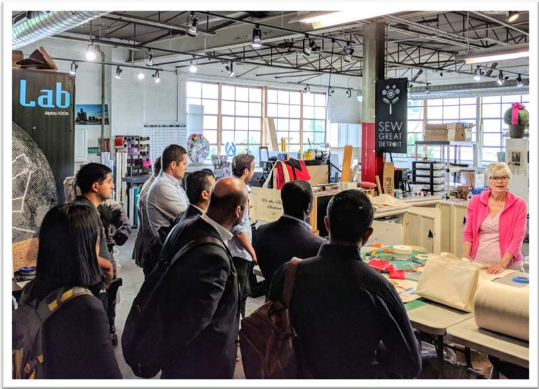
照片 14：參訪美國底特律 Ponyride 共同工作空間