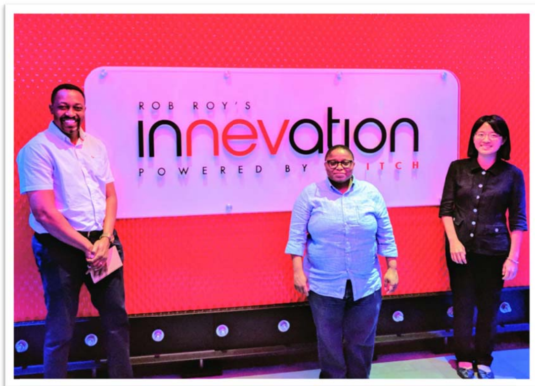
照片 5：團員參訪美國內華達州 InNEVation Center 共同工作空間