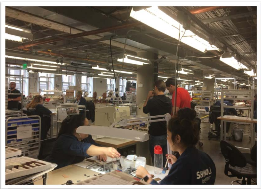
照片 15：參訪美國底特律在地設計品牌 Shinola 工廠