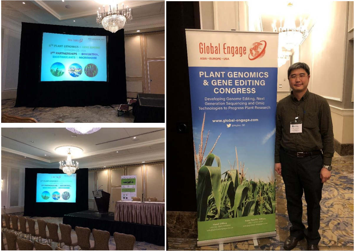
圖一、第六屆植物基因體與基因編輯研討會會場

研討會議程詳見附件一或見本次研討會網頁[4]，由於部份的演講時間重疊無法一併參加，筆者便專注於「植物基因體與基因編輯」這個主題，重要的演講內容整理如下：