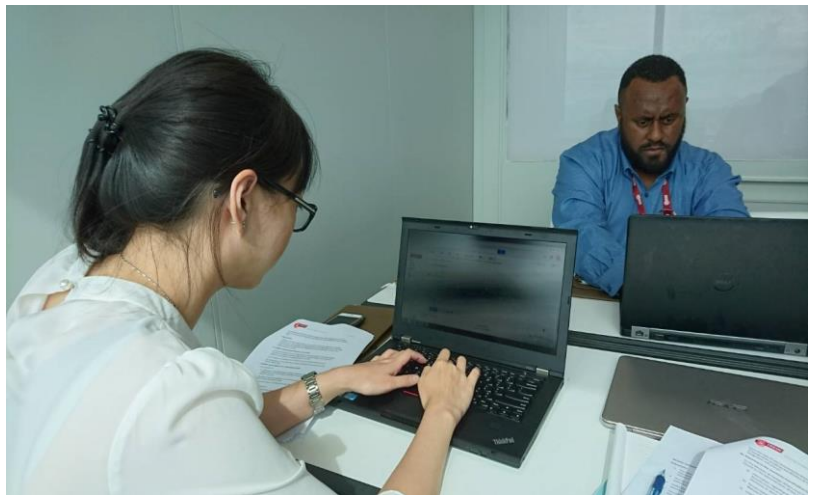
圖為來自香港的學員擔任執法機關，以專屬電子信箱向主辦單位提出詢問或要求所屬機關提供資料