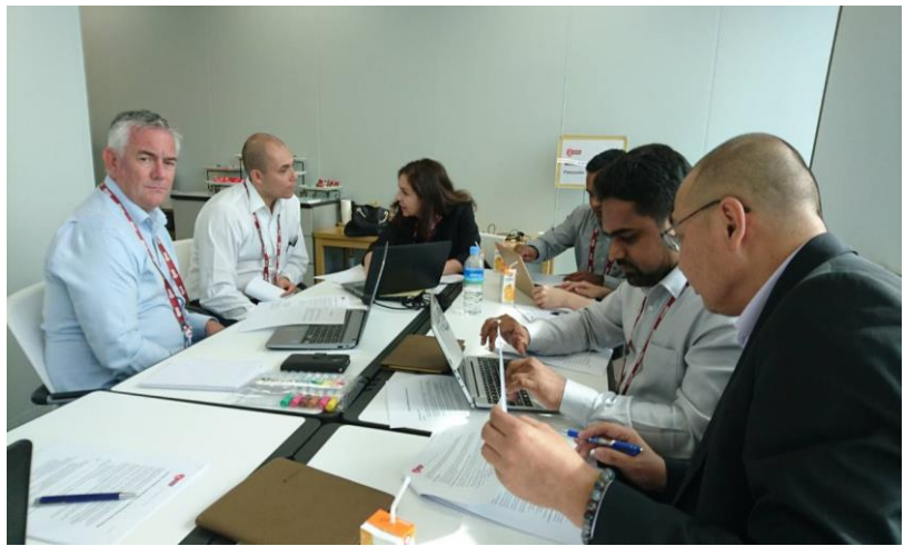
圖為組員依照分配之機關角色，以FATF-TRIEN提供之專屬EMAIL發信詢問或將資訊提供給其他機關