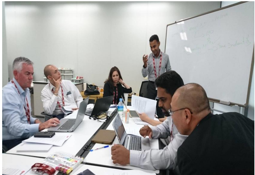
圖為組員進行討論，並將爭點或資訊整理在白板上