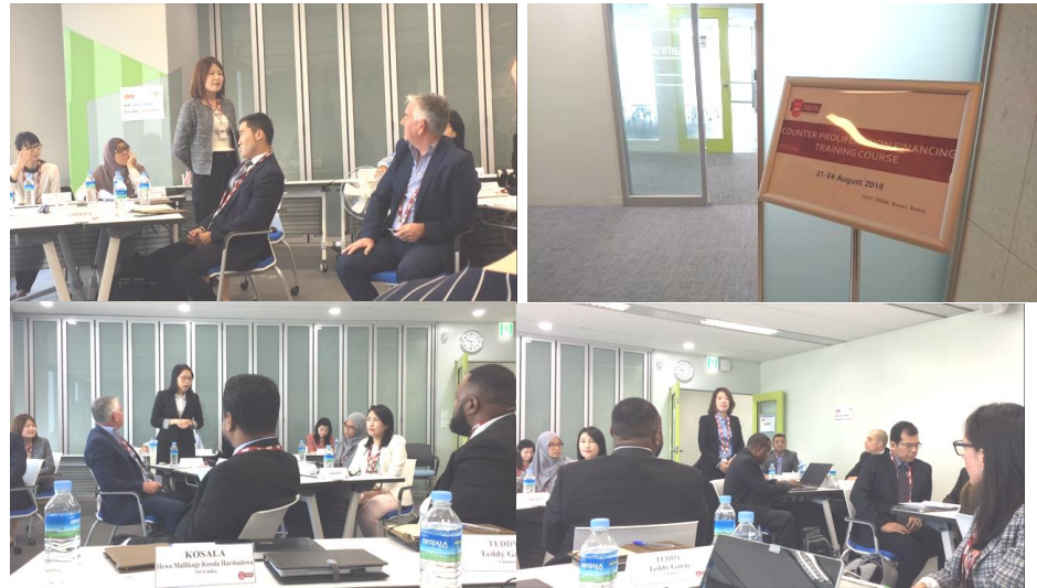
圖為我國代表自我介紹及 FATF-TREIN 受訓地點