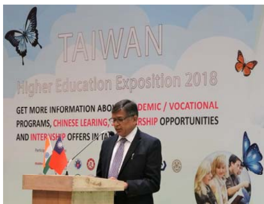
圖 2 印度大學協會主席桑迪普·山契提應邀致詞

開幕式後參展學校代表紛紛邀請姚政務次長參觀攤位並合影留念，並就未來擴大招收外國學生之策略及途徑提供建言。