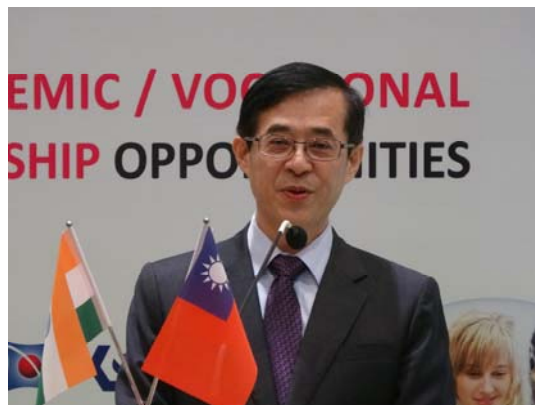
圖 3 姚政務次長立德致歡迎詞