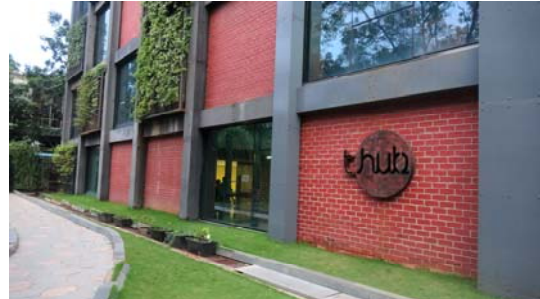
圖 11 T-Hub 外觀