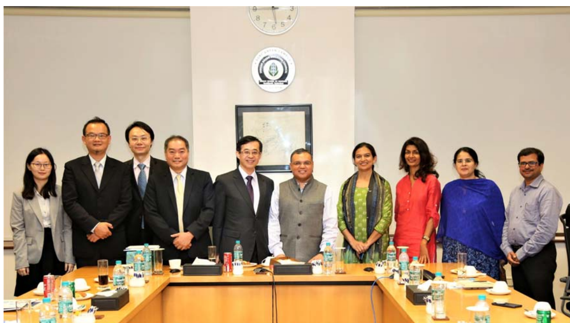
圖 9 與印度商學院研發長勝佳卡拉普(Sanjay Kallapur)(中)合影

私立的印度商學院 (ISB) 學費一年約4萬美金，校園建物美輪美奐，學生多是在職生，平均年齡28歲，由於與歐美名校結盟，因此吸引不少國際學生就讀，包括中國、日本、韓國與東南亞國家。姚政務次長除讚佩其辦學成功經驗外，希望未來能在華語教學方面進行合作，多與我國商學院交流，並成功在政治大學設立印度中心，增進兩國大學及學生間的認識。