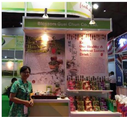
桂淳股份有限公司