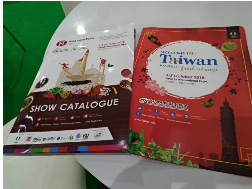
圖八:Fi Asia2018 大會手冊中的廣宣