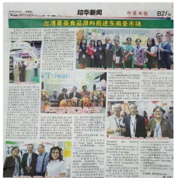
圖七:Fi Asia 展覽期間於當地媒體刊出的廣告宣傳