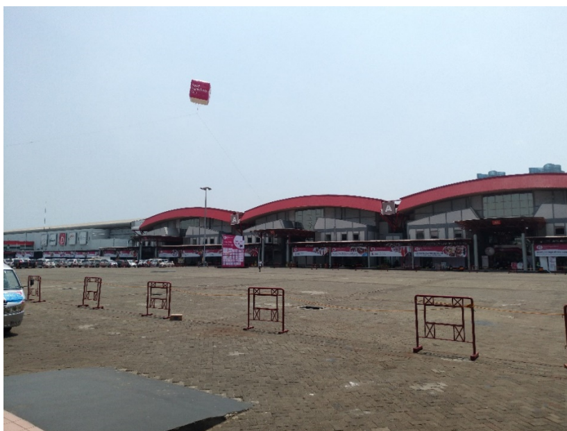
圖一：印尼雅加達國際展覽中心（Jakarta International Expo）

會有來自全球 60 個國家共 750 家廠商參與，為亞洲地區規模最大的 B2B 機能性食品原物料專業展會。據大會統計，本屆展會約有 20,000 名專業買家入場觀展，可見本展會受矚目之程度。