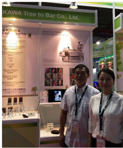
可可蛙國際有限公司