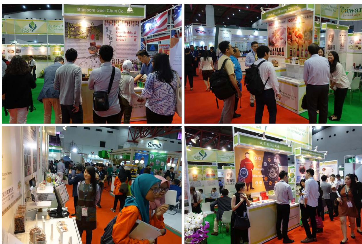
圖五:廠商參展實況

一、展館設置及展出成果：本處邀集園區廠商共同參展，於印尼雅加達國際展覽中心（Jakarta International Expo）A2 館，租賃展位(展位編號 X-12)設置臺灣農科館(面積 56 平方公尺)，由萬家香醬園、桂淳、會昌、活那凌及可可蛙等 5 家公司聯合展出(參展產品如附件二)，也設有農科園區服務臺便於提供洽詢及招商服務。農科館的展館設計以潔白色系為基調，輔以淡綠色系的挑高規劃，搭配燈光和草綠色攤位呈現簡明乾淨的主視覺，同時善用 Taiwan 及 PABP 文字及圖形，完成表現出整體形象及豐富專業感，也和整個展會大多以標準裝潢的展館有明確區隔，充分幫助參展廠商吸引相關買家前來。也設有農科服務台便於提供洽詢及招商服務。依據參展廠商所提供資料統計，3 天展期共計 306 家買家至臺灣農科館臨櫃洽談，以新南向諸國的亞洲買家為主(佔 94%)，其中有 56 位買家(18%)已談及進一步合作或成為代理商的可能性，預估未來一年內陸續洽妥接單金額約可達新臺幣 8,000 萬元以上。