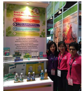
活那凌生技股份有限公司