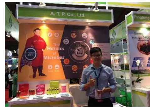
會昌實業股份有限公司