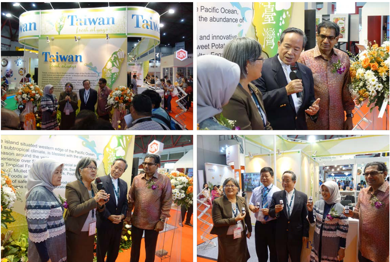
圖九:臺灣展館及農科展館開幕活動