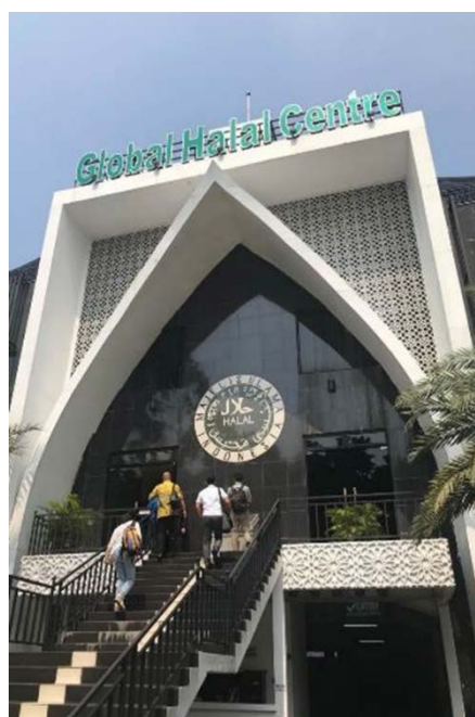
圖十二: 印尼 MUI 伊斯蘭宗教學者理事會