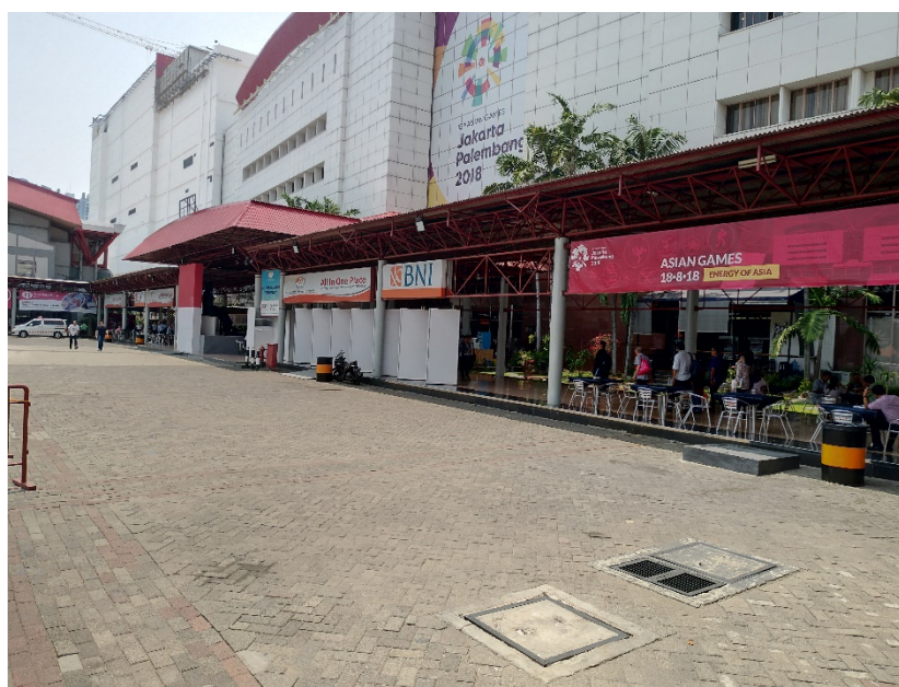
圖二：印尼雅加達國際展覽中心 Fi Asia 展館入口