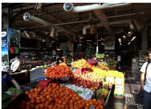
圖十三: Ranch Market(大華超市)

印尼每年農產品及食品進口金額超過 40 億美金，一般家庭收入約 53% 花費在飲食上，顯示印尼食品市場的龐大經濟利益及進口農產品的強大需求；本次於行程中安排參訪當地 Ranch Market(大華超市)及家樂福賣場；Ranch Market 最早於 1997 年在美國 Ranch Market 的特許經營商，並在隔年重新成立印尼公司、在印尼深耕超市零售市場，穩步發展成為健康和消費領域的領先零售商之一，Ranch Market 不斷努力提供最高品質的產品，包含熟食食品，優質肉類、魚類和家禽，並販售不少進口雜貨，結合獨特的氛圍和優質的服務廣受高端消費者喜愛，Ranch Market 已在全國展店 14 家，並且設立旗艦店坐落於印尼最高端的 Shopping mall, Grand Indonesia。目前 Ranch Market 是印尼全國第一家支持聯合國全球盟約的超市，共同支持人權、勞工、環境、反貪腐等十項普遍原則、也是全國唯一通過 HACCP 9000 的零售通路，為印尼消費者的食品安全把關，結合獨特氛圍和優質服務廣受當地高端消費者喜愛(尤其是華人、日本人及韓國人)；家樂福賣場為當地一般印尼人消費的平價通路，可以從此賣場所販賣的產品中，瞭解大多數印尼人消費的產品及消費習慣，此通路所販售的加工肉品、油脂、調味料等可能有豬肉、豬油或基改原物料參雜的產品，大多數都有印尼 MUI 清真認證標章，使穆斯林消費者能夠安心購買食用或使用。