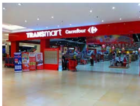
圖十四:印尼家樂福賣場