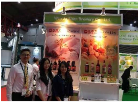
萬家香醬園股份有限公司