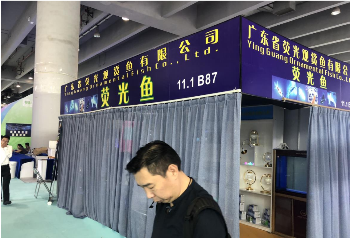
圖九、CIPS 展亦有展示螢光魚(螢光飼料)