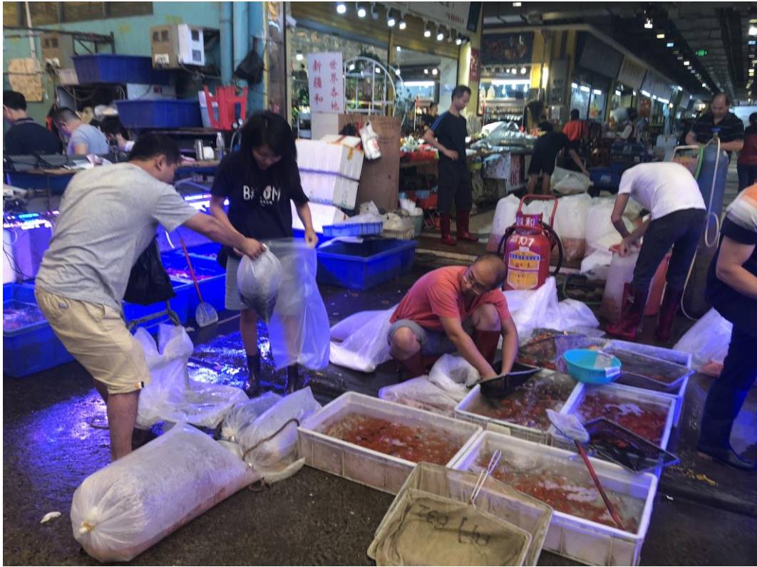
圖十七、廣州市花地灣花鳥魚蟲市場-水族批發