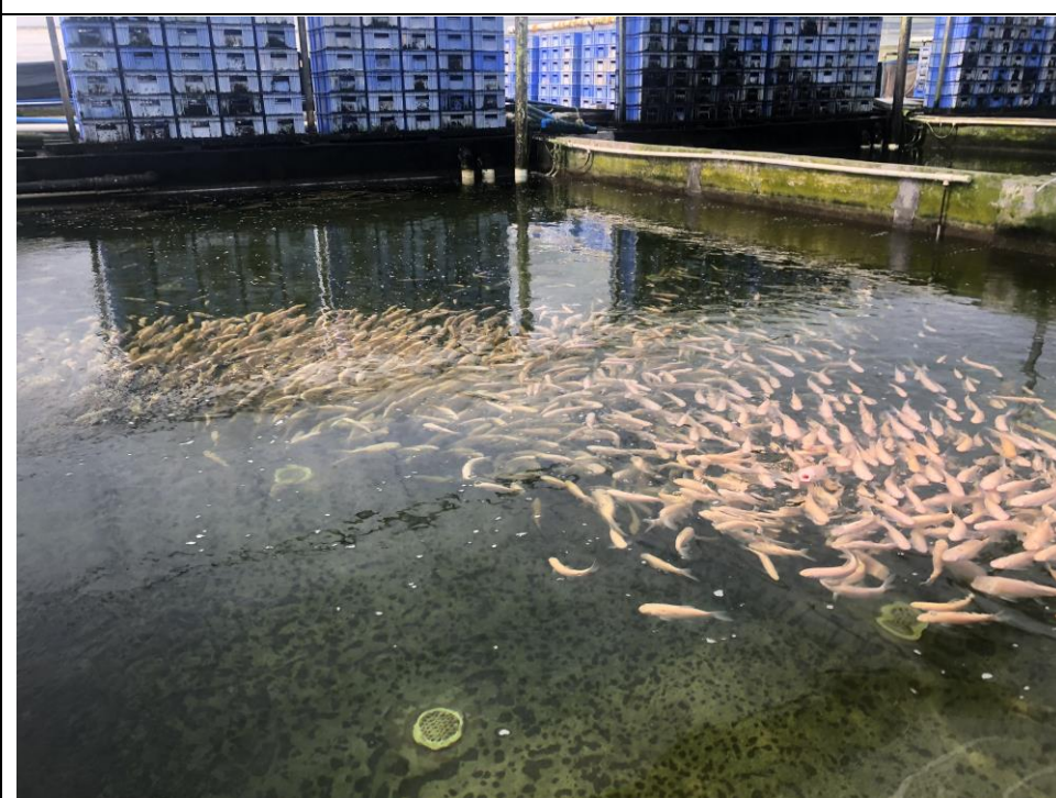
圖十四、廣州市花銅觀賞水族養殖場培育粉色慈鯛魚