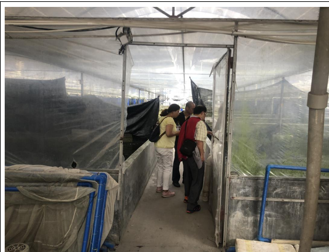
圖十三、廣州市花銅觀賞水族養殖場