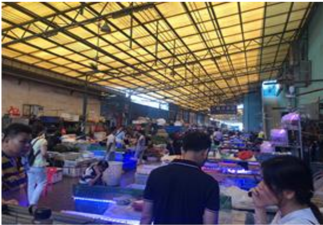
圖十六、廣州市花地灣花鳥魚蟲市場