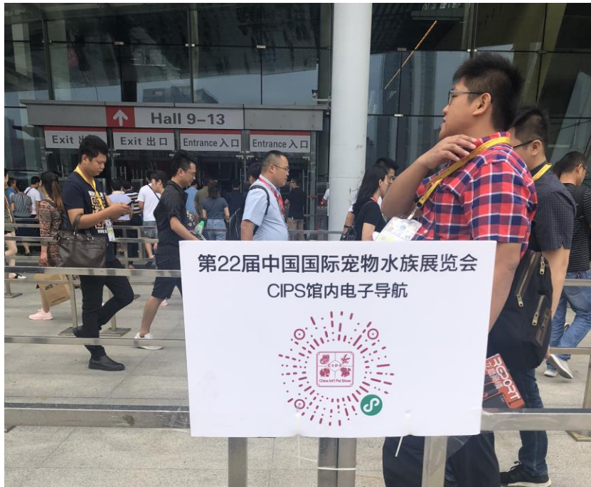
圖七、CIPS 展入口處備有 QRCall 電子導航