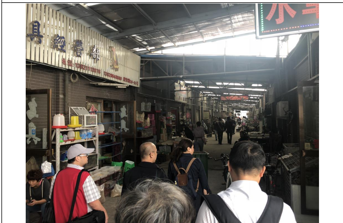
圖六、天津市中環花鳥魚市場