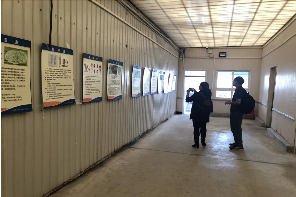
圖三、中國天津市潮弘休閒漁業有限公司疫病對應圖