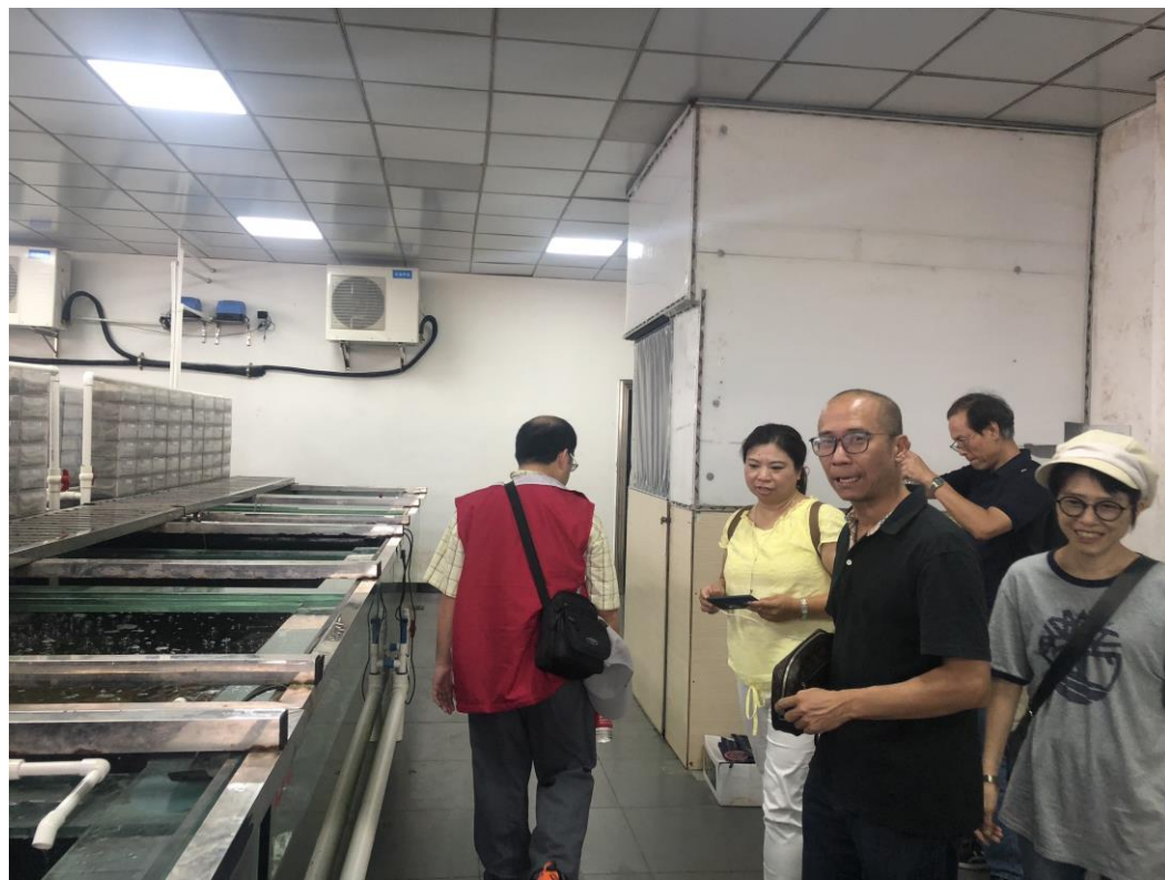
圖十二、宏揚水族場內