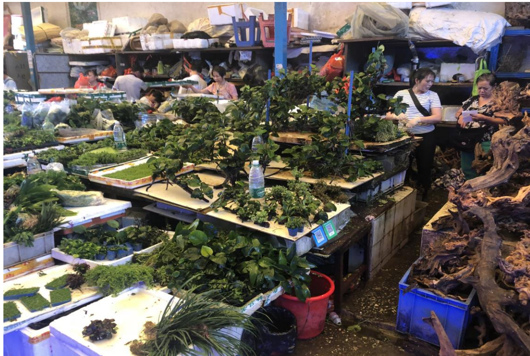
圖十七、廣州市花地灣花鳥魚蟲市場-水生植物