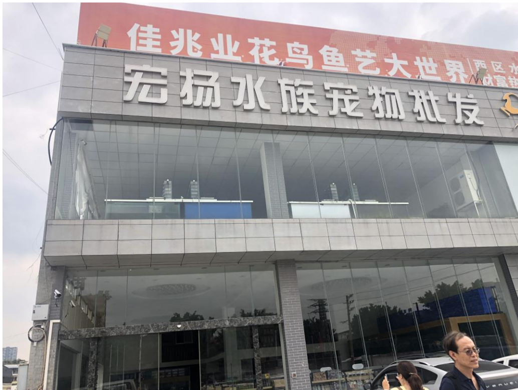
圖十一、廣州市宏揚水族