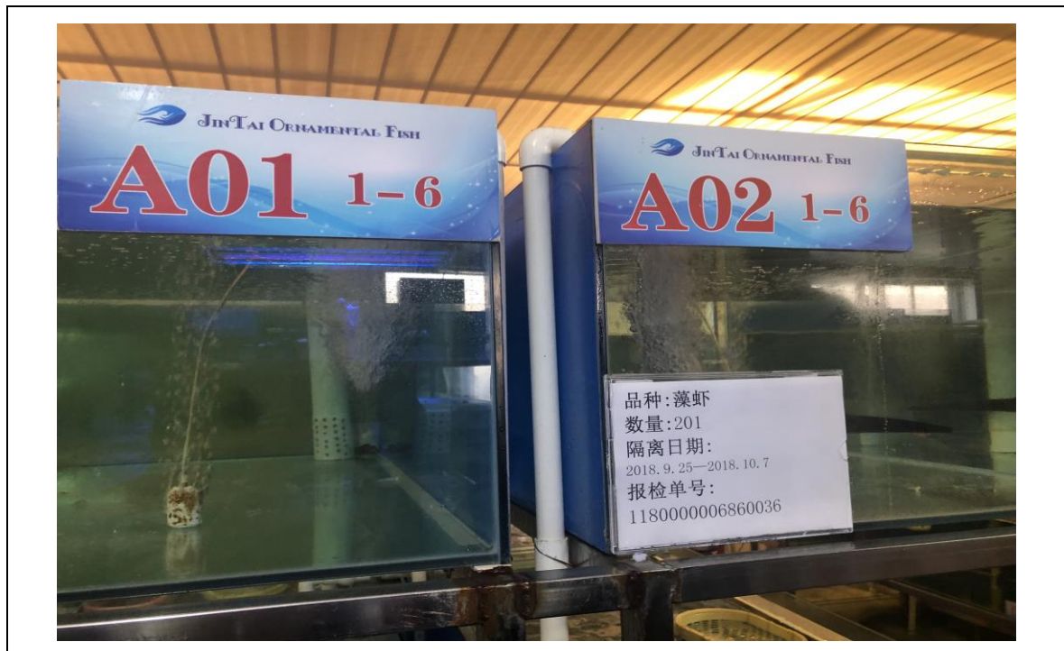
圖一、中國天津市金泰水族隔離檢疫場明確標示