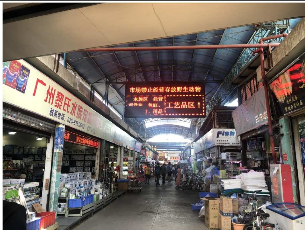
圖十五、廣州市花地灣花鳥魚蟲市場