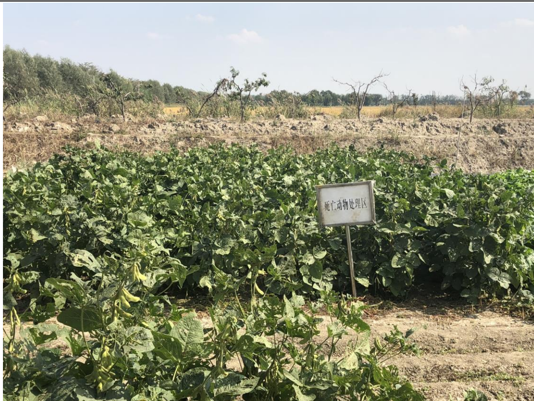
圖四、中國天津市潮弘休閒漁業有限公司設立死亡動物處理區