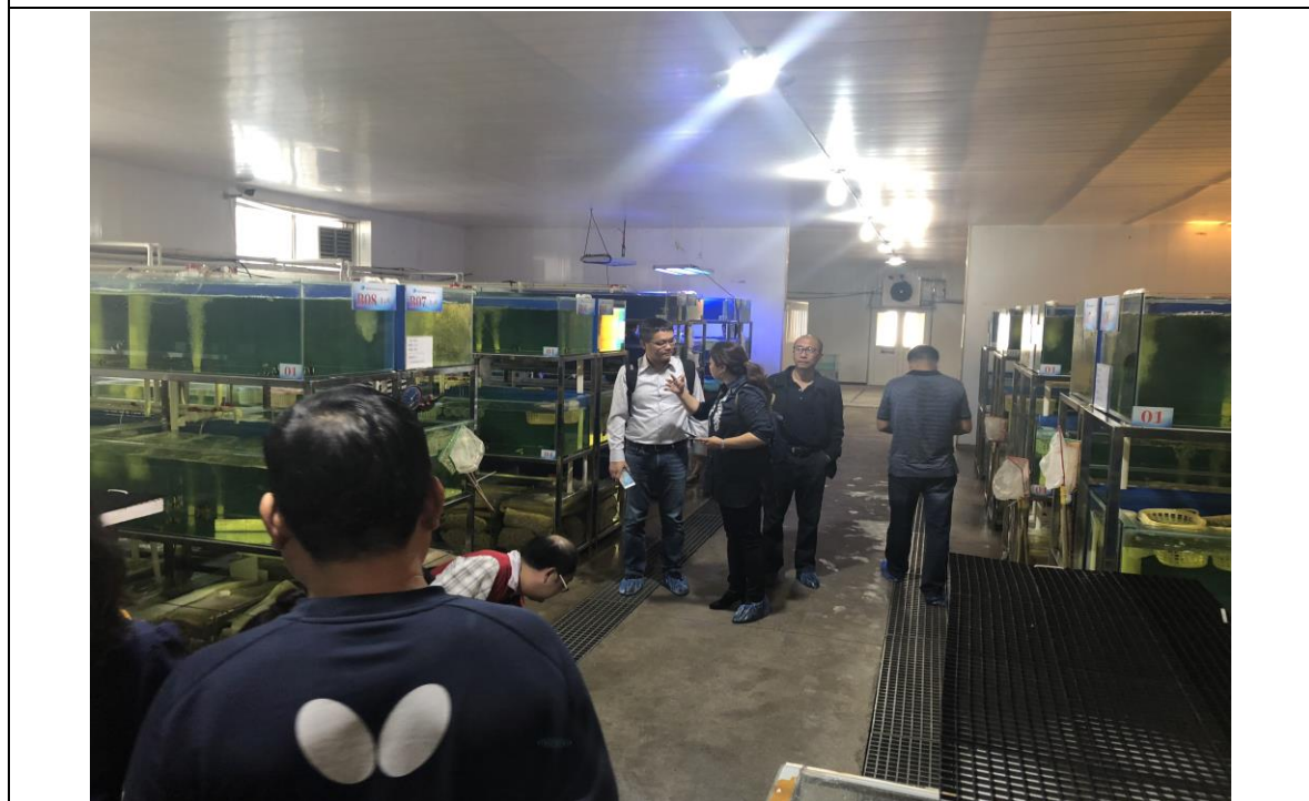
圖二、中國天津市金泰水族