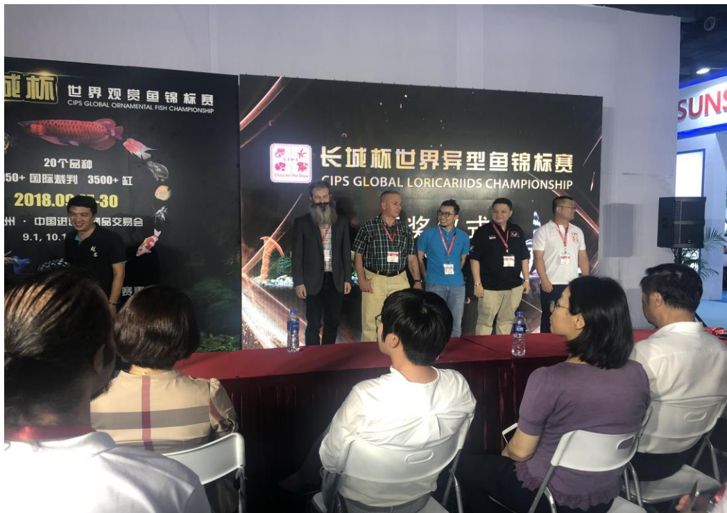
圖十、CIPS 展異形比賽頒獎