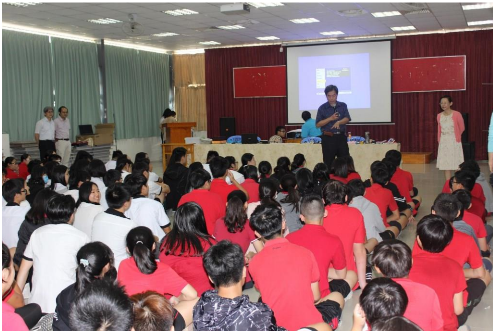
於臺灣學校對高中部學生做科學演講，數百名學生席地而坐。