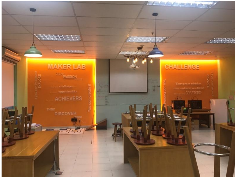
丁善理紀念中學的創客實驗室（Maker's Lab），收拾的整齊乾淨。

支持丁善理紀念中學的董事會有豐富資源，集團企業採多元經營，資產雄厚，能提供這所學校軟硬體完善的支援，學生普遍來自社經地位較高的社會層級，無論是學生本身或家長，都會學習和教育特別重視。良好的教學環境，又有深具先進教學理念和實行能力的校長，使得丁善理紀念中學成為全越南數一數二的優質學校。