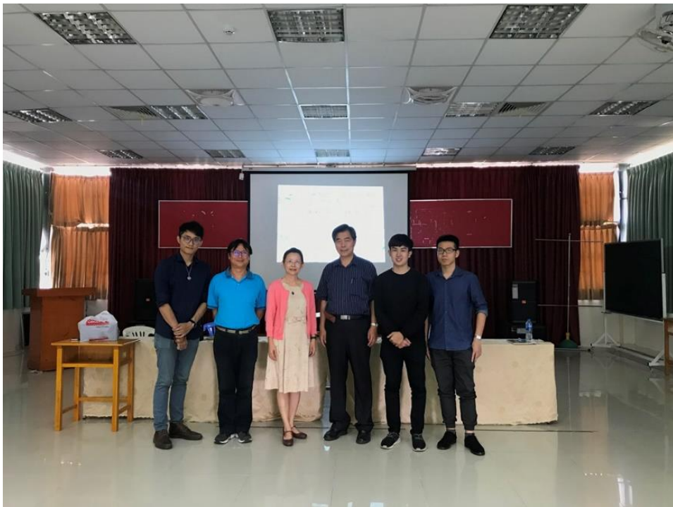
演講後與江校長和學校老師及演講助理合影，投影螢幕較小，設施也有待改善。

第三天（10/12）中午，抵達第七郡丁善理紀念中學，這所學校成立目的在於紀念早年臺灣企業家丁善理先生，由相關的基金會捐資興辦，所擁有的資源相當豐富，但這一間學校主要招收越南學生，因此學校語言為英文及越文。