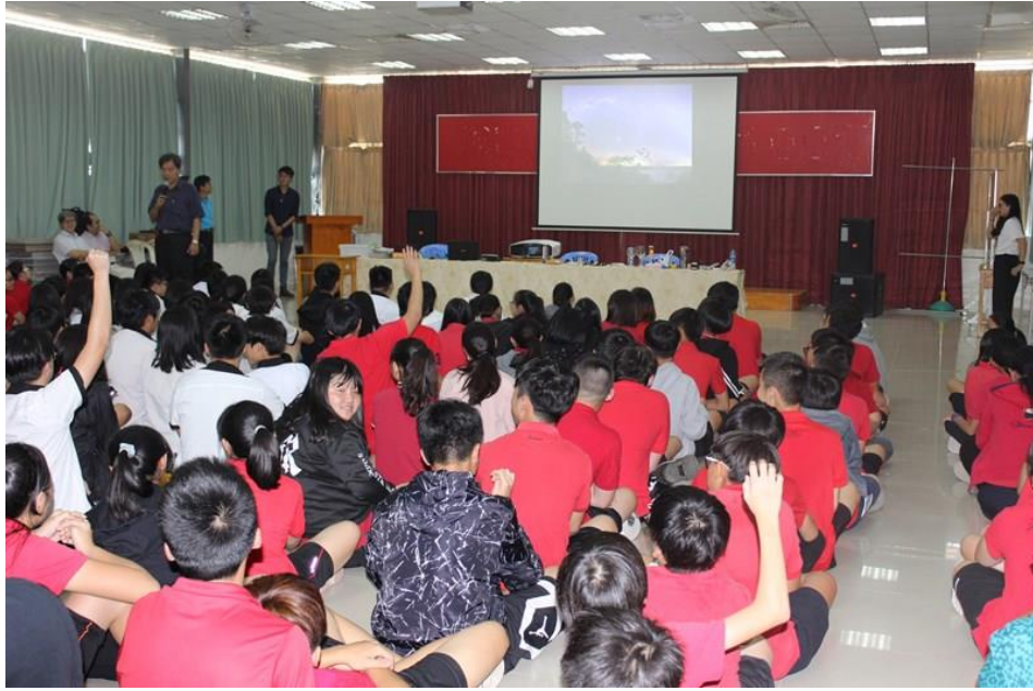
即使硬體條件並不好，但學生仍然充滿活力，踴躍參與討論，回答問題。