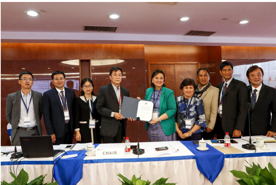
中國秘書處 與菲律賓秘 書處交接儀 式