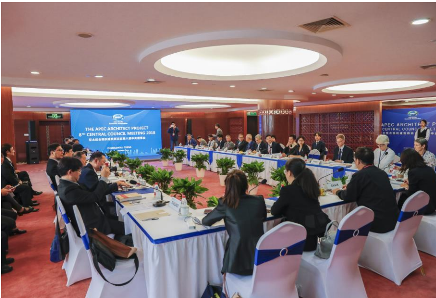
第八次中央議會會議情形