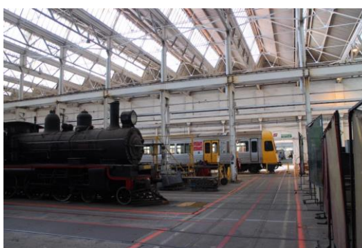
(右)館內主要展示廳與展示設計。