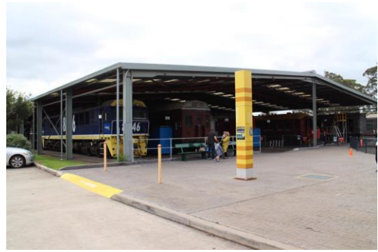
(左、右)通往戶外的大火車棚展示廳，是僅有屋頂的半開放空間，放滿了新南威爾斯鐵路公司的文資車輛。