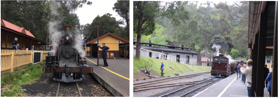
(左、右)蒸汽車頭準備反向推回起站前，需停泊加水，沿途更是吸引不少觀眾拍照錄影留念。